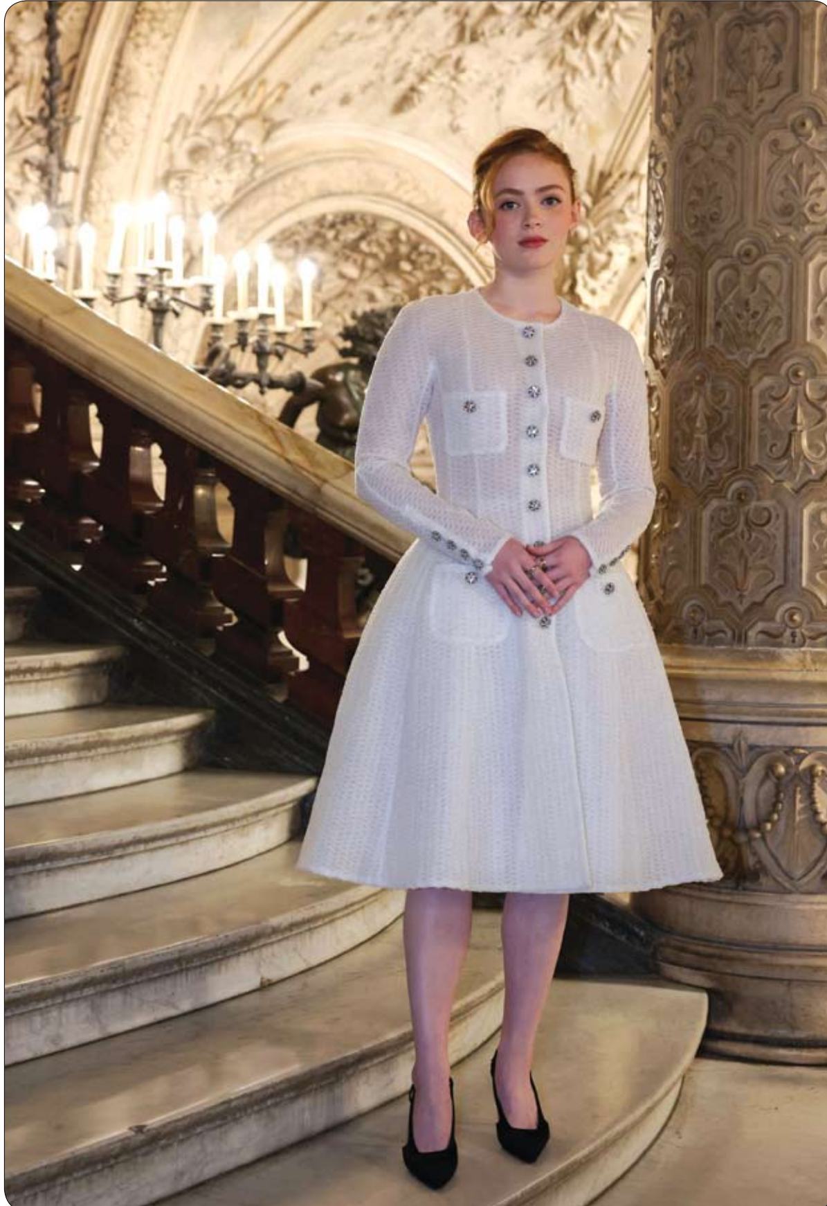
الممثلة الأمريكية سادي سينك لدى وصولها قبل عرض أزياء شانيل للآزياء لخريف وشتاء 2024 ضمن أسبوع الموضة في باريس.

واتضح أن الجمجمة والرفات تعود لأم مفقودة، تدعى "ماريتزا غلين غريميت"، اختفت عام 1979، بعد أن أخبرت أختها أنها ستنتقل عائلتها إلى كاليفورنيا، وفق صحيفة "ميور". وكانت الأم تزوجت في عمر العشرين، من جندي في مشاة البحرية الأمريكية في صيف 1978، وأنجبت طفلها الأول بعد فترة وجيزة، ولكن بحلول العام التالي، بدأ الزوجان إجراءات الطلاق، وقالت أخت الضحية، أن ماريتزا، اختفت بعد أن قالت إنها ستنتقل للساحل الغربي، ولم يتحدث معها أحد بعد ذلك. واستطاع خبراء تحديد شكل تقريبي لوجه المرأة، واتضح أنها كانت إما سوداء أو مختلطة العرق، وكانت ذات بنية ضئيلة، كما تمكن طاقم التحقيق من استعادة سن ذهبية واحدة.