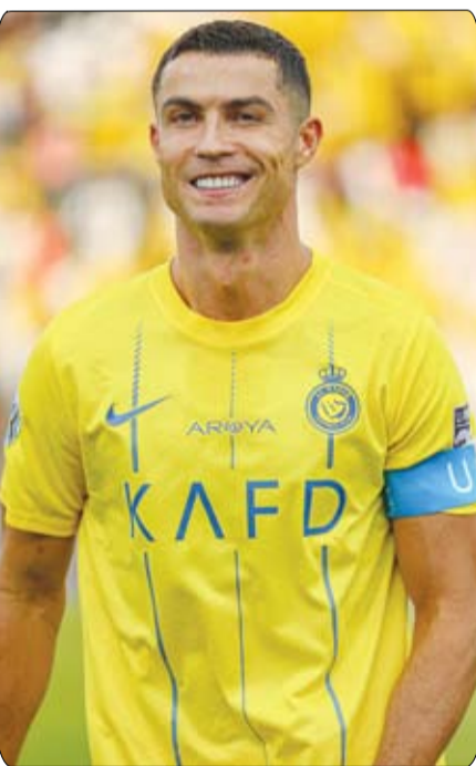
من دور واحد بين الفرق الثلاثة، فيما يفوز باللقب الفريق الأكثر حصداً للنقاط.