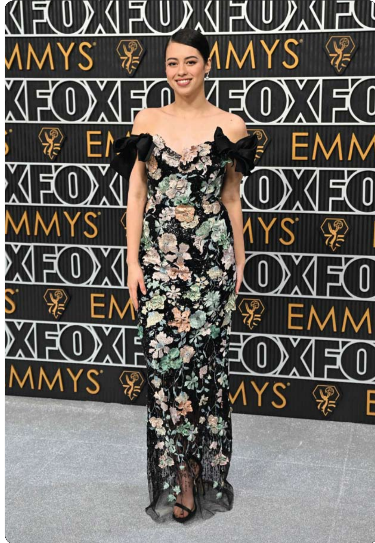
الممثلة الأمريكية أمبر ميدلندر لدى حضورها حفل توزيع جوائز إيمي في مسرح بيكوك في لوس أنجلوس.

منع كاتبه ويست زوجته بيانكا سبنسوري من استخدام وسائل التواصل الاجتماعي لحمايتها من التعليقات السلبية، في حين يعتقد أصدقاؤها أنه في الحقيقة تكتيك آخر لزيادة عزلتها. وقال مصدر مطلع لصحيفة ديلي ميل البريطانية "لطالما كان لدى بيانكا حسابات على وسائل التواصل الاجتماعي وكانت نشطة فيها حتى تزوجت من كاتبه. إنه لا يريد لها أن تستخدم هذه الوسائل لأنه يعتقد أنها ستعرض للأذى إذا اضطرت إلى قراءة الأشياء السيئة التي يقولها الناس".