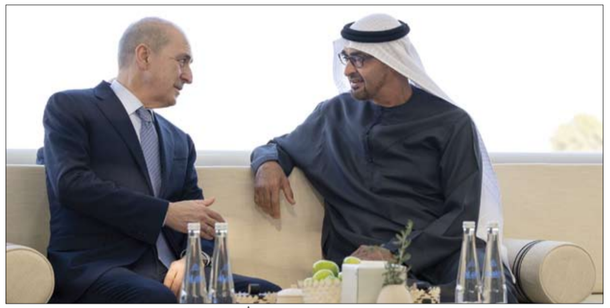
رئيس الدولة خلال استقباله رئيس مجلس الأمة التركي

دبي-وام: أكد صاحب السمو الشيخ محمد بن راشد آل مكتوم، نائب رئيس الدولة رئيس مجلس الوزراء حاكم دبي، رعاه الله، أن توفير أرقى معايير الرعاية الصحية في الإمارات تحقق بفضل منظومة طبية متطورة شاملة وعمل مشترك بين الحكومة الاتحادية والحكومات المحلية والقطاع الخاص هدفه صحة مواطنينا ومن يعيش على هذه الأرض، مثمناً سموه الشراكة الاستراتيجية بين القطاعين العام والخاص والتي أسهمت في رفع كفاءة القطاع الصحي بالدولة وتعزيز تنافسيته ورفده بمشآت صحية متطورة وكوادر عالية الكفاءة، وتقنيات بالغة التطور، بما يعود بالنفع على المجتمع ويكفل القوميات التي تضمن صحة أفرادها وجودة حياتهم. وأضاف سموه أن توفير