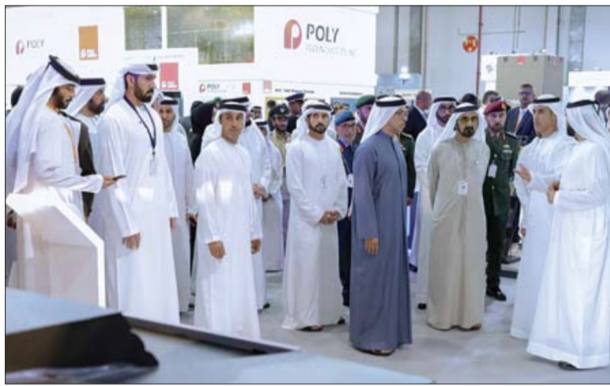
محمد بن راشد خلال زيارته معرض أيدكس 2023

أكد صاحب السمو الشيخ محمد بن راشد آل مكتوم، نائب رئيس الدولة رئيس مجلس الوزراء حاكم دبي، رعاه الله، أن المستوى الرفيع الذي وصل إليه القدرات الدفاعية لدولة الإمارات وما حققته من تقدم لافت في مجال الصناعات الدفاعية بابتكارات ومنتجات لاقت تقدير العالم، هو ثمرة نهج واضح اتبعته الإمارات منذ قيام دولة الاتحاد في السعي الدائم نحو إقرار