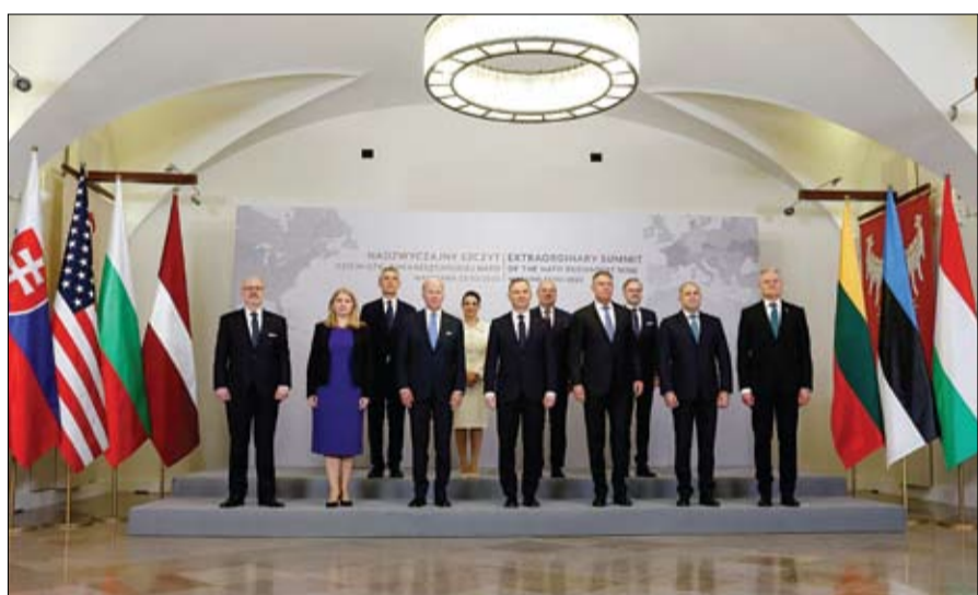
الرئيس الأمريكي خلال لقائه في وارسو زعماء دول أوروبا الشرقية الأعضاء في حلف شمال الأطلسي

وبعد إعلان بلاده الانسحاب من اتفاقية نيو ستارت النووية مع الولايات المتحدة، أكد ديميتري ميدفيديف، نائب رئيس مجلس الأمن الروسي، أن موسكو ستدافع عن نفسها بكل وسيلة