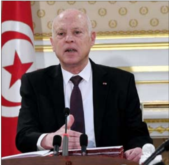
الرئيس التونسي: من يقف وراء هذه الظاهرة بتاجر البشر و يدعي أنه يدافع عن حقوق الانسان

كبيرة التي استهدفت مؤخرا مئات من المهاجرين واللاجئين من جنوب الصحراء تم إيقافهم بحجة مراقبة تواجدهم القانوني . وقد دعت هذه الأوساط إلى ضرورة إيلاء هذه الظاهرة وواقع هذا النزيف العنيف ما يستحق من الاهتمام من قبل الجهات المختصة تنسيقا بين الدولة لحقوق الإنسان وعدد من الصوك الدولية الخاصة باللجوء علاوة على تمتع هؤلاء المهاجرين بوجود إطار قانوني وتشريعي متين لحماية حقوق الإنسان على أراضيها.