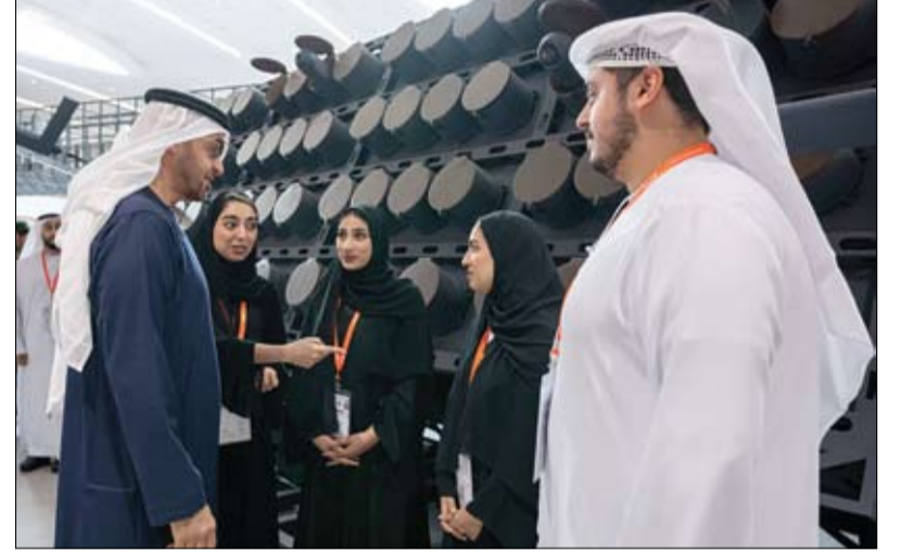
خلال فعاليات اليوم الثالث لمعرض آيدكس 2023