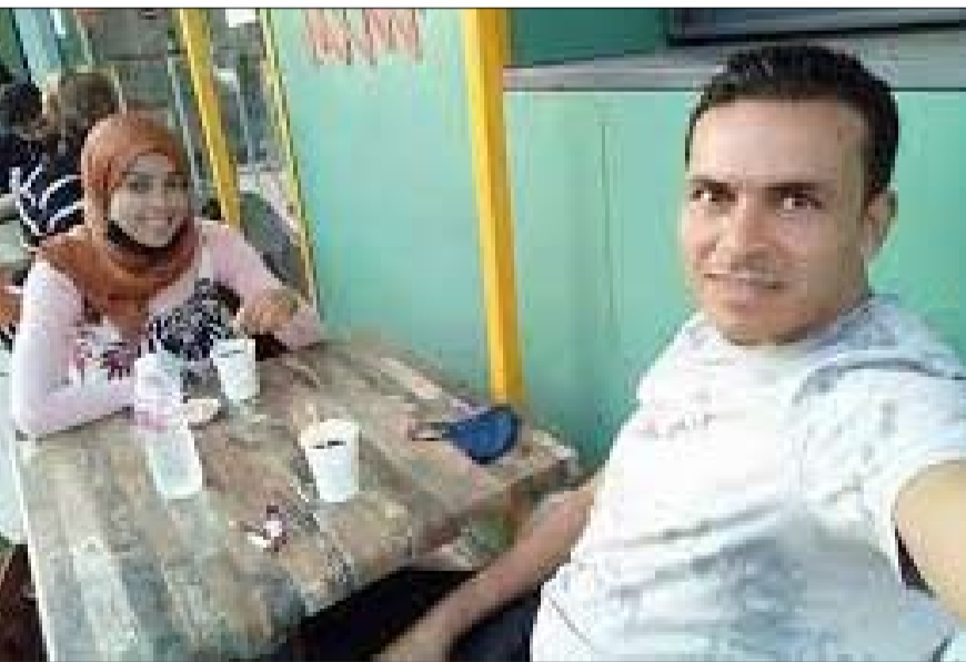
امين عام الحزب القومي التونسي حسام طويان