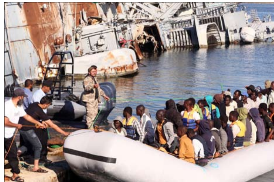
تونس تنقذ الاف المهاجرين

وقد أكد الرئيس سعيد خلال هذا الاجتماع هذا الوضع غير طبيعي مشيرا الى هنالك ترتيب إجرامي تم اعداده من مطلع هذا القرن لتغيير التركيبة الديموغرافية لتونس و ان هنالك جهات تلقت أموالا طائلة من أجل توطين المهاجرين من افريقيا جنوب الصحراء في تونس، مشيرا الى ان هذه الموجات المتعاقبة من الهجرة غير النظامية تهدد غير الملل منها هو اعتبار تونس دولة افريقية فقط ولا انتماء لها للامتئين العربية والاسلامية، وفق تعبيره . وأوضح الرئيس قيس سعيد أن تونس تعزز بانتمائها لإفريقي فهي من الدول المؤسسة لمنظمة الوحدة الإفريقية، وساندت العديد من الشعوب في تضالها من أجل التحرر والاستقلال، كما أن تونس تدعو إلى أن تكون إفريقيا للأفارقة حتى ينتهي ما عانتته الشعوب الإفريقية على مدى عقود من حروب ومجاعات . وشدد قيس سعيد على ضرورة وضع حد بسرعة لهذه الظاهرة وأن يحفل المهاجرين غير النظاميين من إفريقيا جنوب الصحراء ما زالت مستمرة مع ما تؤدي اليه من عنف غير قانوني وإيهاهم بان عقودا تنتظرم للعب في فرق رياضية او موسيقية أو في مؤسسات توفر لهم وضعا قانونيا، و عندما يصلون إلى تونس يواجهون بزيف هذه العقود و بضرورة دفع مستحقات مالية مقابل استخدامهم لتونس و دفع تكاليف سفرهم و اقامتهم في ظروف غير انسانية .