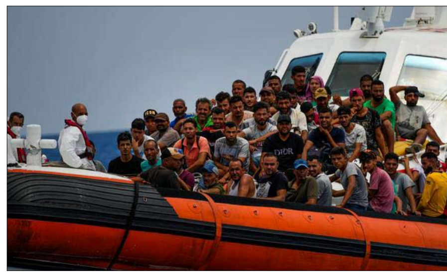
آلاف الإفارقة يعرضون حياتهم للخطر خلال رحلة الهجرة

وتتوسع هذه الأيام باطراد هذه الحملات بعد ان انخرطت جهات حزبية على غرار حراك 25 جويلية والحزب القومي التونسي فيها رفضا لما تصفه "مشروع توطين اللاجئين الأفارقة واللاجئين غير النظاميين في تونس"، مروجة لأرقام تخصم 700 ألف ومليون شخص منهم 345 ألف متواجدين بمحافظة صفاقس، عاصمة الجنوب التونسي، دون وثائق، يحمل 40 % منهم فيروس وساء النفلر الأسود، وأن عدد الولادات اليومية في أوساطهم هي ما بين 14 إلى 25 حالة ولادة، ويضيفون بأنه تم إحصاء خلال سنة 2022 ما يقارب المائتي حالة اعتداء وسرقة واغتصاب قام بها بعض هؤلاء .