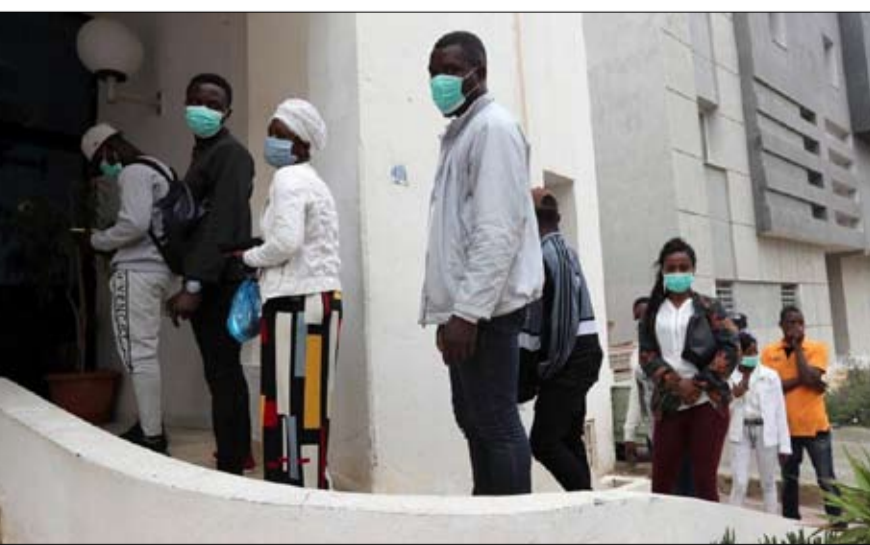
إفارقة يسعون للتعايش والإقامة في تونس