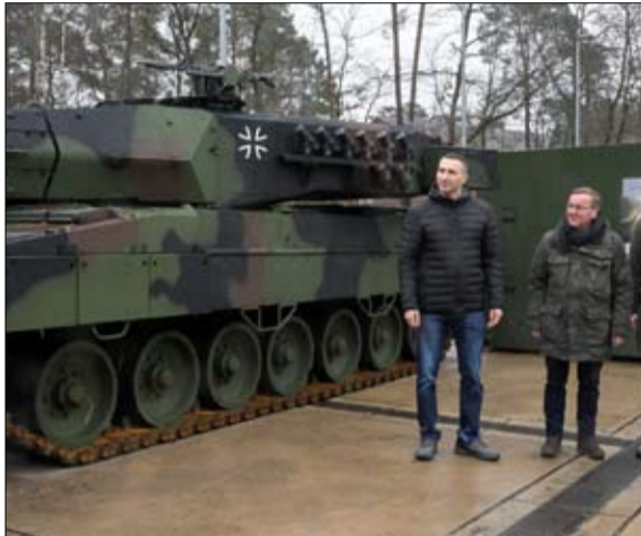
الدفاع الجوي، والأهم من ذلك المدفعية، بما في ذلك مئات البنادق الكبيرة المتوافقة مع قذائف النمط الغربي.

يقول الكاتب والمؤلف ديفيد أوكس، إنه مع تخبير نوع الأسلحة المتجهة من الغرب إلى أوكرانيا، تتغير كذلك قواعد اللعبة في كيف التي ستصبح قواتها في موضع هجوم مستغلة أفضل الدبابات والصواريخ بعيدة المدى والغربات المدرعة في العالم، بعد عام من بدء الحرب في أوكرانيا، وبينما يستعد الجيش الروسي لهجوم متجدد، تغير نوع الأسلحة المتجهة إلى أوكرانيا بشكل كبير، إذ بعد أن كانت حزمات بنائق ورصاص وصواريخ وقطع المدفعية، أصبحت الآن عربات مدرعة وصواريخ بعيدة المدى ودبابات متقدمة بعضها الأفضل في العالم.