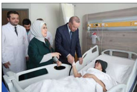
أردوغان وزوجته يزوران جرحى الزلزال الذين يلتقون العلاج في أنقرة.

فقد أفاد مصدر حكومي مطلع بأن الغارات الإسرائيلية استهدفت اجتماعاً سورياً ضم خبراء تقنيين من الحرس الثوري مع مهندسين من جيش النظام السوري، ليحتضروا إنتاج طائرات مسيرة وصواريخ موجهة، بإدارة الحرس الثوري. إلا أن المصدر أوضح أن تلك الغارات لم تؤد إلى مقتل أي خبير إيراني رفيع المستوى. إلى ذلك، أشار إلى أن الغارات استهدفت مركزاً كانوا يلتقون فيه باستمرار، فضلاً عن شقة سكنية، ما أدى إلى مقتل مهندس سوري ومسؤول إيراني آخر.