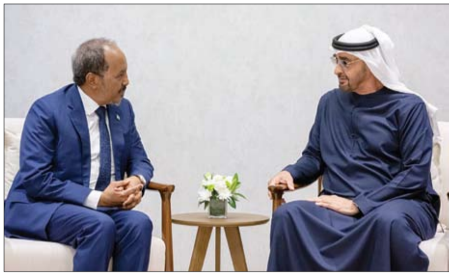
رئيس الدولة خلال مباحثاته مع الرئيس الصومالي

من جهة أخرى استقبل صاحب السمو الشيخ محمد بن زايد آل نهيان رئيس الدولة حفظه الله أخاه صاحب السمو الملكي الأمير سلمان بن حمد آل خليفة ولي العهد رئيس مجلس وزراء مملكة البحرين الشقيقة.