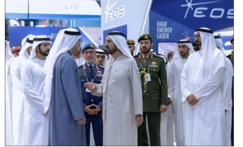
زار معرض أيدكس 2023 وأشاد بتطور الصناعات الدفاعية الإماراتية