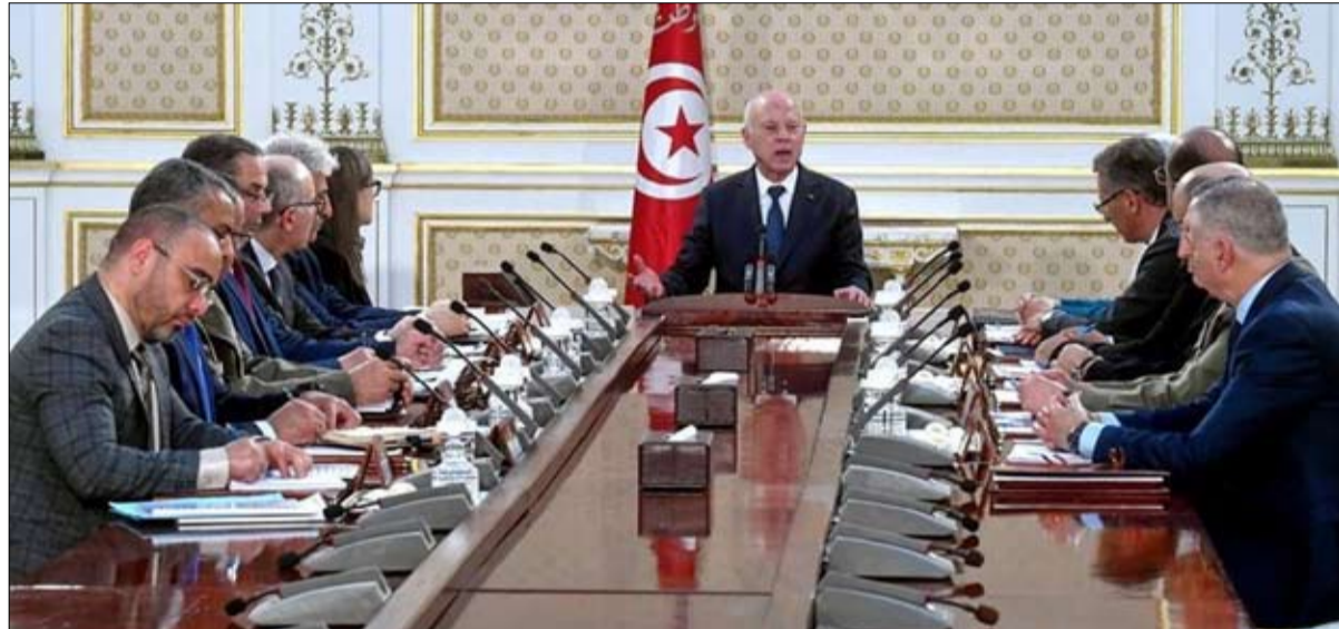
قيس سعيد أثناء ترأسه اجتماعا لمجلس الامن القومي