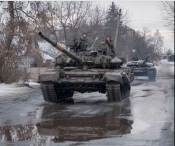
تبرعت بولندا بأكثر من 200 دبابة قديمة كان بعضها من طراز تي 72 السوفيتي السابق، وكان البعض الآخر من المتغيرات محلية الصنع من نفس النوع السوفيتي.

وساهمت لاغوس في جعل نيجيريا إلى قوة ثقافية عالمية بفضل قطاع نوليوود، وهي الصناعة السينمائية النيجيرية القوية جداً، وموسيقى "أفروببت" التي اجتاحت الكوكب مع فنانيه مثل بورنا بوي ووزير كتي. لكن الرئيس المقبل لأكثر اقتصاد في القارة الإفريقية وأكبر دولة نفطية فيها سيرت سلسلة من المشاكل، من أعمال العنف الإجرامي والمتطرف في الشمال والوسط إلى الاضطرابات الاضفالية في الجنوب