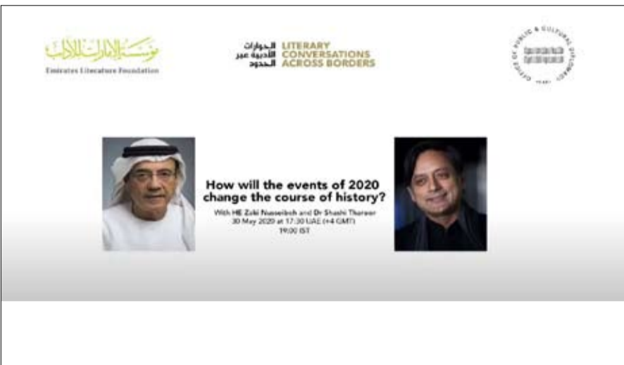
مناقشة مجموعة متنوعة من الموضوعات الحيوية الهامة، ويتضمن الموسم الأول من البرنامج ثمان جلسات، وسيتم الإعلان عن المزيد من التفاصيل والمزيد من الإثبات قريباً.