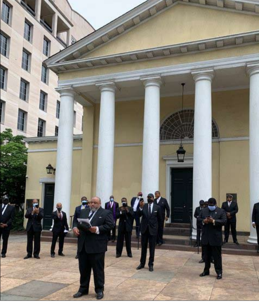
القساوسة يطالبون الرئيس بإنهاء وحشية الشرطة والتضامن مع المحتجين