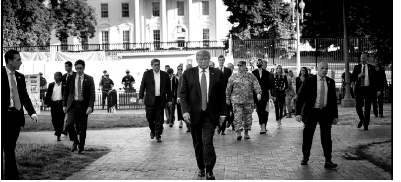
الرئيس في طريقه الى الكنيسة سيراً على الاقدام