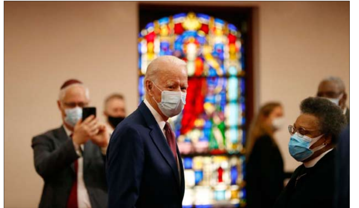
بايدن في كنيسة