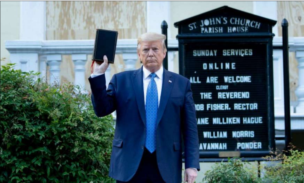
صورة لم تحقق هدفها

من البيت الأبيض، قامت الشرطة، بموجب أوامر وزير العدل بيل بار، بتفريق مظاهرة سلمية باستخدام الغاز المسيل للدموع والرصاص المطاطي، وعدم التردد في ضرب المتظاهرين والصحفيين بالهراوات. بعد مروره أمام جدار كتب عليه "اللجنة على ترامب"، وصل الرئيس أمام كنيسة القديس يوحنا، التي تم إحراق قبوها قبل يوم. ثم أخرجت ابنته إيفانكا