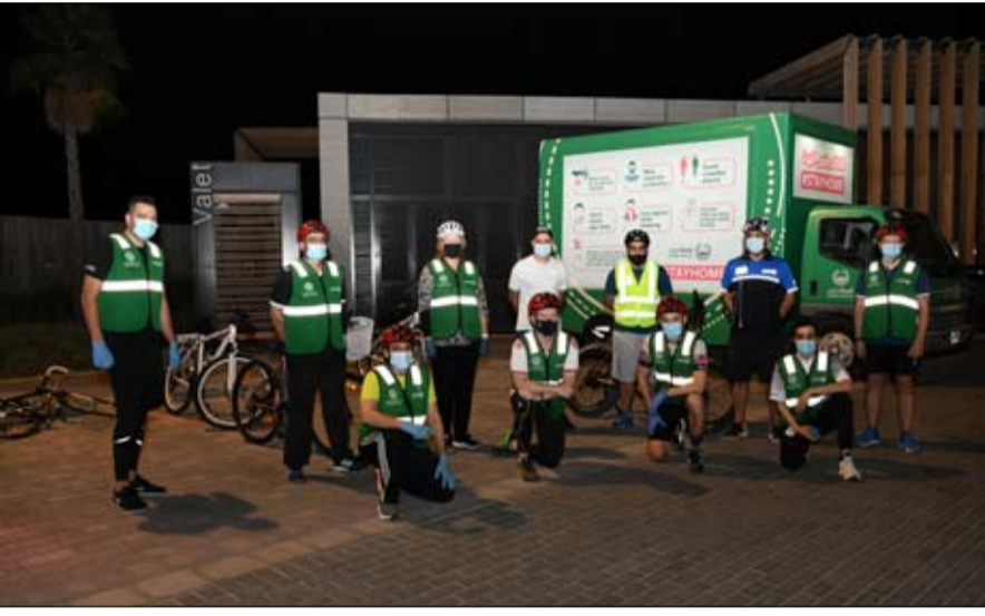
في التعاون الدولي، وكانوا سعداء في إشعار الناس بتواجد الشرطة في كل مكان وفي كل الأوقات لتطبيق القوانين والالتزام بالإجراءات الاحترازية.

أطلقت دار زايد للرعاية الأسرية بالتعاون مع هيئة أبوظبي الرقمية الموقع الإلكتروني للدار وأعلنت عن توفير خدماتها بنسبة 100% على منظومة خدمات أبوظبي الحكومية الموحدة "تم". وتأتي هذه المبادرة استكمالاً لجهود حكومة أبوظبي لدفع عجلة التحول الرقمي على امتداد الإمارة، وتوظيف الحلول الرقمية في خدمة المجتمع والارتقاء بمنظومة العمل الحكومي. وتندرج المبادرة في إطار سعي دار زايد للرعاية الأسرية بالشراكة والتعاون مع هيئة أبوظبي الرقمية - الجهة الحكومية التي تتولى الإشراف على منظومة خدمات أبوظبي الحكومية الموحدة "تم" - نحو استثمار وتسخير الوسائل التكنولوجية الحديثة في تسهيل الخدمات على المتعاملين لضمان أسهل الوسائل لتقديم الخدمات