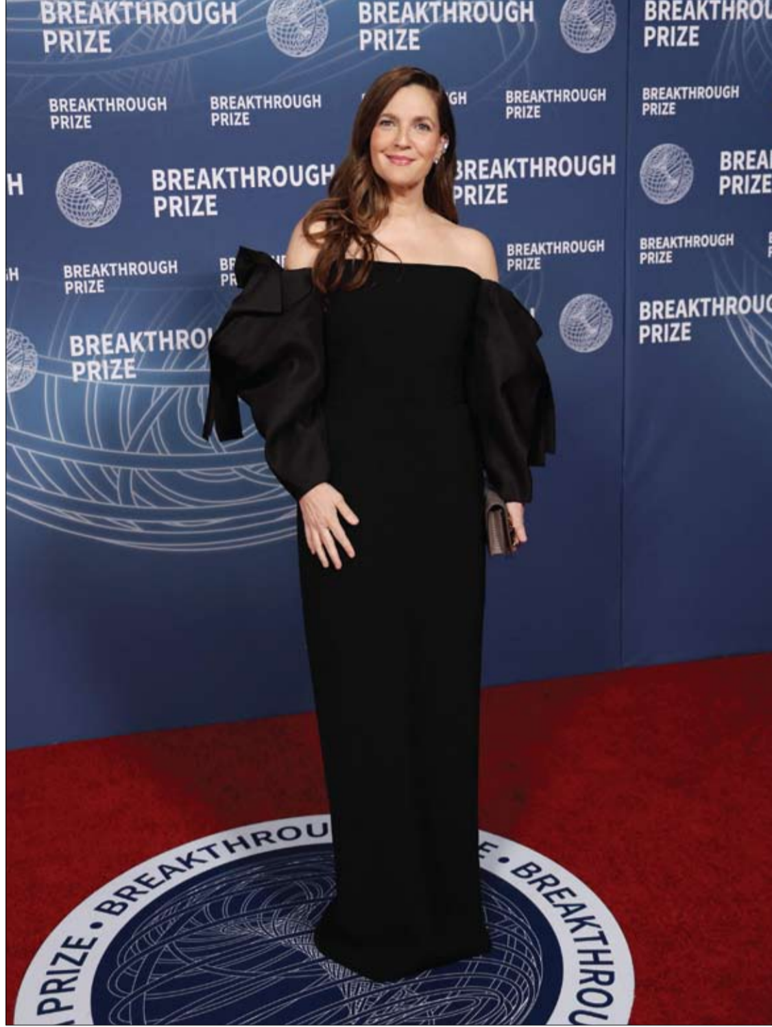
الممثلة الأمريكية درو باريمور تحضر حفل توزيع جوائز Breakthrough Award في كاليفورنيا.

وتوصي الخبيرة بإعطاء الأفضلية للكربوهيدرات المعقدة، التي تحافظ على توازن الطاقة وتحسن الهضم. هذه الكربوهيدرات موجودة في الخضروات (البروكلي، السبانخ، الجزر)، الحبوب الكاملة (الأرز البني، الكينوا، الحنطة السوداء)، البقوليات (العدس، الحمص، الفاصوليا)، وكذلك الفواكه والتوت.