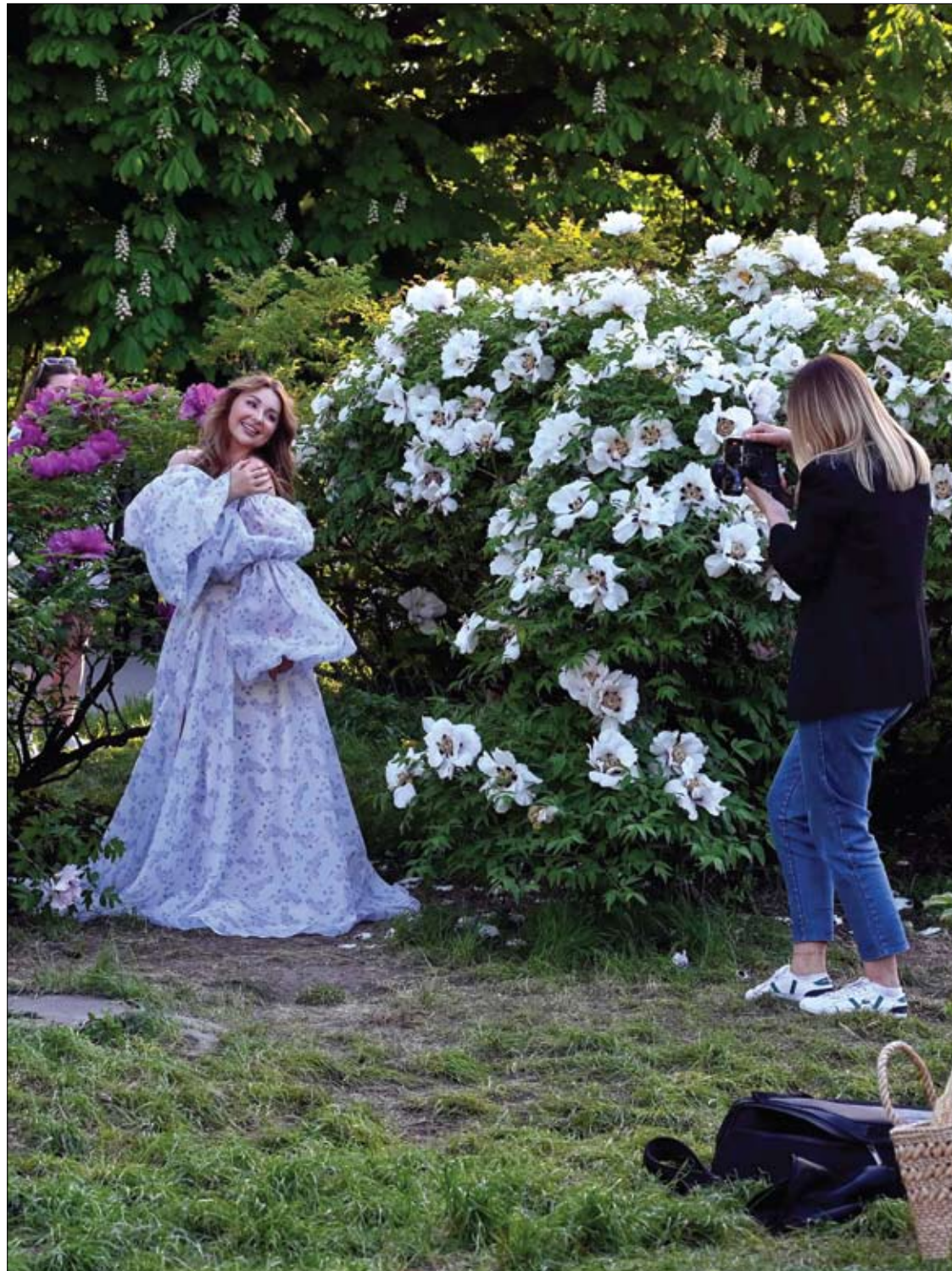
امرأة تلتقط صورة لزميلتها تقف بالقرب من شجيرات الفاوانيا المزهرة في الحديقة النباتية في كيبف.