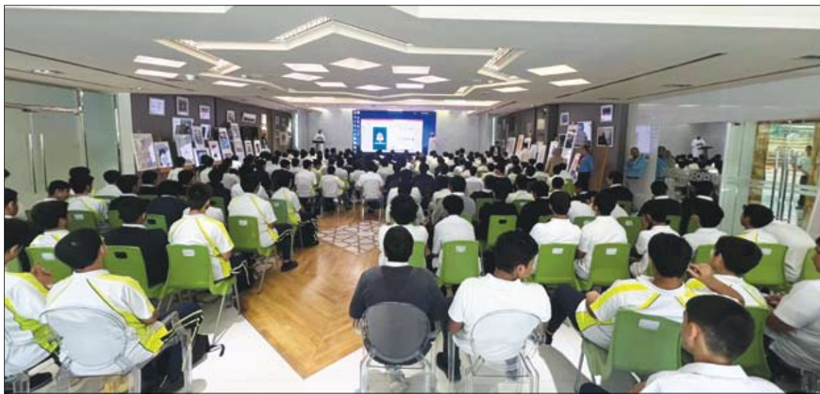
استفاد منه طلبة مدرسة البحث العلمي

رمزاً للإلهام والتحفيز للجميع، وسيبقى ذكره حاضرة في قلوبنا وذاكرتنا كمصدر للإلهام والقوة. وأشاروا، أن الشيخ طحنون رحمه الله ترك بصمة لا تمحى في ميادين العطاء والعمل الإنساني، حيث بذل جهوداً كبيرة لخدمة المجتمع وتحقيق الرخاء للجميع. إن إرثه العظيم سيظل حياً في قلوب الناس وفي ذاكرة