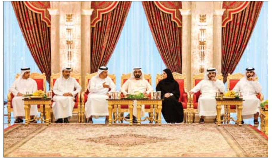
محمد بن راشد خلال استقباله مجلس علماء الإمارات وأعضاء مجمع محمد بن راشد للعلماء

التقى ولي عهد الأردن ووزراء الإعلام في الدول الداعية لمكافحة الإرهاب محمد بن زايد: محاربة التطرف والإرهاب إعلامياً وفكرياً لا تقل أهمية عن محاربته أمنياً وعسكرياً •• أبو ظبي - وام: استقبل صاحب السمو الشيخ محمد بن زايد آل نهيان ولي عهد أبوظبي نائب القائد الأعلى للقوات المسلحة أمس في قصر البطين المشاركين في الاجتماع الرباعي المناقشة سبل تنسيق المواقف وتطوير آليات التعاون لمواجهة أفة دعم وتمويل واحتضان التطرف والإرهاب. (التفاصيل ص 2)