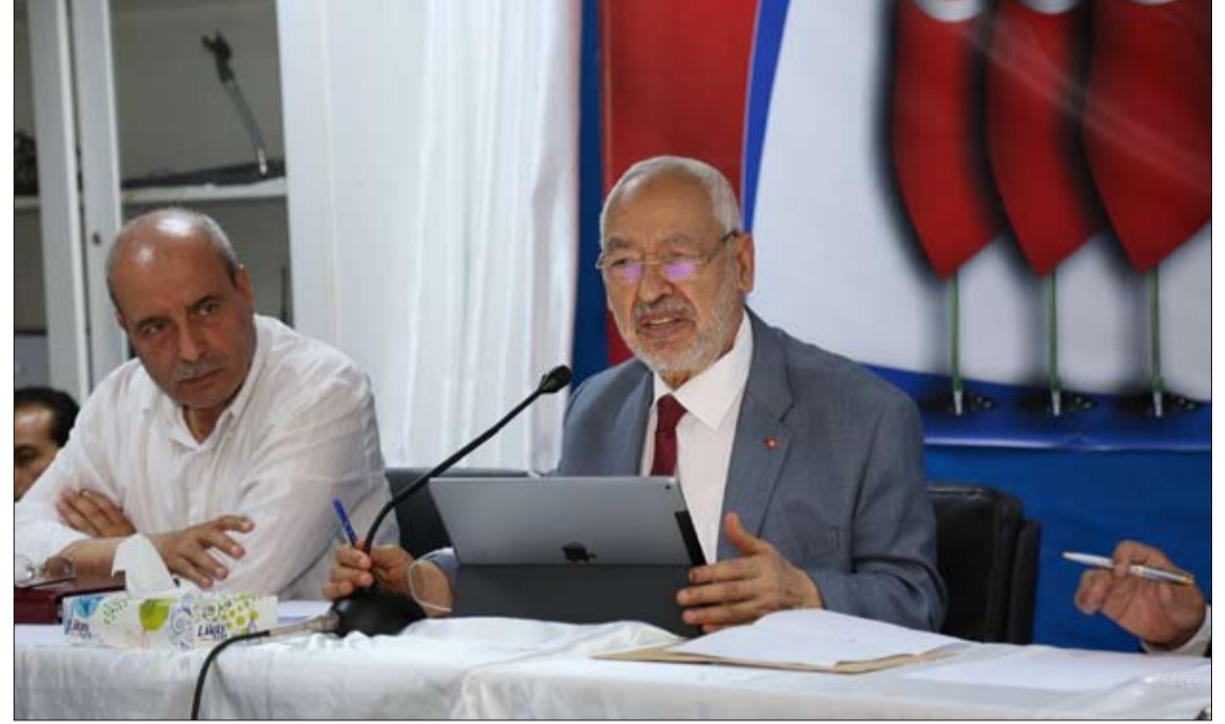
النهضة.. لا تغيير للحكومة