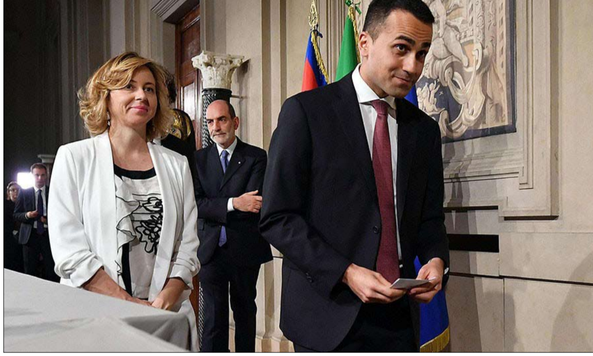
دي مايو يرفض خبيرا يمنح الدروس

صبت ملايين الدولارات التي تتركها حكومة نيجيريا رسميا لمكافحة غياب الامن، في الواقع في منظومة واسعة من "الصناديق السرية" المخصصة للفساد، كما ذكرت امس منظمتان غير حكوميتين في تقرير قبل عام واحد من الانتخابات الرئاسية. وتشهد نيجيريا عددا من النزاعات الدامية من تمرد جماعة بوكو حرام في شمال شرق البلاد الى المواجهات المستمرة بين المزارعين ومربي الماشية من اجل الحصول على موارد في ولايات الوسط. ونشر الجيش المنتشر على كل الجبهات، قوات في الشمال ايضا الذي تنتشر فيه عصابات تقوم بعمليات خطف وسرقة ماشية على نطاق