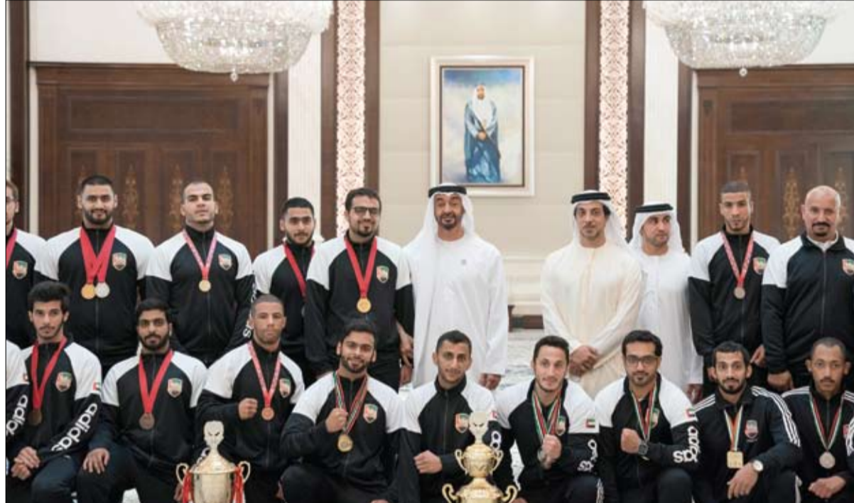
مؤكدين مواصلة جهودهم لحصد المزيد من الألقاب داعين الله عز وجل به رياضات أصحاب الهمم وغيرها من الرياضات على الصعيد الوطني