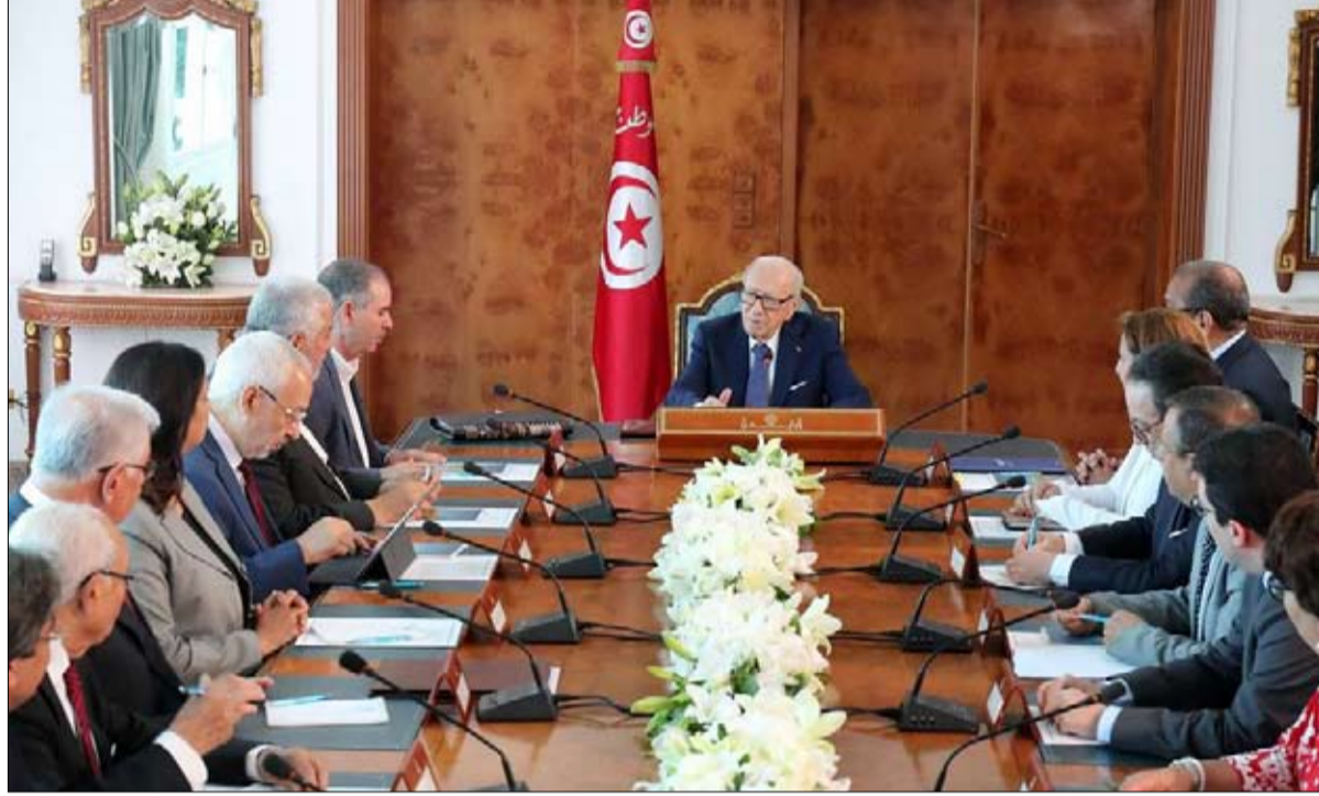
السياسي يختتم اجتماع وثيقة قرطاج

أمرت المحكمة العليا في مدغشقر الرئيس بإقالة الحكومة وتعيين رئيس وزراء جديد يحظى بتأييد جميع الأحزاب السياسية في إطار خطوات لاحتواء أزمة سياسية في الجزيرة الواقعة في المحيط الهندي. وقالت المحكمة الدستورية العليا في وقت متأخر يوم الجمعة الماضية إن الخطوة جاءت نتيجة لفشل الرئيس هيري راجوناريامامبيانيا في تشكيل حكومة عليا تفصل في جرائم الساسة البارزين. وقالت المحكمة في بيان "على أن ينهي رئيس الجمهورية عمل الحكومة ويعين رئيس وزراء توافقيا خلال سبعة أيام من إعلان هذا القرار من قائمة تضم ثلاثة أسماء على الأقل.. وفي وقت سابق هذا الشهر وافق الرئيس على قانون جديد للانتخابات يلغي بندا كان من شأنه منع مرشح المعارضة الرئيسي مارك رافالومانانا من المنافسة على المنصب مما أثار أزمة سياسية ومظاهرات دموية في الشوارع.