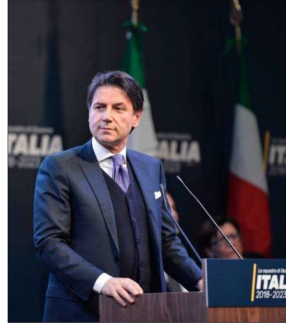
جوزيبي كونتي رمى المنديل

سياسية جديدة، لعلها غير مسبوقة، في نظر صحيفة لا ستامبا، لأن الرئيس، في هذه المرة، لم يستسلم. فقد رفع الورقة الحمراء في وجه رابطة الشمال وحركة 5 نجوم، اللذين ارادا فرض وزير لا يمكنه القبول به. لذلك، هناك خطر تحول المازق السياسي إلى واحدة من تلك الأزمات المؤسسية الجديدة التي يملك الإيطاليون سرها، ويعرفون دائما كيف يُسبونها بشكل مبدع. لقد كان سافونا، الخط الأحمر الذي لا يمكن تجاوزه" لرئيس