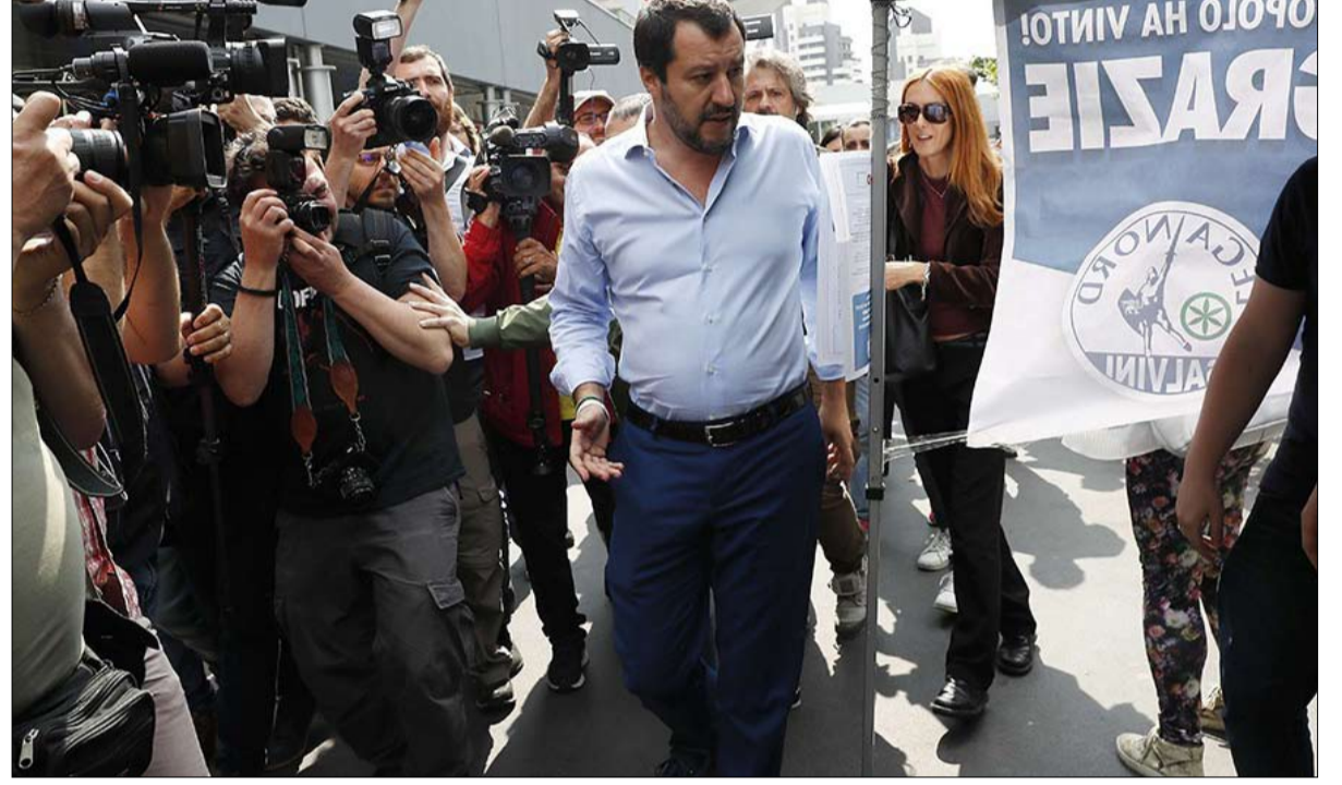
سالفاني نند بمن اسماه ممثل المالية الدولية