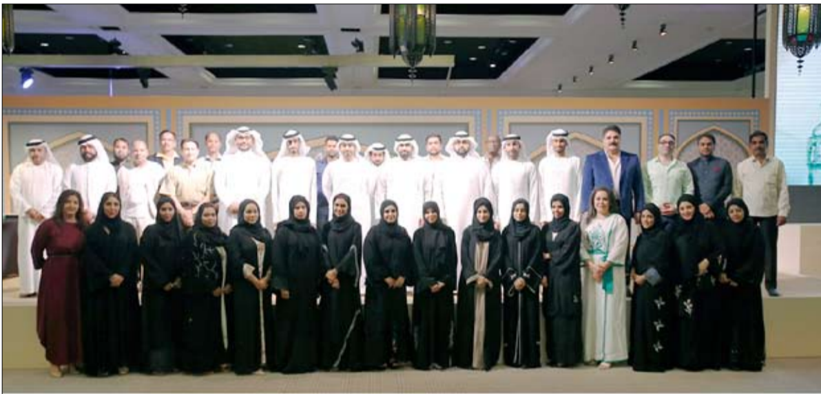
الرخاء ويتقبل منا صالح والأعمال. وأعرب عن شكره لصاحب السمو الشيخ الدكتور سلطان بن محمد بن سلطان القاسمي عضو المجلس الأعلى حاكم الشارقة وسمو الشيخ سلطان بن محمد بن سلطان القاسمي ولي عهد ونائب حاكم الشارقة رئيس المجلس بقطاع الطيران في إمارة الشارقة

وبارك سعادة الشيخ خالد عصام القاسمي للجميع بشهر رمضان المبارك أعاده الله على الأمتين العربية والإسلامية باليمن والبركات.. وشال الله أن يديم علينا الأمن والأمان والاستقرار