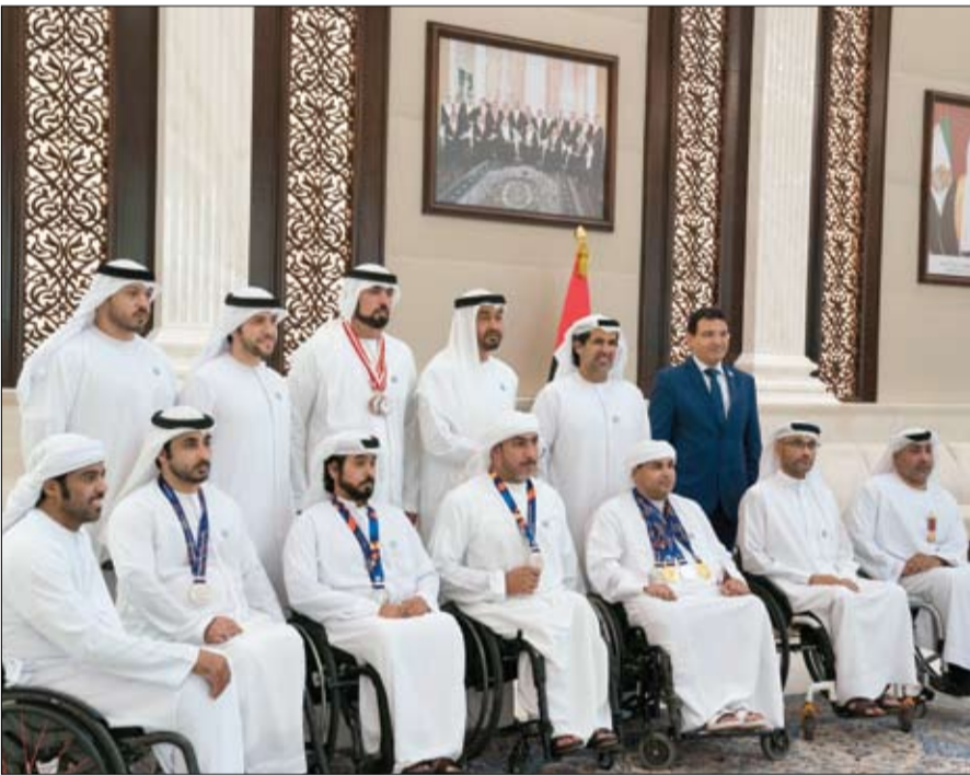
أن يعيد هذا الشهر المبارك على دولة الإمارات وهي تتمتع بالخير والتقدم والازدهار والأمن والأمان في ظل القيادة الحكيمة لصاحب السمو الشيخ خليفة بن زايد آل نهيان رئيس الدولة "حفظه الله".