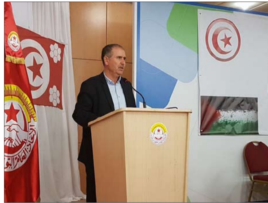
الطوبوي ينسحب غاضبا

النهضة تتمسك في المقابل، أكد رئيس حركة النهضة راشد الغنوشي، أن الحركة لا ترى مصلحة لتونس في تغيير حكومة يوسف الشاهد،