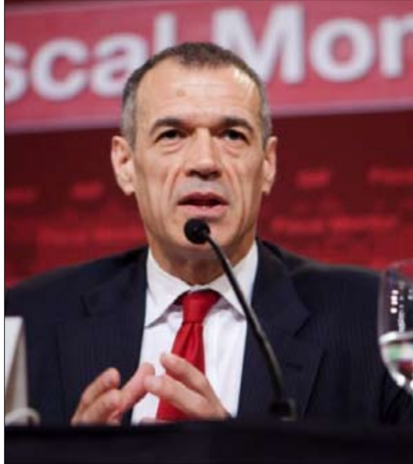
كارلو كوتاريلي رجل الانقاذ

الكوبرينال يتعزز وهكذا، فإن المهمة الوحيدة لكوتاريلي الشجاع، ستكون "قيادة البلاد إلى انتخابات جديدة، في مناخ يبدو مكهريا". الا ان البعض يثنى على هذا الاختيار، لأنه على الأقل يعزز سلطة رئيس للجمهورية "على الطريقة الفرنسية"، أخيرا رئيس دولة حقيقي في إيطاليا، لأنه في الواقع، يكاد يكون رئيسا للحكومة حتى التاسع من سبتمبر، تاريخ يتردد انه موعد لانتخابات مبكرة. انتخابات جديدة ترى فيها صحيفة كوريري ديلا سيرا معركة "ستدور رحاها حول اليورو". ومع ذلك، لا يزال الخوف قائما من أن "العسكر المؤيد لأوروبا الذي يتشكل من فورزا إيطاليا والحزب الديمقراطي، قد يكون ضحية مفاجأة جديدة وتتجاوزها الاحداث.