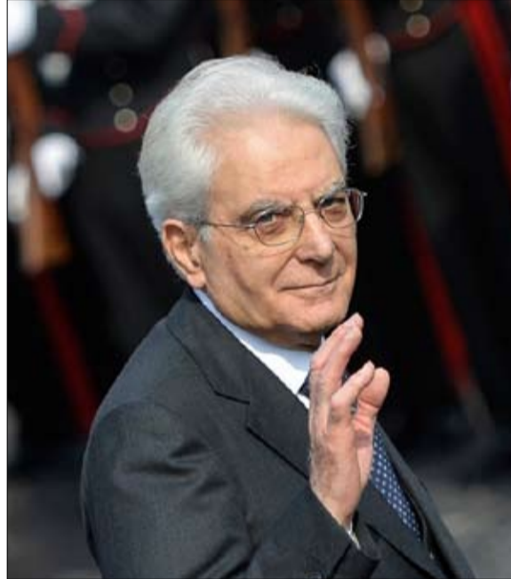
ماتاريللا استخدم حق النقض

يجسد النبا منذ نهاية الحرب "رسالة ثقة أو إنذار فورية للفاعلين في الاقتصاد والمال"، تقول لا ريبوبليكا، وهي صحيفة يومية وفتية لخط الكوبرينال، مثل سياسيين إيطاليين آخرين يعتبرون من المحنكين، وحسن الحظ أكثر استعدادا للدفاع عن القيم الوطنية والأوروبية؛ مسؤول كبير سابق في صندوق النقد الدولي، لم يتم اختيار كارلو كوتاريلي عشوائيا من قبل معلمه، الذي يعرف جيدا سهامه ضد البرنامج المشترك بين