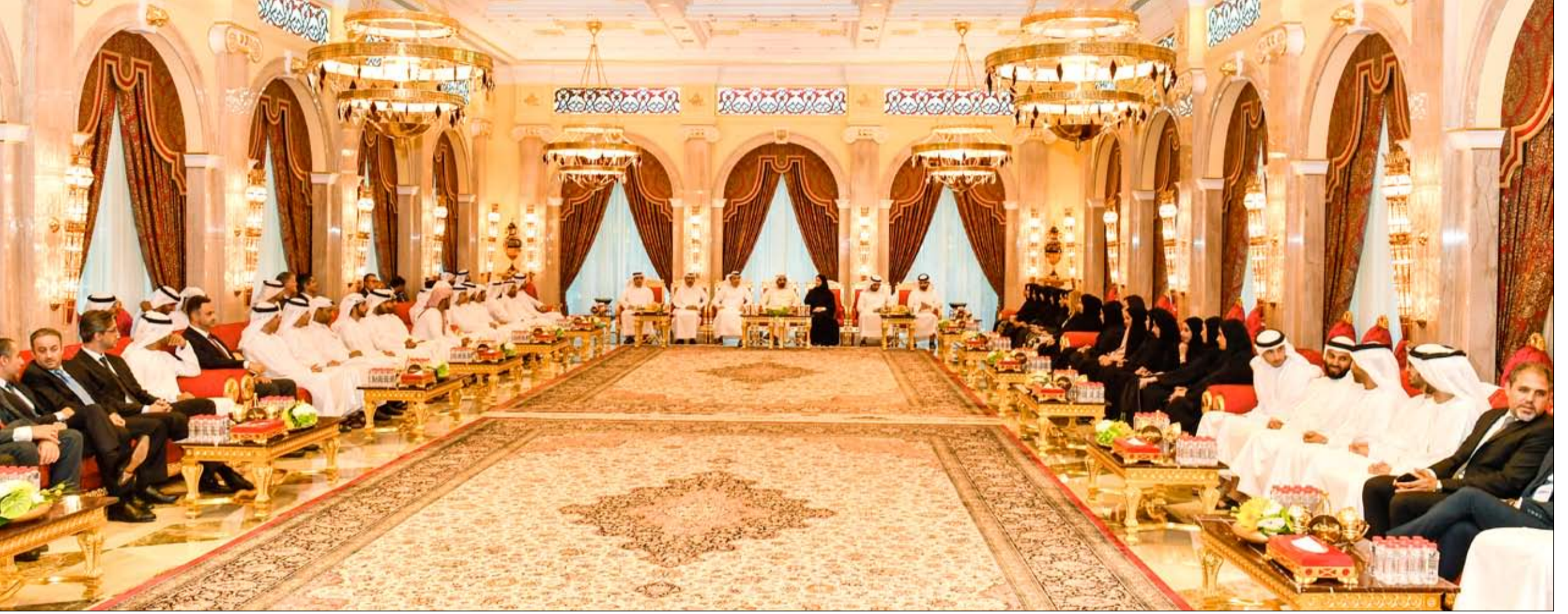
استقبال مجلس علماء الإمارات وأعضاء مجمع محمد بن راشد للعلماء

بعث صاحب السمو الشيخ خليفة بن زايد آل نهيان رئيس الدولة «حفظه الله» برقية تهنئة إلى فخامة إلهام علييف رئيس جمهورية أذربيجان وذلك بمناسبة اليوم الوطني لبلاده. كما بعث صاحب السمو الشيخ محمد بن راشد آل مكتوم نائب رئيس الدولة رئيس مجلس الوزراء حاكم دبي «رعاه الله» وصاحب السمو الشيخ محمد بن زايد آل نهيان ولي عهد أبوظبي نائب القائد الأعلى للقوات المسلحة برفيقتي تهنئة مماثلتين إلى فخامة الرئيس إلهام علييف.