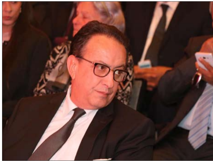
هل خسر السبسي الابن معركة ازاحة الشاهد

إلا أن جميع المراقبين يتفقون على ان الفشل في تطبيق الأمانة، سيجعل من تونس الخاسر الكبير والوحيد... فالأزمة تبدأ الآن.