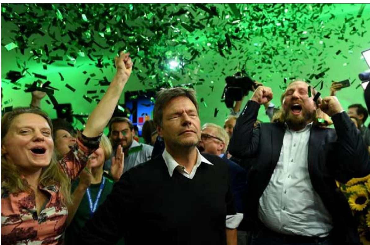
الخضر وضوح الرؤية قاد الى الانتصار