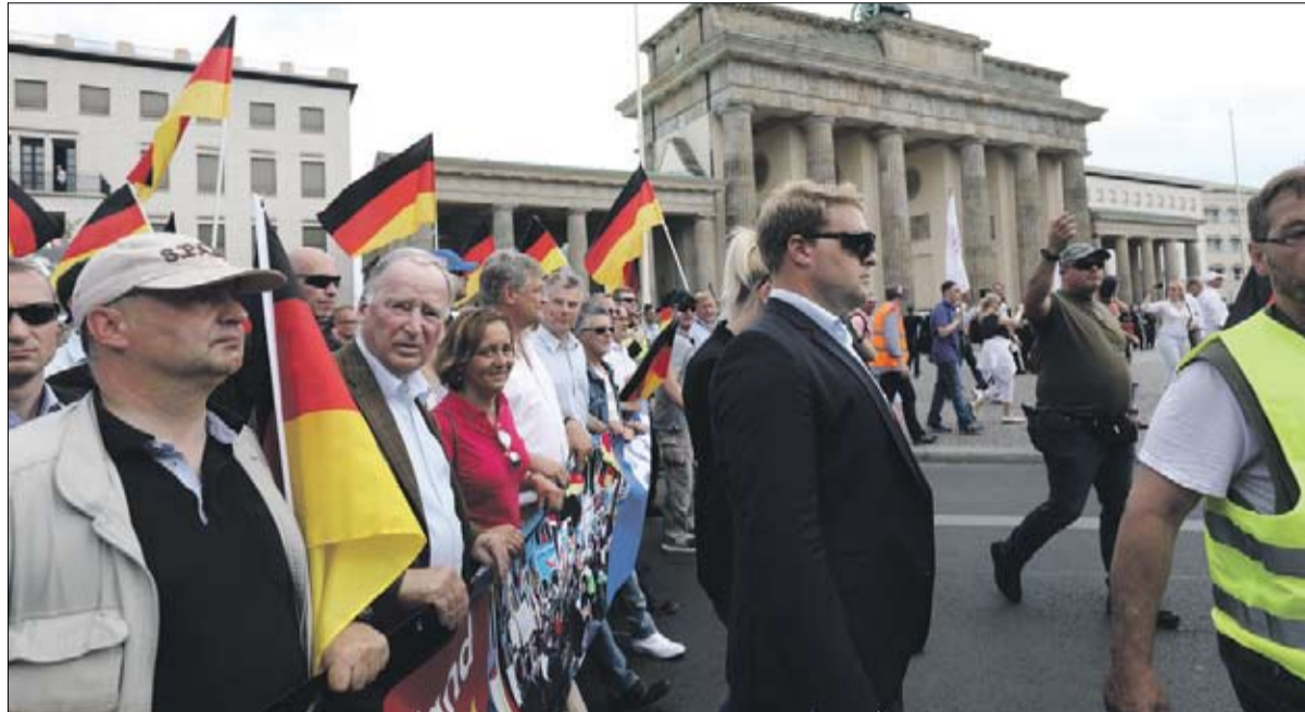
اليمين المتطرف رقم فاعل في المشهد السياسي