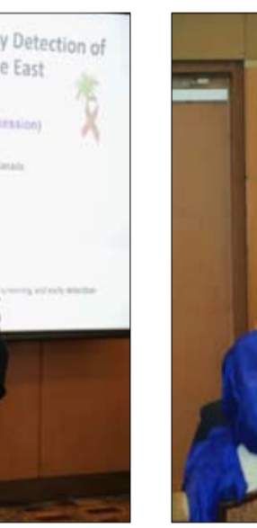
المؤتمر العالمي للسرطان، للتصويت على انتخاب أعضاء المجلس الجديد للمؤتمر.