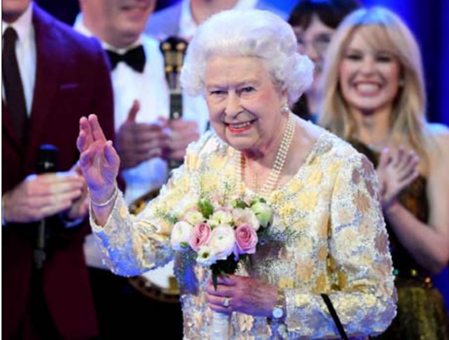
الملكة ايضا وقعت في شباك سحرها

•• الفجر - خيرة الشيباني ها هي حامل، رغم انه لم يمر وقت طويل على زواجها... وهكذا، تواصل ميغان ماركل حرق المراحل داخل العائلة المالكة، كما لو انها تستعجل قطع السنة السوء التي رأت بعين سليبية وصولها إلى ميغان التي قد لا يفي بالفرض، القول بأن الإعلان عن خطوبتها للأمير هاري قد فاجأ الكثيرين: من عامة الناس، مطلقاً، ونسوية، تكبر الأمير سنا، ممثلة أميركية في المسلسلات التلفزيونية، ملونة، من عائلة مستحيلة... لا تسجيب ميغان لأي مرعب محترم من قبل طبقة النخبة البريطانية. وكما في القصص الخيالية، تغلبت الشابة على جميع العقبات، الواحدة تلو الأخرى: أولاً أسرته، الجهة الأكثر حساسية لأنه يصعب مراقبتها والسيطرة عليها بما أنها تعيش في الولايات المتحدة، وتبني اعترافاتها إلى من يدفع أكثر، على غرار أختها سامانثا، الأخت التي تصاعف من تصريحاتها القاتلة في وسائل الإعلام، دون أن تنسى والدها: ادعى ان ابنته المسكينة «متوترة، وغير سعيدة في أسرة عفا عليها الزمن... سرعان ما أدركت ميغان أن الرذ سيضخم الجدل، واستجابة