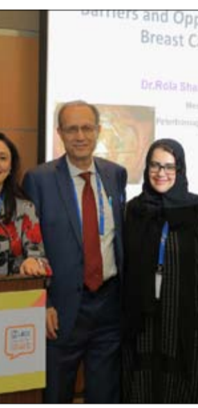
المؤتمر العالمي للسرطان، للتصويت على انتخاب أعضاء المجلس الجديد للمؤتمر.