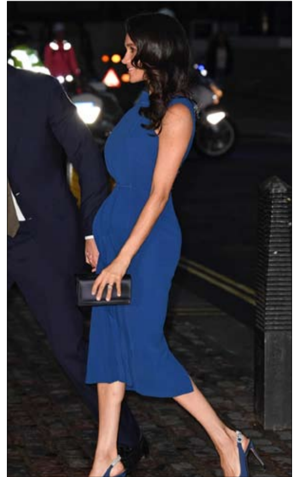
فستان ازرق قبل اسابيع كشف الستور

بعد أقل من شهر، دعته الملكة إلى نشاط رسمي في حين اضطرت كيت إلى الانتظار عشرة أشهر