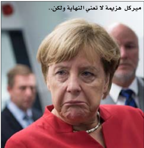
ميركل هزيمة لا تعني النهاية ولكن..