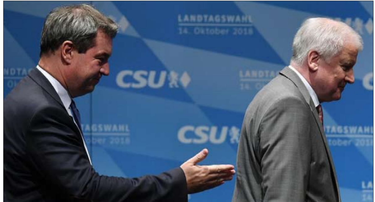
استراتيجية زيهوفر قادت الى الهزيمة