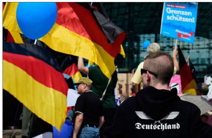
التغيرات تتركب الاحزاب التقليدية الكبيرة