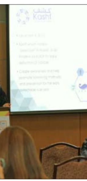
المؤتمر العالمي للسرطان، للتصويت على انتخاب أعضاء المجلس الجديد للمؤتمر.