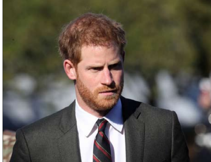
الامير هاري اى في الربيع القادم