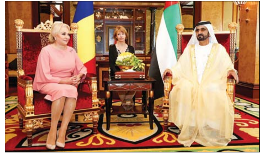
محمد بن راشد خلال استقباله رئيسة الوزراء الرومانية

•• أبوظبي-وام: استقبل صاحب السمو الشيخ محمد بن زايد آل نهيان ولي عهد أبوظبي نائب القائد الأعلى للقوات المسلحة، في مجلس قصر البحر امس صاحب السمو الملكي الأمير أندرو دوق يورك. ورحب سموه في بداية اللقاء بزيارة الأمير أندرو إلى الدولة، معرباً عن اعتزازه بالعلاقات التاريخية والمتميزة التي تربط دولة الإمارات والمملكة المتحدة والحرص المشترك على تعزيزها وتطويرها بما يخدم المصالح المتبادلة للبلدين وشعبيهما الصديقين. وتبادل الجانبان الأحاديث الودية حول عدد من القضايا والموضوعات ذات الاهتمام المشترك وتبادل الآراء بشأنها. (التفاصيل ص3)