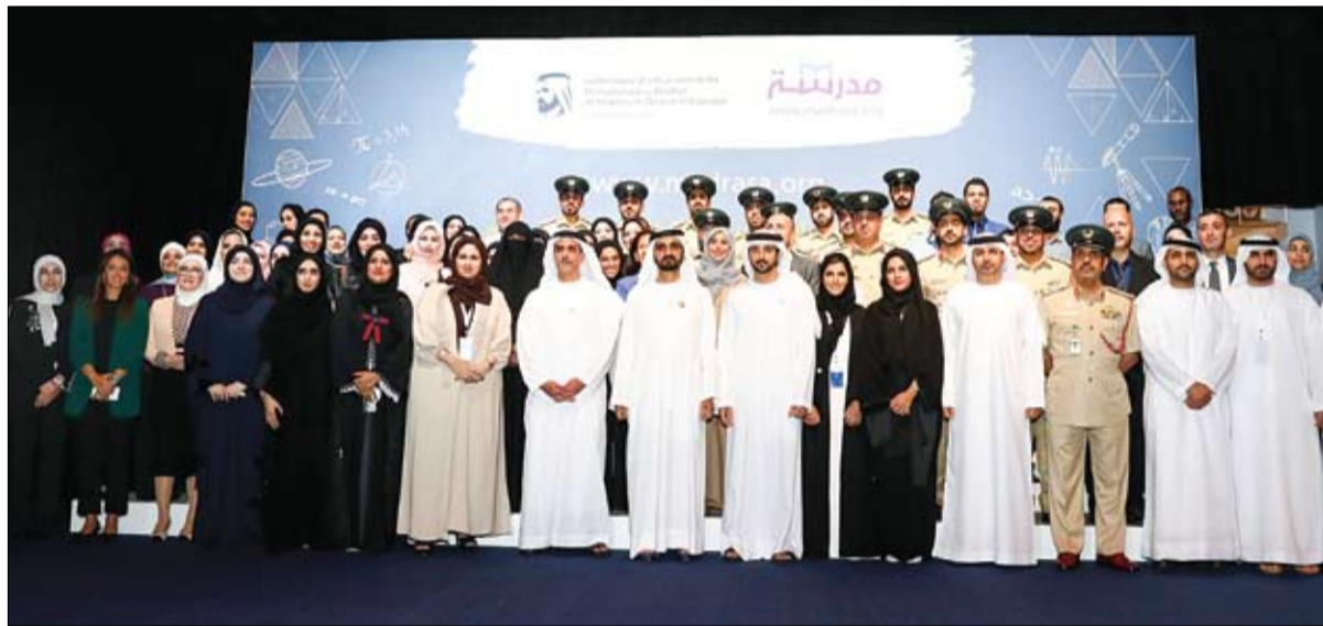
دشن منصة «مدرسة» الأكبر عربياً للتعليم الإلكتروني

كما حضره سعادة خليفة سعيد سليمان مدير عام دائرة التشريعات والضيافة في دبي وسعادة سلطان أحمد بن سليم رئيس موانئ دبي العالمية وممثلة الموانئ والجمارك في دبي وسعادة أحمد عبدالله المطروشي سفير الدولة لدى رومانيا وسعادة الدكتور أدريان ماتشيلارو سفير رومانيا لدى الدولة.