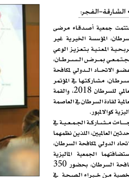
المؤتمر العالمي للسرطان، للتصويت على انتخاب أعضاء المجلس الجديد للمؤتمر.