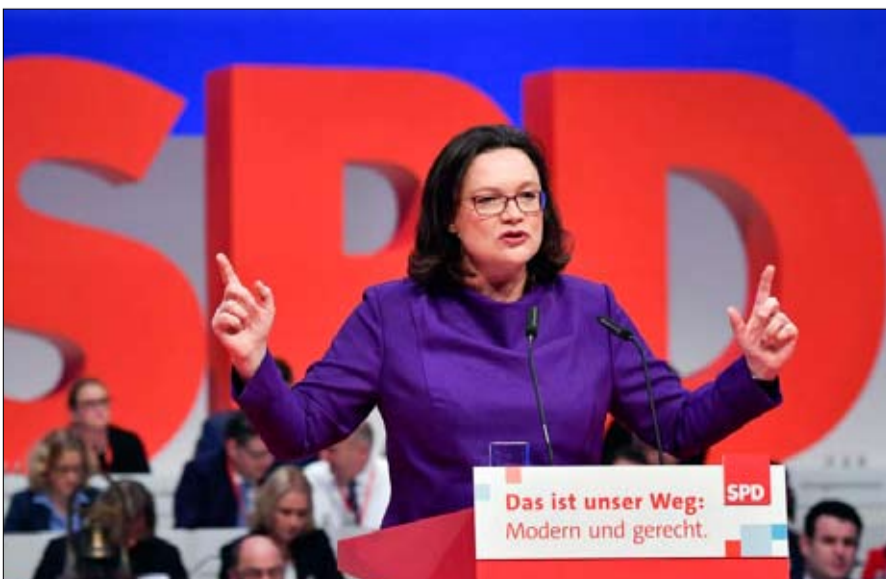
الحزب الاشتراكي الديمقراطي ضعف ولن ينسحب