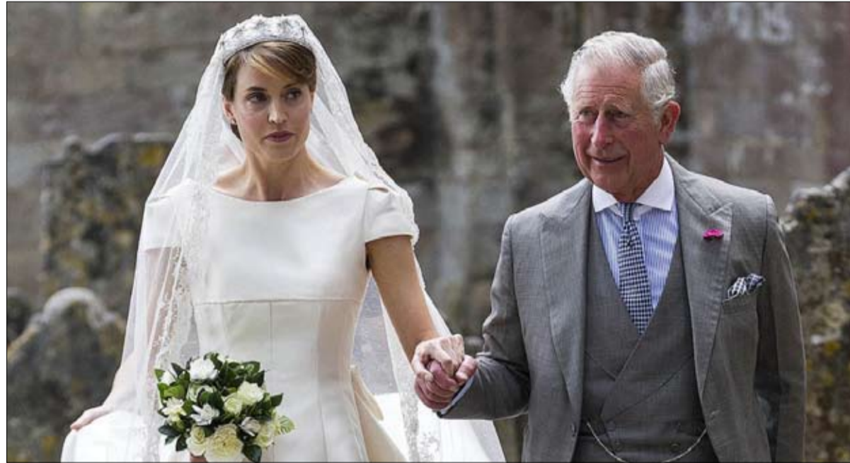
فازت بثقة الامير تشارلز وتقديره