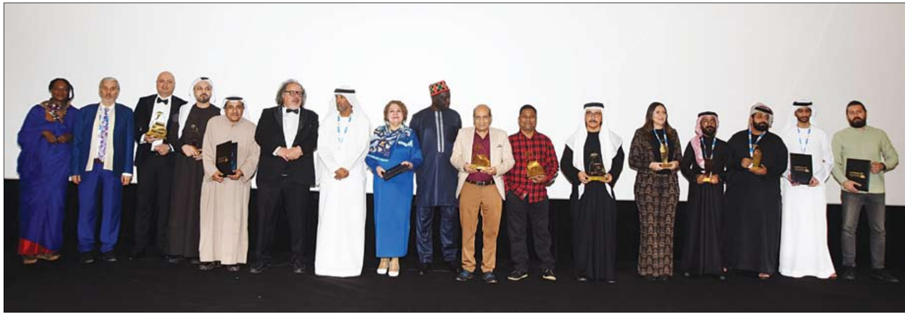
تحت رعاية سلطان بن طحنون