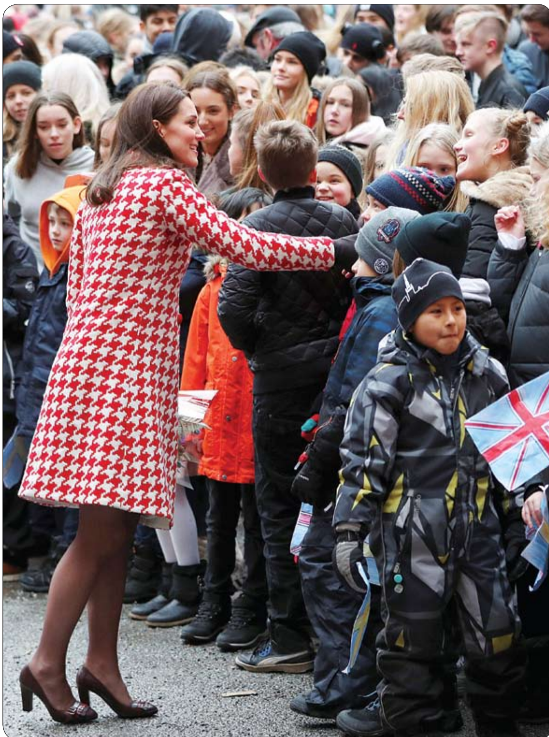
الأميرة كاترين دوقة كامبريدج تحيي الجماهير خلال مغادرتها معهد كارولنسكا، في ستوكهولم، السويد.

وكانت دراسات سابقة قالت إن التاريخ العائلي وتاريخ إصابة الشخص بالأورام وأمراض معينة مثل التهاب القولون التقرحي وعدم الفحص كلها من بين عوامل خطر الإصابة بسرطان القولون. ويرتبط عدم التدخين والحفاظ على وزن طبيعي وتناول الأسبرين بالحد من خطر الإصابة بسرطان القولون.