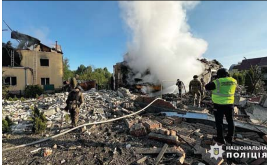
عمال الإطفاء يحاولون إخماد حرائق المباني التي دمرها قصف في خاركيف، شرق أوكرانيا. (ا ب)

من صباح الجمعة، إن وحدات مضادة للطائرات اعترضت طائرة مسيرة جنوبي العاصمة الروسية دون وقوع إصابات أو أضرار بسبب الحطام المتساقط. وكتب سويانين على تطبيق تلغرام للرسائل أنه تم إسقاط الطائرة المسيرة، التي كانت متجهة إلى موسكو، في منطقة بودولسك الواقعة إلى الجنوب مباشرة من العاصمة. كما قال حاكم منطقة بريانسك المتاخمة لأوكرانيا إن الوحدات المضادة للطائرات أسقطت ثلاث طائرات مسيرة أوكرانية الليلة الماضية دون وقوع أضرار أو إصابات.