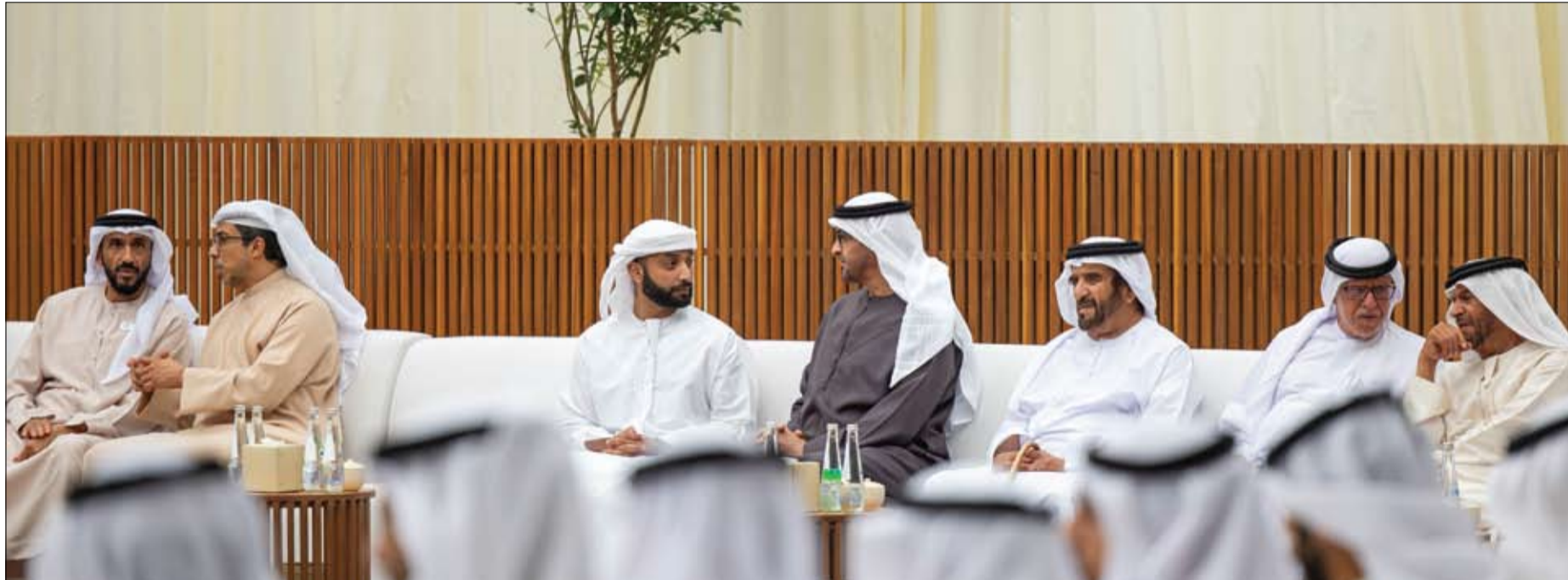
رئيس الدولة خلال تقبله التعازي في وفاة هزاع بن سلطان بن زايد

وشدت الوزارة على ضرورة الوقف الفوري لإطلاق النار، وجتنب استهداف المدنيين والمؤسسات والأعيان المدنية، والمؤسسات الإغاثية، وببذل كافة الجهود لتسهيل تدفق المساعدات الإنسانية الملحة إلى المدنيين في القطاع عبر ممرات آمنة ودون عوائق.