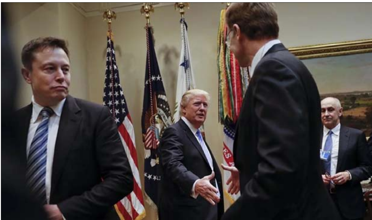
ترامب يدعو أنصاره الى التبرع لحملة