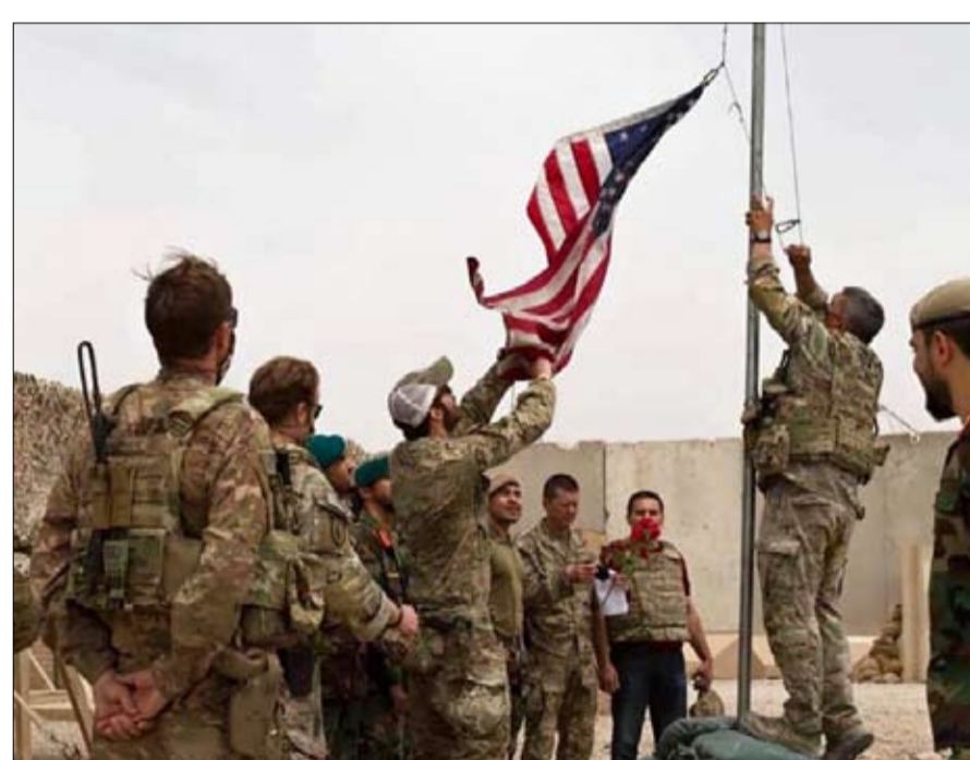
انسحاب بطعم الهزيمة

في جميع أنحاء الوثيقة، تم الاستشهاد ببعض المسؤولين الأمريكيين والأفغان السابقين بالتفصيل. وتبرز ملاحظتان معيّرتان بشكل خاص. هذا ما قاله عبد الجبار نعيمى، الحاكم السابق