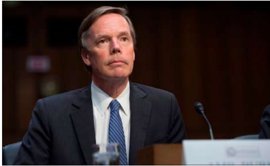
تجاوزت بيل بيرنز الأحداث

أفغانستان أيضا، تأسف الباحثة ستيف شامبل. لقد فهم الجنود الأفغان على الفور، أن الأمريكيين سيتخلون عنهم، وأن عليهم كأولوية إنقاذ جلدهم وعائلاتهم. ان الجزء الأصعب يبدأ الآن للمخابرات الأمريكية المحرومة من عيونها وأذنها في أفغانستان. ويشير مارك بوليمروبولوس، إلى أن «قوتنا المناهضة للإرهاب قد تلقت ضربة قوية، بينما نخاطر برؤية إعادة بناء ملاذ جديد للجهاديين». منذ الساعات الأولى لتوليها السلطة، فتحت طالبان أبواب السجون وحررت آلاف الإرهابيين، بمن فيهم مقاتلو القاعدة. رأينا ما حدث في العراق، عندما استغل تنظيم داعش الانسحاب الأمريكي ليتطور، تحذر ستيف شامبل، طالبان وداعش متحمستان للغاية بعد فشل الولايات المتحدة هذا، ان الخطر الإرهابي عالمي. ومن المفارقات أن الحاجة للجواسيس الأمريكيين ستكون أكثر من أي وقت مضى في الأشهر المقبلة.