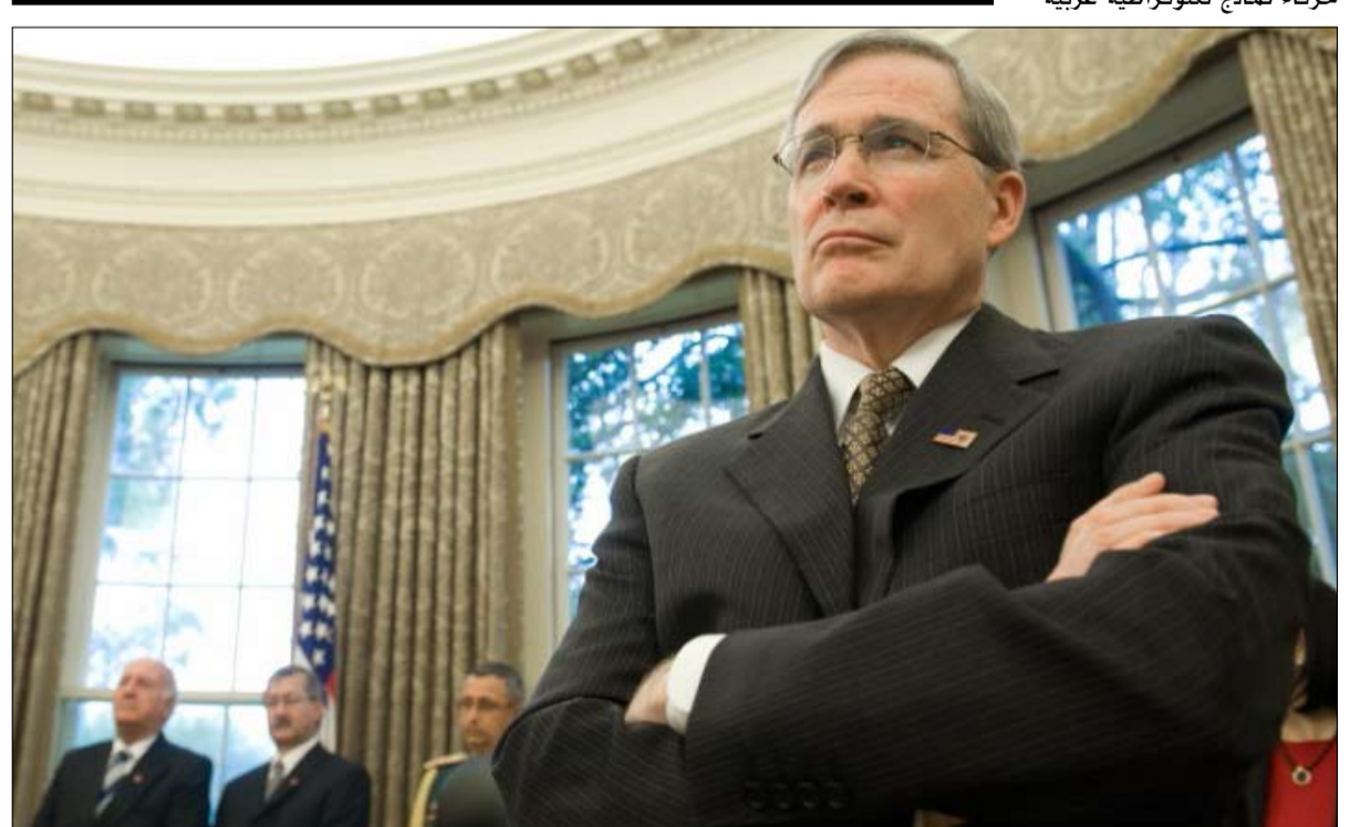
ستيفن هادلي... كنا نفتقر إلى نموذج لتحقيق الاستقرار