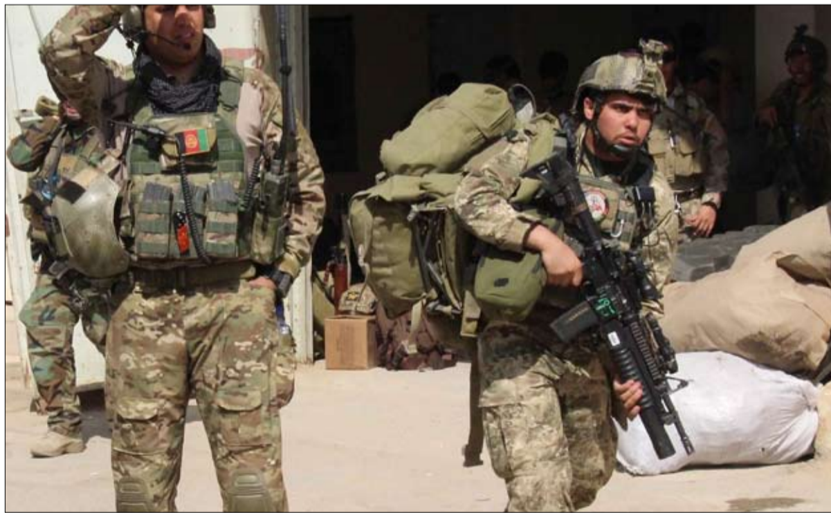
الجيش الافغاني خارج الخدمة