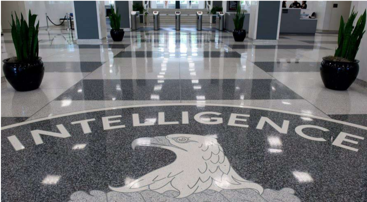
المخابرات الامريكية في التسلل

كان تقدم طالبان مبهرا جدا، الى درجة ان الجيش الأفغاني ألقى أسلحته في غالبية المقاطعات حتى قبل القتال، مما يشير إلى ترتيبات تفاوضية بين الجنود والإسلاميين. ان «اتفاق الانسحاب بين الحكومة الأمريكية وطالبان، في فبراير 2020، وقع على سقوط