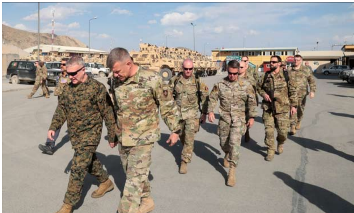
جهد تام بالواقع الأفغاني