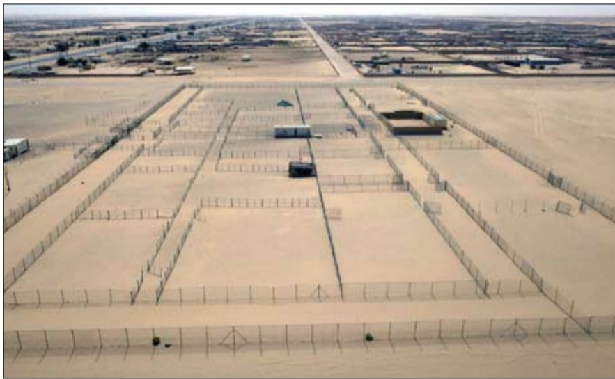
خلال ممارسة التراث الإماراتي الأصيل. وقد هفت لجنة إدارة المهرجانات والبرامج الثقافية والتراثية بأبوظبي خلال الجولات الميدانية على سير العمل في المناطق

ويجسد مهرجان الظفرة جهود الإمارة في تعزيز مكانتها كمصحة إقليمية وعالمية للتراث، وخاصة مع ما تشهده الدورة الحالية من زيادة في عدد الجوائز واستكشاف آفاق جديدة لتسليط الضوء على غنى الموروث الإماراتي والعربي في مزاياها الإبداعي من خلال إدخال فئات جديدة لجوائز الإبل والمسابقات التراثية. ويعكس المهرجان التزام لجنة إدارة المهرجانات والبرامج الثقافية والتراثية بأبوظبي استعداداتها المكثفة لانطلاق مهرجان الظفرة تحت رعاية صاحب السمو الشيخ محمد بن زايد آل نهيان ولي عهد أبوظبي نائب القائد الأعلى للقوات المسلحة، في دورته الـ 15، التي تقام بالتزامن مع الاحتفاء بعام الخمسين، في الفترة من 28 أكتوبر 2021 لغاية 22 يناير 2022 موسم مزاينات أبوظبي متضمنة ثلاث مزاينات للإبل ومهرجاناً تراثياً شاملاً في كل من سويحان ووزين ومدينة زايد والظفرة ضمن إمارة أبوظبي.