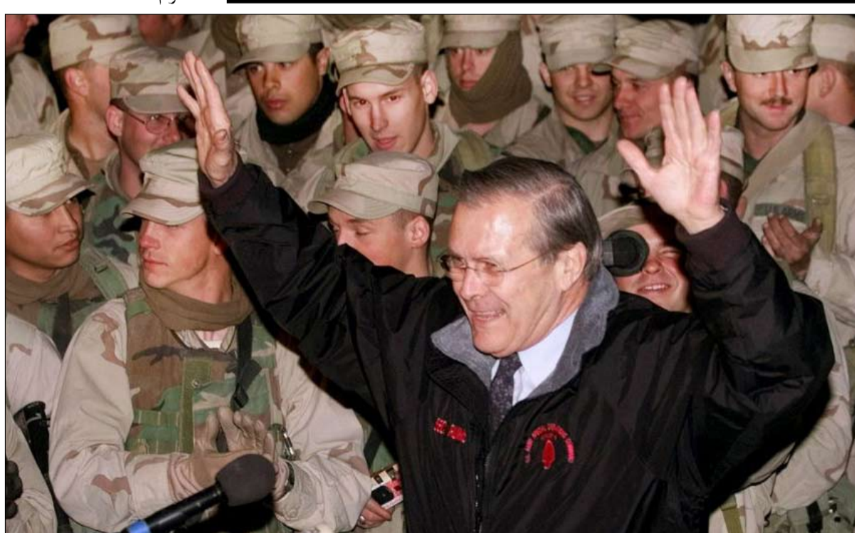
وزير الدفاع الأمريكي دونالد رامسفيلد بعد اجتماعه مع القيادة الأفغانية الجديدة مناقشة مستقبل البلاد في 16 ديسمبر 2001 في مطار باغرام.