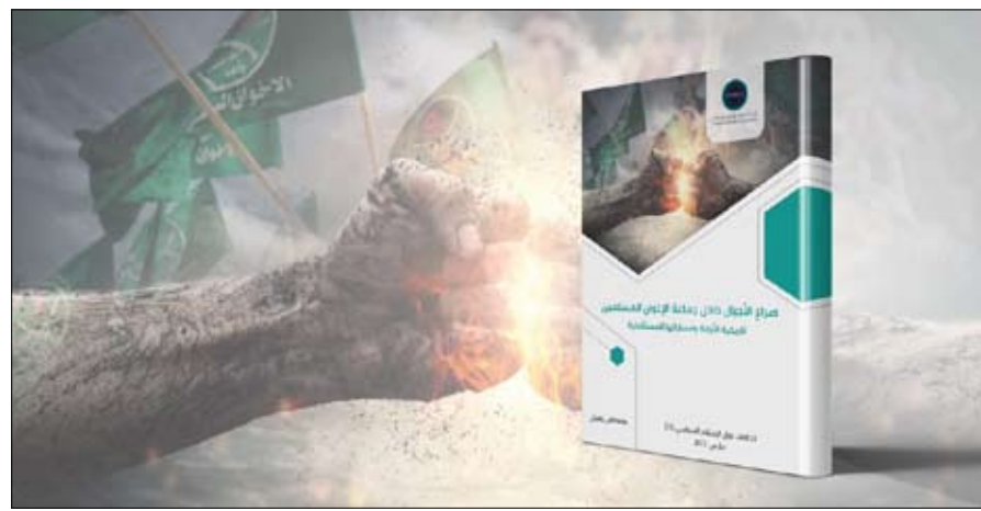
صراع الأجيال داخل جماعة الإخوان المسلمين.. تاريخية الأزمة ومساراتها المستقبلية

وذكرت الدراسة، التي تعتبر العدد الحادي عشر ضمن سلسلة "اتجاهات حول الإسلام السياسي"، والتي أعدها مصطفى زهران الباحث في الحقل الديني والتيارات الإسلامية المعاصرة، أن من أهم التحولات التي نجمت