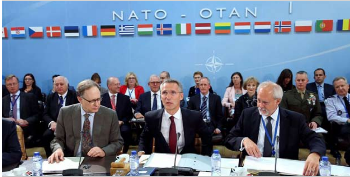
خلاف حول الموقف من الحلف الأطلسي أيضا