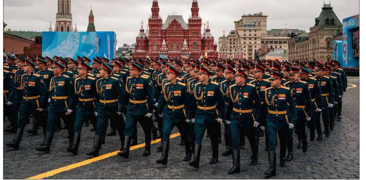
المطلوب انتصار جديد في يوم النصر