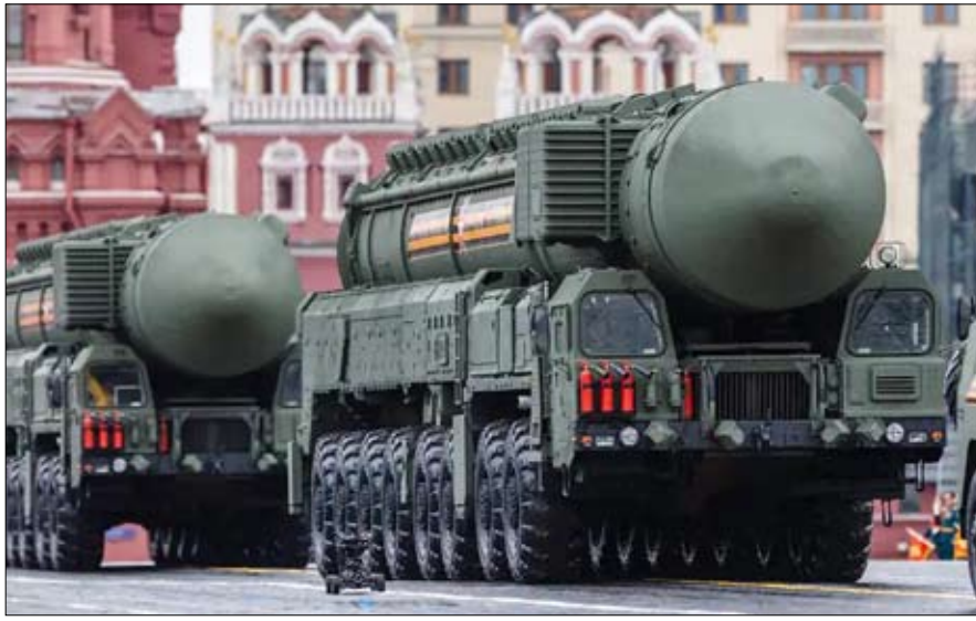
مناسبة لاستعراض الأسلحة الجديدة

•• الفجر - غابرييل أوميت - ترجمة خيرة الشيباني