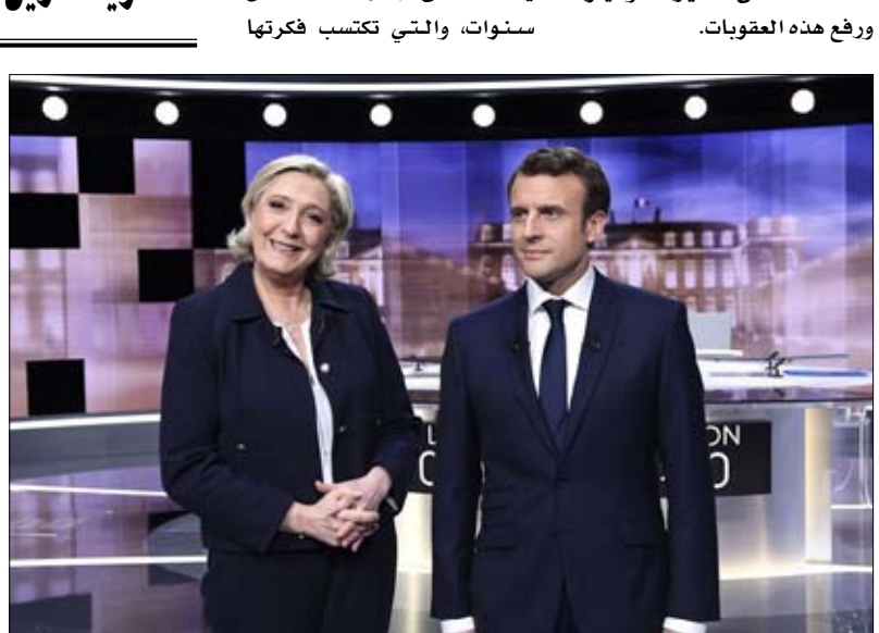
في مناظرة الجولة الثانية 2017، وضع ماكرون مارين لوبان في مأزق بخصوص الخروج من اليورو