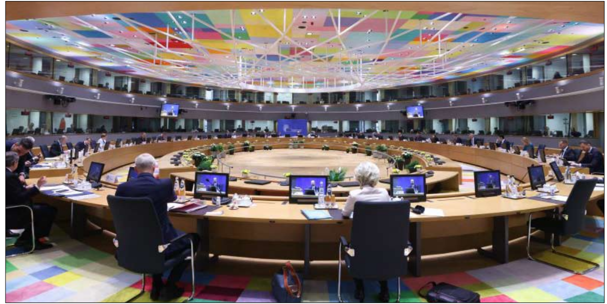
الانتماء الأوروبي أكبر نقطة تباين