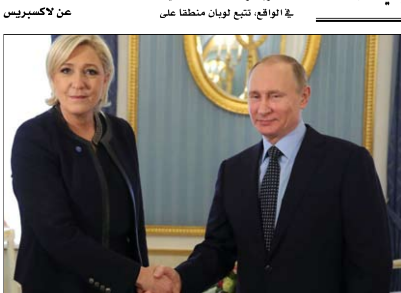
مارين لوبان والهوى الروسي