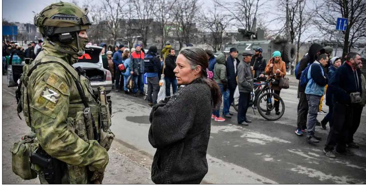
سيدة تتخاطب جندياً روسيا في ماريوبول