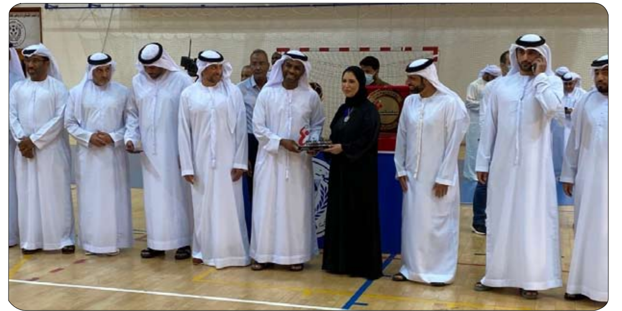
للمرة الرابعة على التوالي والتاسعة في تاريخه