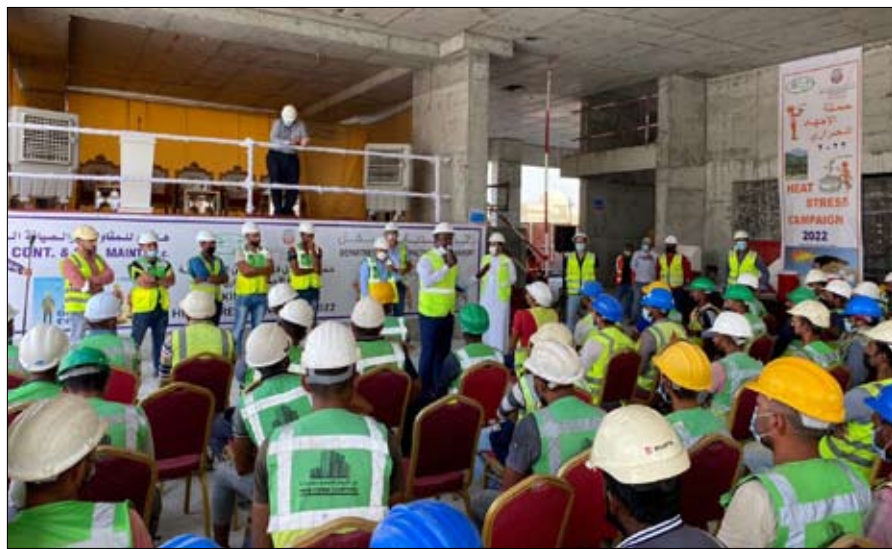
من توفير الضوابط المطلوبة للعمل في بيئة آمنة وسليمة.

ابوظبي - الفجر: كشفت دراسة حديثة أن دول مجلس التعاون لدول الخليج العربية ودول منطقتي القرن والشرق الأفريقي شركاء جغرافيون طبيعيون؛ ما يسهل عملية الاستثمارات السياسية والاقتصادية الخليجية فيها، وخاصة مع التقارب الثقافي بين شبه الجزيرة العربية من جانب ومنطقتي القرن والشرق الأفريقي من جانب آخر. كما أن دول منطقة الساحل الأفريقي، حيث تتركز الجماعات الإسلامية المتشددة، تستطيع من خلال تعاونها مع الدول الخليجية أن تسهم في القضاء على التهديدات الإرهابية، بما تمتلكه من خبرة في هذا المجال، حيث يعتبر الإرباب من أهد موقوفات عمليات الاستثمار في تلك المنطقة.