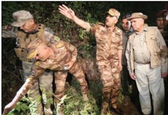
وزير الخارجية العراقي يتفقد موقع الهجوم في محافظة دهوك.

كما قال غرونديبرغ في بيان، إن تسديد الهدنة وتوسيع نطاقها سيزيد من الفوائد التي تعود على الشعب اليمني، كما ستوفر منصة لبناء مزيد من الثقة بين الأطراف، والبدء في نقاشات جادة حول الأولويات الاقتصادية مثل الإيرادات والرواتب، والأولويات الأمنية ووقف إطلاق النار. وأكد أن الهدف في نهاية المطاف هو المضي قدماً نحو تسوية سياسية تنهي النزاع بشكل شامل. كذلك، أشار المبعوث الأممي إلى أنه فضل استمرار التزام الأطراف، بغض النظر عن حجمه، بما تمثله لقرابة الأربعة أشهر، مما تمثل واحدة من أطول فترات الهدوء النسبي بعد أكثر من سبع سنوات من النزاع المستمر.