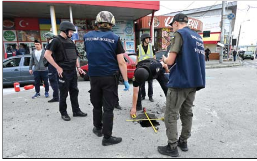
خبراء أوكرانيون يعاينون حفرة في الأرض بعد قصف روسي على مدينة خاركيف

إلى مقتل شخصين وإصابة 19 آخرين بجروح الخسيس، سينيغوبوف على وسائل التواصل الاجتماعي عقب القصف موضحة أن 19 شخصاً أصيبوا بجروح من بينهم طفل. مع الأسف أربعة أشخاص في حال خطيرة. وتوفي شخصان. أدى القصف على المدينة الأربعاء بحياة ثلاثة أشخاص على الأقل من بينهم طفل يبلغ 13 عاماً.