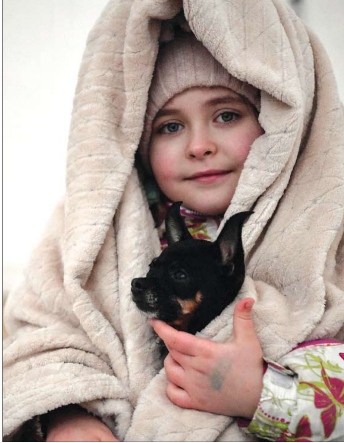
طفلة أوكرانية مع كلبها تنتظر بعد نقلها في مخيم للمنظمة الدولية للهجرة بعد عبور الحدود الأوكرانية البولندية في ميديكا، جنوب شرق بولندا.