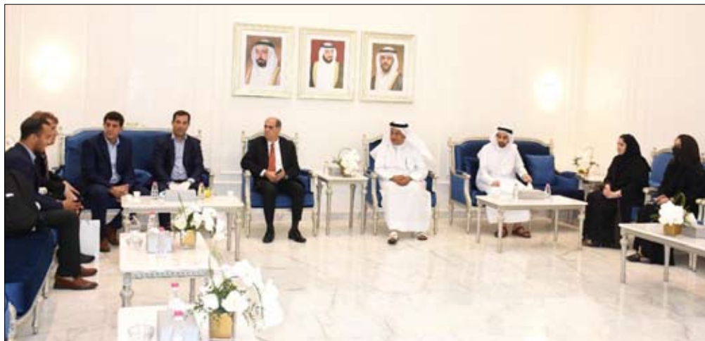
خلال استقبال وفد رفيع المستوى من الأرجنتين

تجارة دبي تستعرض تحديات مجتمع الأعمال في الإمارة