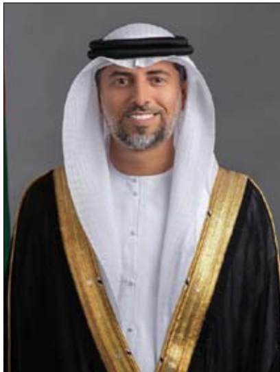
•• دبي - وام:

«أوبك +» في ظل دعم الإمارات المتواصل لجهود التحالف النفطي والتزامها بهذا الاتفاق. وكانت منظمة الدول المصدرة للنفط «أوبك»، صمتت في وقت سابق الجهود الكبيرة التي تبذلها دولة الإمارات طيلة الفترة الماضية للمحافظة على التوافق بين أعضاء المنظمة تجاه كافة الأمور المتعلقة بالسوق النفطي العالمي والدعم الذي قدمته للمحافظة على توازنه واستقراره وعلى نحو يأخذ بعين الاعتبار مصالح المنتجين والمستهلكين.