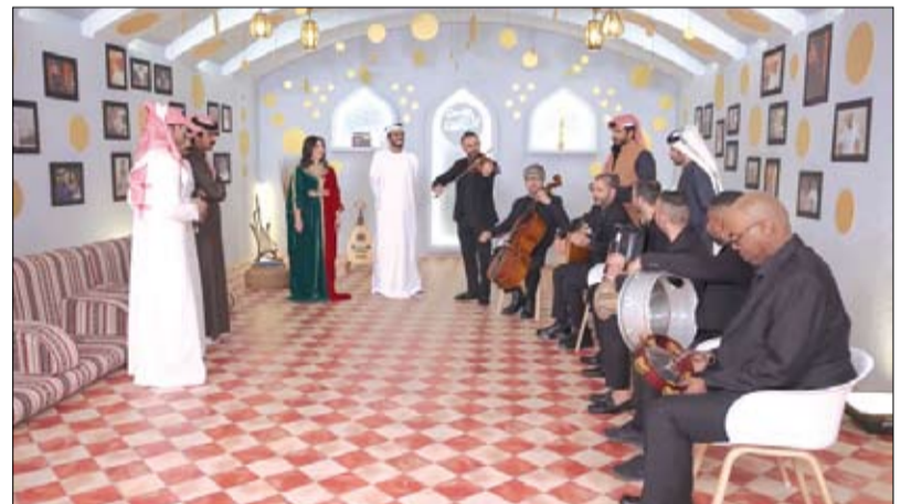
تتظمه هيئة أبوظبي للتراث