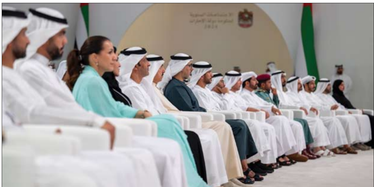
حضر جلسة بعنوان (طموحنا.. تنافس بهم دول العالم)