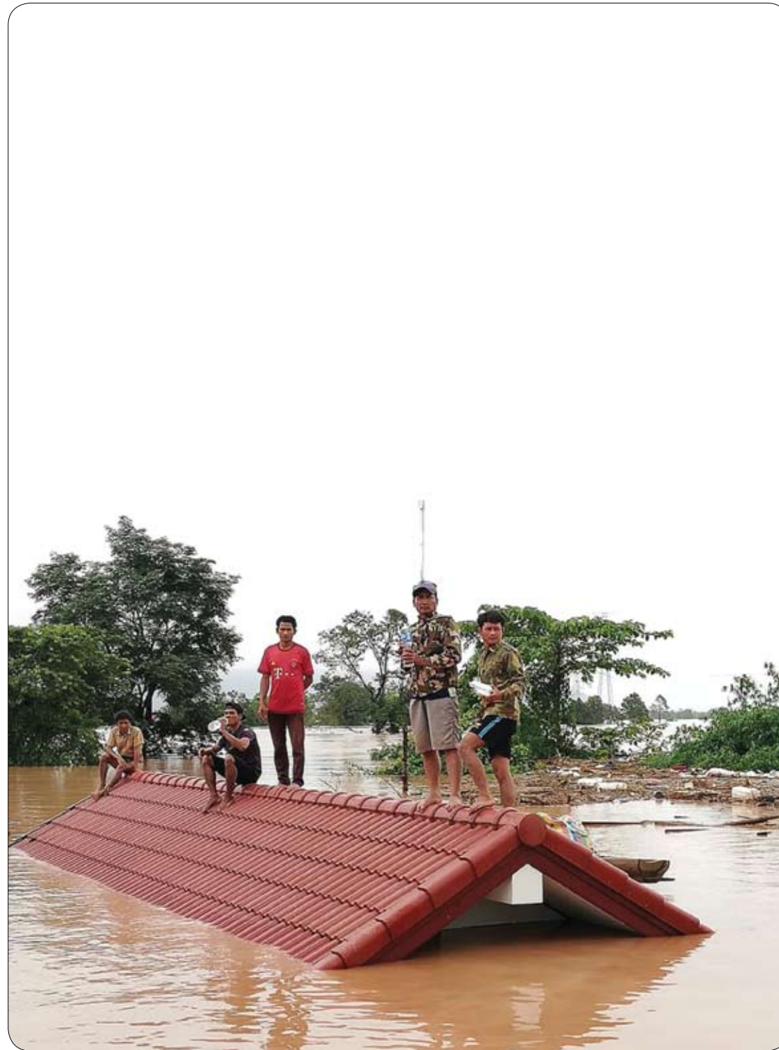
سكان يحتمون فوق سطح أحد المنازل عقب انهيار سد قيد الإنشاء لتوليد الطاقة الكهربائية في لاوس جنوب تايلاند.

وتوصي منظمة الصحة العالمية حالياً، لمواجهة المشكلة، بحقن جميع السيدات اللواتي يلدن بطريقة طبيعية بدواء (أوكسيتوسين). لكن يوصى بحفظ دواء "أوكسيتوسين" بين درجة حرارة 2 إلى 8 درجات من لحظة التصنيع حتى لحظة الاستخدام، وهو ما دفع خبراء منظمة الصحة العالمية إلى الإشارة إلى أن ذلك غير قابل للتطبيق في دول يصعب فيها الاستفادة من المبردات وفي ظل إمكانيات كبرى لا يمكن الاعتماد عليها.