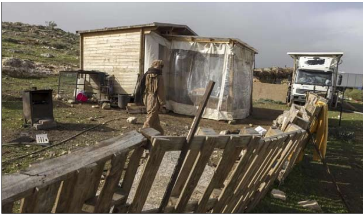
سموطريتش دورا في الإشراف على الشؤون المدنية في الأراضي الفلسطينية.

ويتمتع بن غفير بسلطة على شرطة حرس الحدود العاملة في الضفة الغربية بينما يتولى