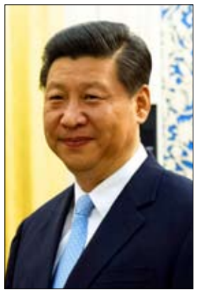
•• وادور-أ ف ب

تطوير القوة العسكرية للصين بعد تكثيف تدريباتها المشتركة في منطقة بحر تايوان في الفترة الماضية. السياسة المتبعة من الإدارة الأمريكية في الوقت الراهن محاولة لاستفزاز الصين، وربما تكرار السيناريو الروسي الأوكراني، بهدف إرباك بكين، وأيضا "تجسيم النفوذ الروسي والصيني"، الولايات المتحدة لا ترغب في تطبيق نظام متعدد الأقطاب، الذي تسعى الصين وروسيا إلى إقراره، بعد سنوات من هيمنة الولايات المتحدة على العالم في نظام أحادي القطب؛ لذلك ستحاول بشكل كبير استفزاز الصين وجرها لمنطقة الصراع.