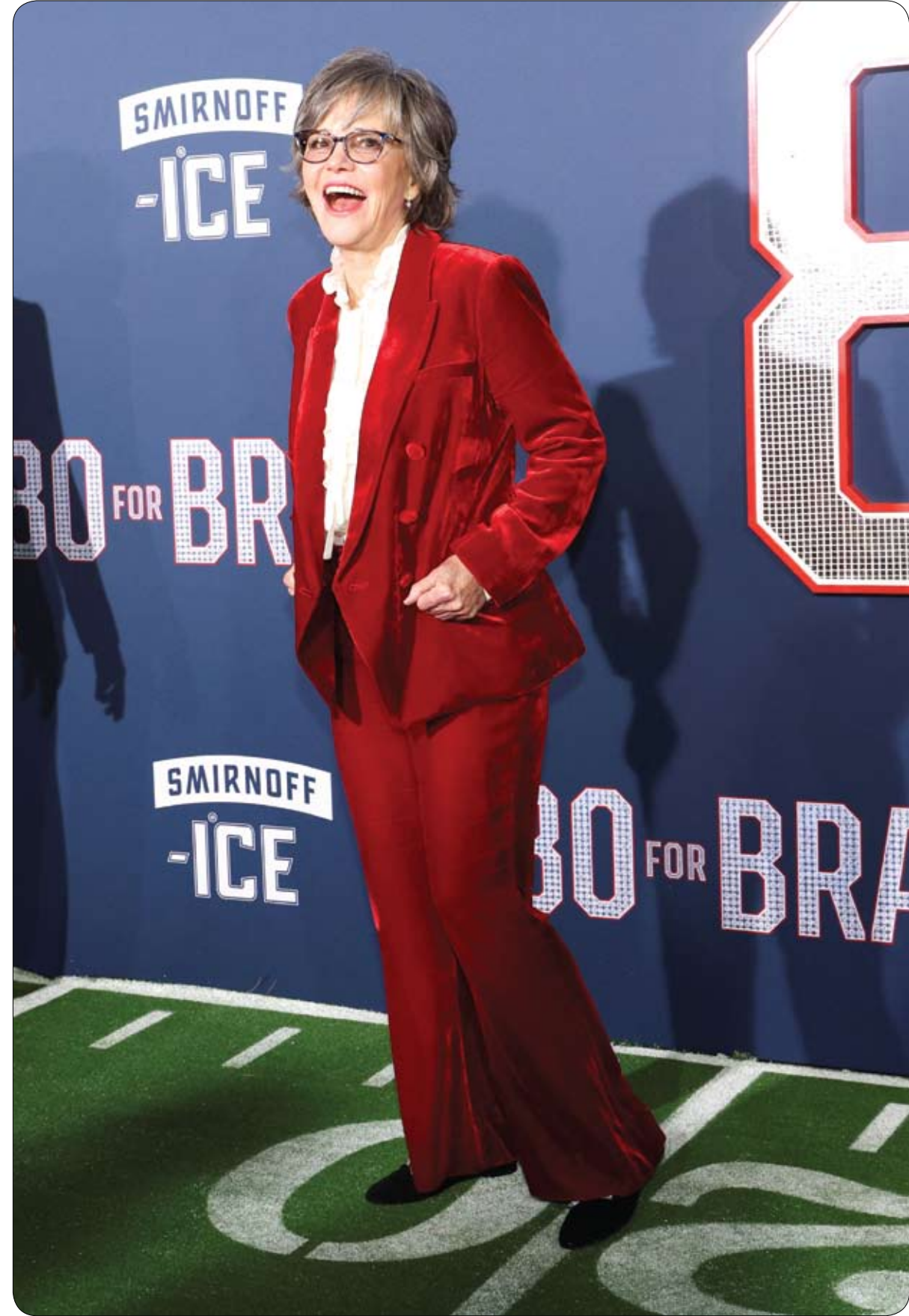
المثلة سالي فيلد لدى حضورها العرض الأول لفيلم «80 لبرادي» في لوس أنجلوس.

في تقليد غريب، طالب قسم شرطة موسكو في ولاية أيداهو الأمريكية، سكان المدينة بإضحاك ضباطه إلى الحد الذي قد يتسبب بإصابتهم بنوبة قلبية من شدة الضحك. ويقضي التقليد أن يقوم أهالي المدينة بإرسال بطاقات ملونة على شكل قلوب ويكتبون فيها ملاحظاتهم على أداء رجال الشرطة بشكل ساخر، وكذلك رسومات مضحكة. وأوضح قسم الشرطة أنه سيتلقى تلك البطاقات طوال شهر فبراير، مشيراً إلى أنه تلقى بالفعل عدداً منها وعمل على تعليقها بكافة أرجاء قسم الشرطة، وأن الضباط يقرؤون تلك البطاقات ويضحكون كثيراً، لدرجة جعلت القسم يصف هذا التقليد بأنه "نوبة قلبية" من كثرة الضحك. كذلك طالب قسم الشرطة بتسخير هذا التقليد لتقديم الدعم لرجال الشرطة المتفانين في عملهم، وأن يتم هذا الأمر في فبراير من كل عام، وأنه ستتم عرض البطاقات في احتفال مع سكان المدينة نهاية الشهر.