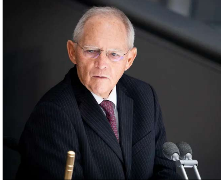
الألمان كانوا اشد منتقديه أوروبا