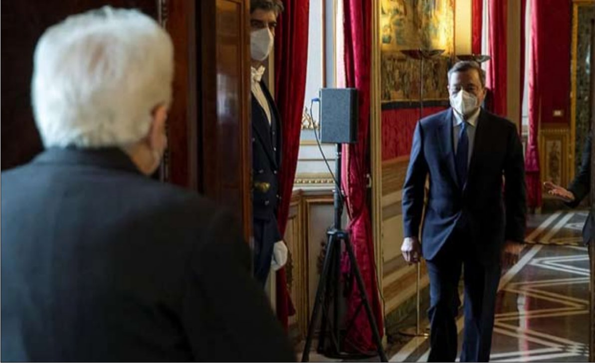
ماريو دراغي يستقبله الرئيس الإيطالي سيرجيو ماتاريلا