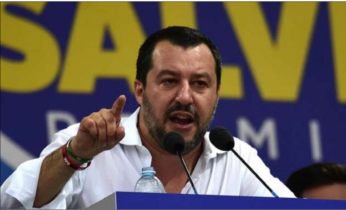
سالفيني خصم داخلي عنيد

يبقى موقفه من الوباء لغزاً. يعتقد الإيطاليون، في الوقت الراهن، أن هذا ليس جوهر اهتماماته ومخاوفه، وأنه بصفته المدير السابق للتمويل الأوروبي، سيكون أكثر حساسية لتعالج الاقتصاد. ومن يدري ما إذا لن يقنع نفسه بأن مكافحة كوفيد يمكن أن تعيد تشغيل محرك الإبداع؟ عن لو نوهال وايسرفاتور