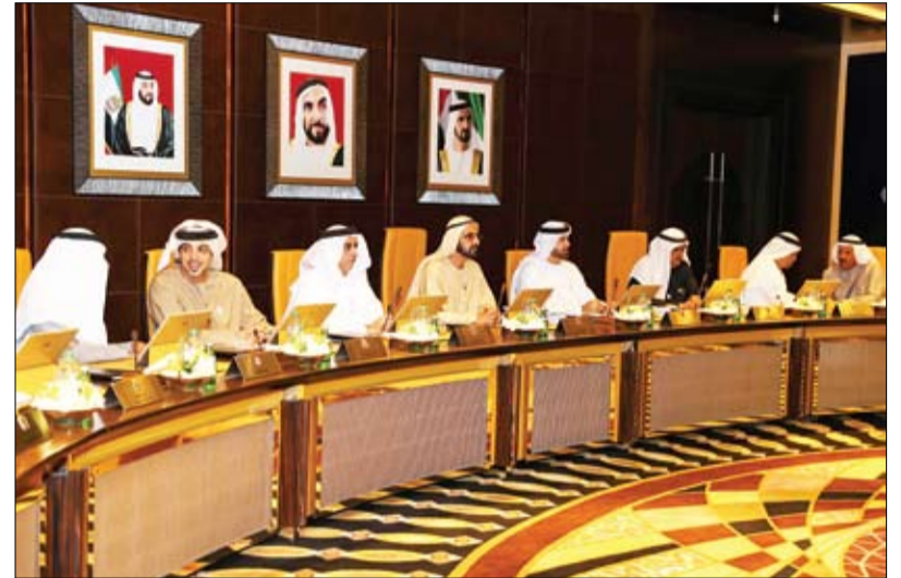
برئاسة محمد بن راشد