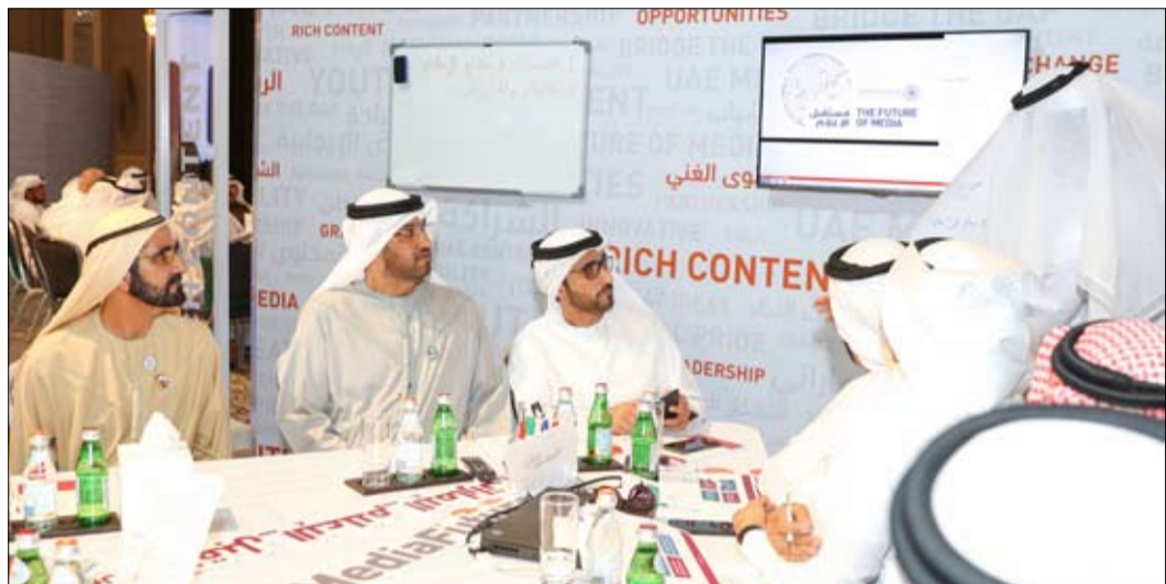
حضر جانباً من فعاليات «خولة مستقبل الإعلام» التي نظمتها المجلس الوطني للإعلام