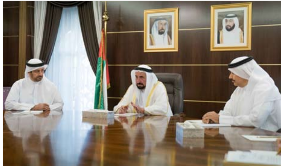
إلى جانب دراسة وتقديم الحلول ودعم هذه الفئات في مختلف المجالات الاجتماعية الخاصة بهم.

على الرؤية التي يعمل عليها الصندوق وإلى البرامج التي يطمح إلى تنفيذها لخدمة جميع المؤمن عليهم وفق الخطط المزمع تنفيذها لضمان تحقيق أهدافه كافة بما يساهم في دعم الأسر في الإمارة. وقدم رئيس مجلس إدارة صندوق الشارقة للضمان الاجتماعي الشكر والتقدير على استقبال سموه لأعضاء المجلس .. مشيراً إلى أن الصندوق يعمل وفقاً لتوجيهات سموه في تقديم الخدمات وتفعيل جميع مبادرات ومكرمت سموه التي تقدم الإعانة لختلف الفئات الاجتماعية وعلى