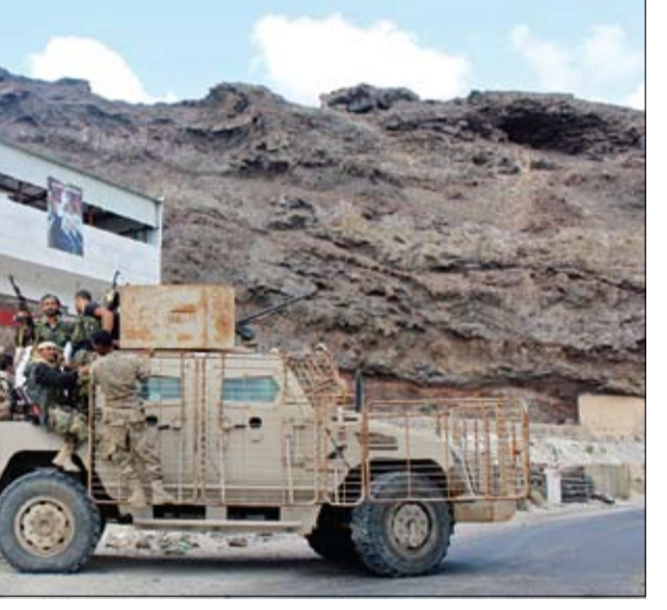
الجيش اليمني يواصل انتصاراته وتقدمه مدعوما بقوات التحالف في جميع أنحاء تعز