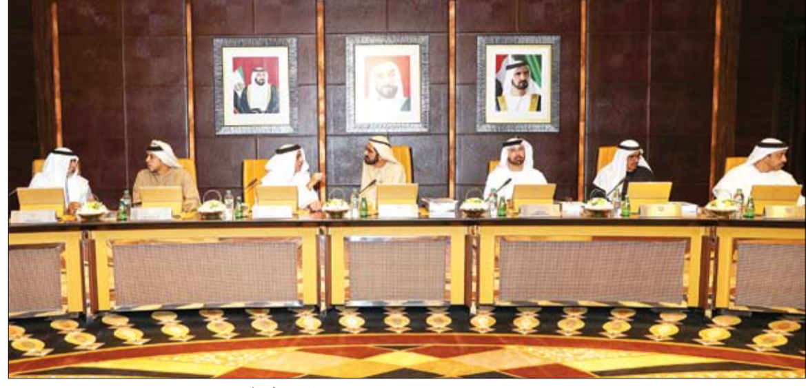
محمد بن راشد خلال ترؤسه جلسة مجلس الوزراء

محمد بن راشد ترأس جلسة مجلس الوزراء وحضر خلوة مستقبل الإعلام