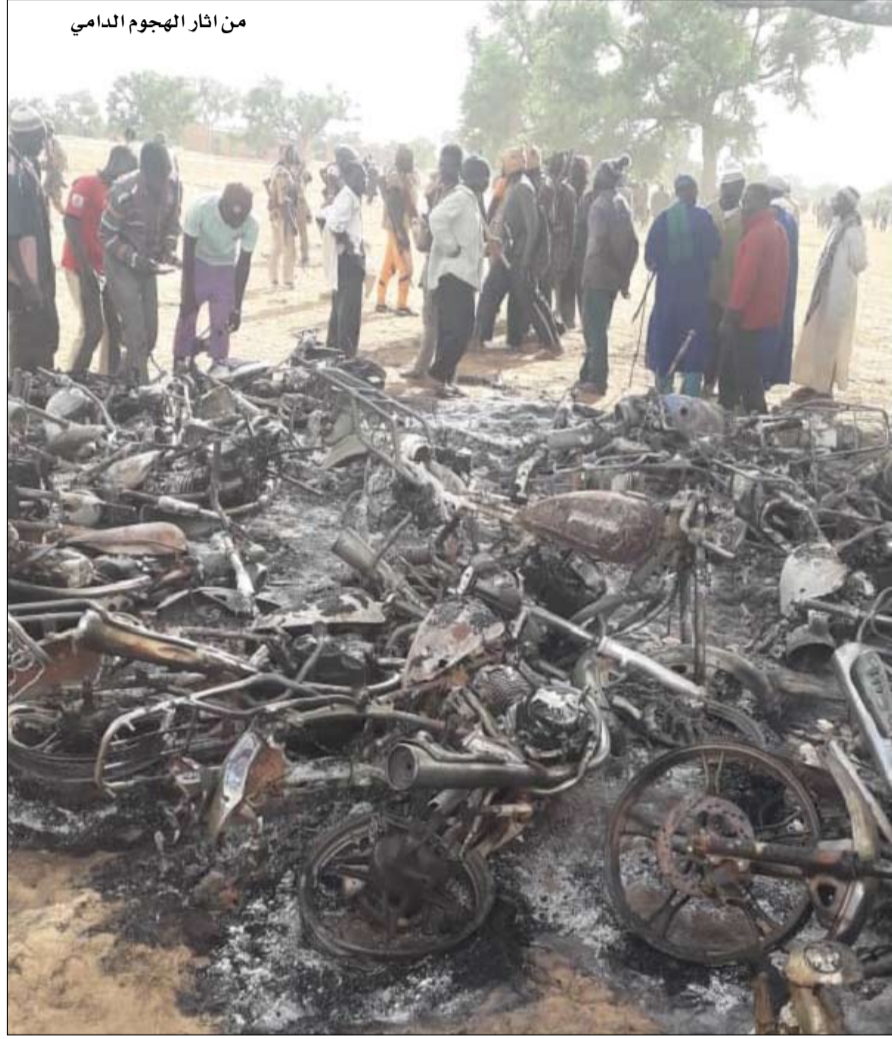
من آثار الهجوم الدامي

رغم الضربات التي يتعرض لها الإرهابيون إلا أنهم موجودون دائماً ونشطون