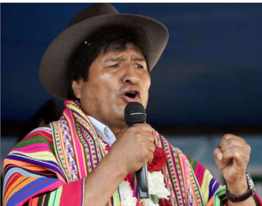
موراليس ونظرية الانقلاب

نهاية حكاية خرافية... بدل "العودة إلى بيته"، أصدر موراليس حكماً، استناداً إلى المادة 23 من الاتفاقية الأمريكية لحقوق الإنسان، التي تنص على