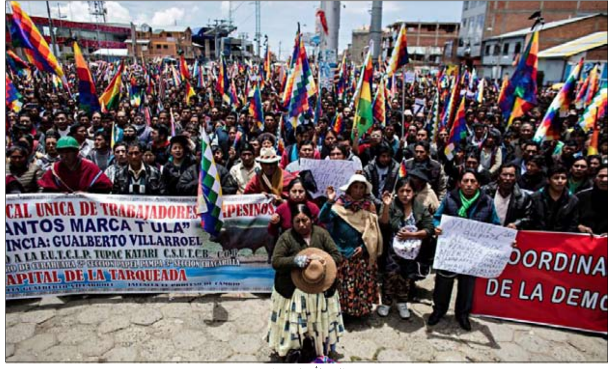
مظاهرة لانصار موراليس