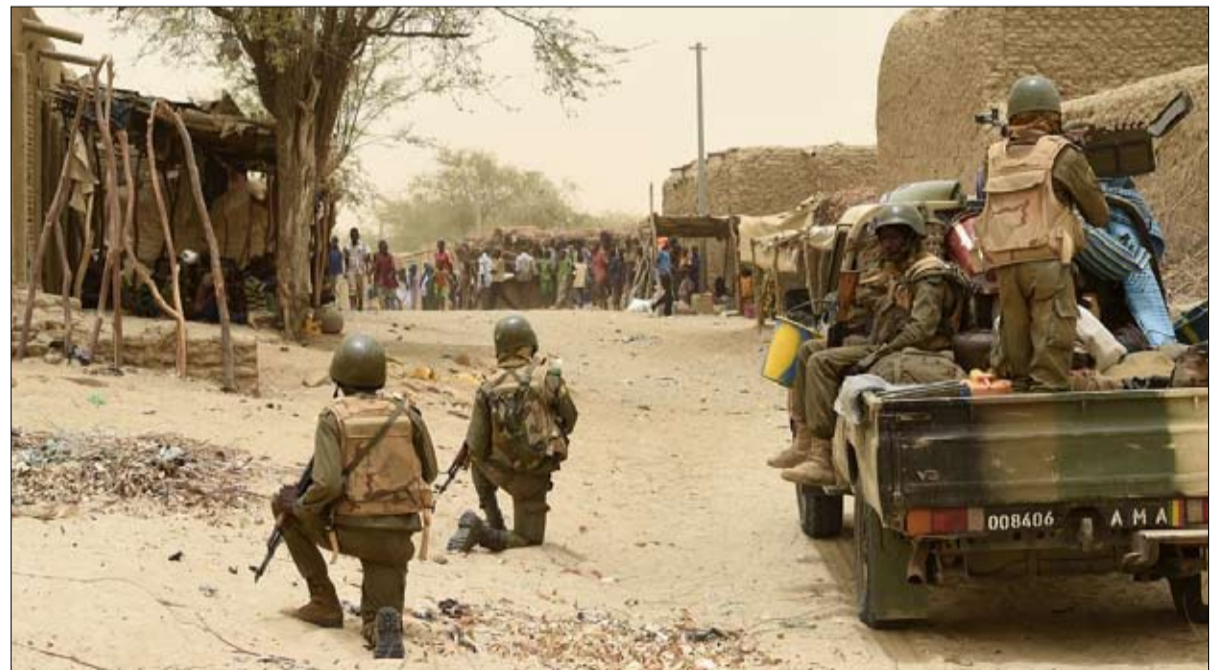
الجيش المالي ضحايا بالجملة