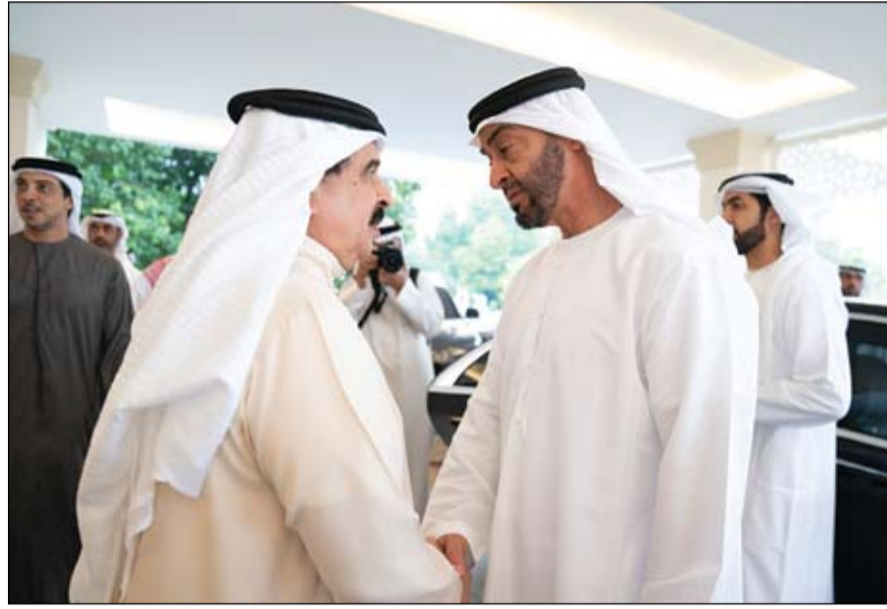
محمد بن زايد يتلقى التعازي من ملك البحرين (وام)

أعلن اللواء الركن طيار عبد الله السيد الهاشمي وكيل وزارة الدفاع المساعد للخدمات المساندة الرئيس التنفيذي للجنة العسكرية المنظمة للمعرض المتحدت الرسمي بإسم معرض دبي الدولي للطيران 2019 عن إبرام 15 صفقة في اليوم الثالث للمعرض بقيمة تتوق 3 مليارات درهم. وأوضح في مؤتمر صحفي أمس أنه بذلك يكون مجموع قيمة العقود التي أبرمت خلال الأيام الثلاثة الأولى لمعرض دبي الدولي للطيران 17 مليارات و811 مليوناً و852 ألفاً و862 درهماً، حيث بلغت قيمة العقود في اليوم الأول ما يقارب 8 مليارات درهم، أما اليوم الثاني فكانت قيمتها ما يقارب 7 مليارات درهم، واليوم الثالث 3 مليارات درهم، وذلك من أصل 10