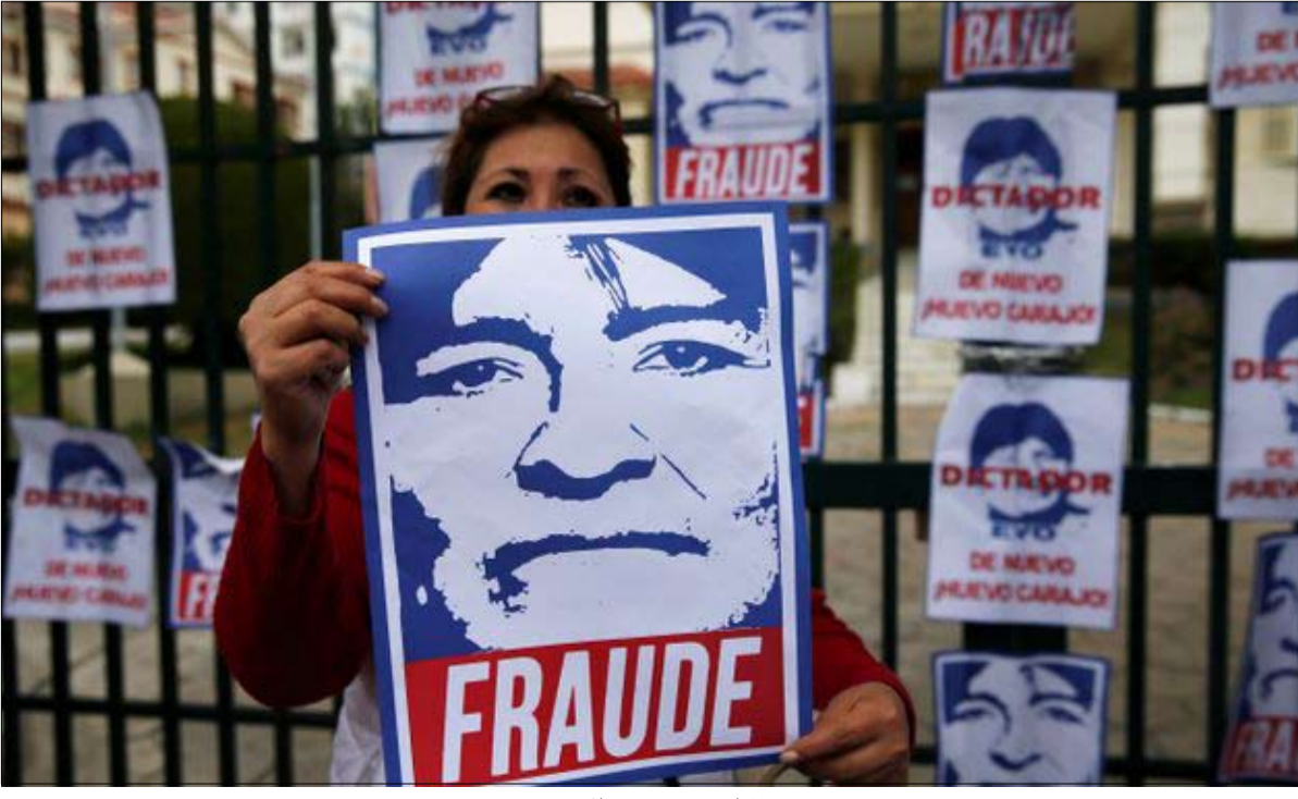
المعارضون ينددون بالتزوير