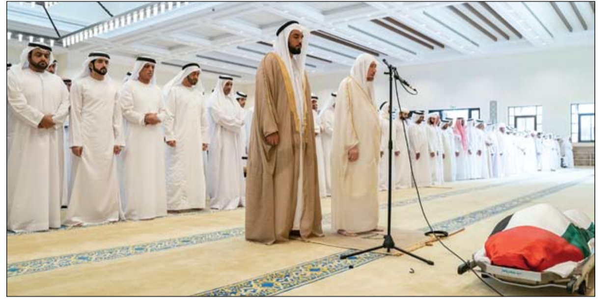
محمد بن زايد والحكام وأولياء العهود يؤدون صلاة الجنازة على جثمان سلطان بن زايد