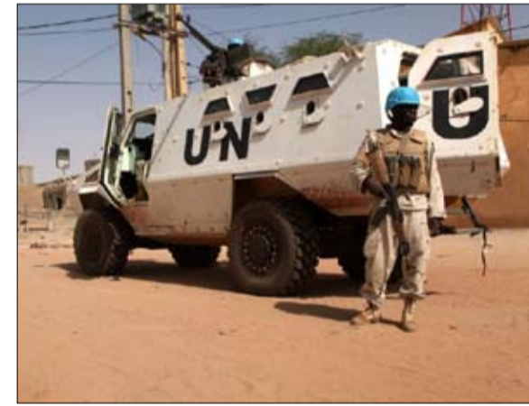
تدخل هجومي اممي اكثر

في هذه القارة، بينما هي من حيث الحجم، واحدة من أهم العمليات. بالتأكيد، للقوات الفرنسية اليد العليا في هذه المعركة غير المتكافئة، لكن كان عليها مراجعة الهدف الأولي إلى الأسفل. لم نعد نتحدث عن الانتصار في الحرب ضد الإرهابيين، ولكننا نحد من قدراتهم الهجومية، لإعادتها إلى مستوى القوات الأفريقية، التي ستأخذ مشعل المعركة التي تبدو طويلة للغاية.