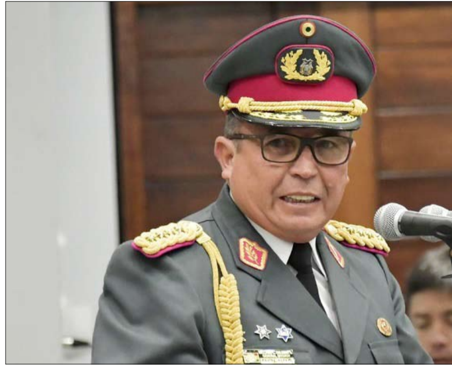
كاليماز دفع الرئيس إلى الاستقالة