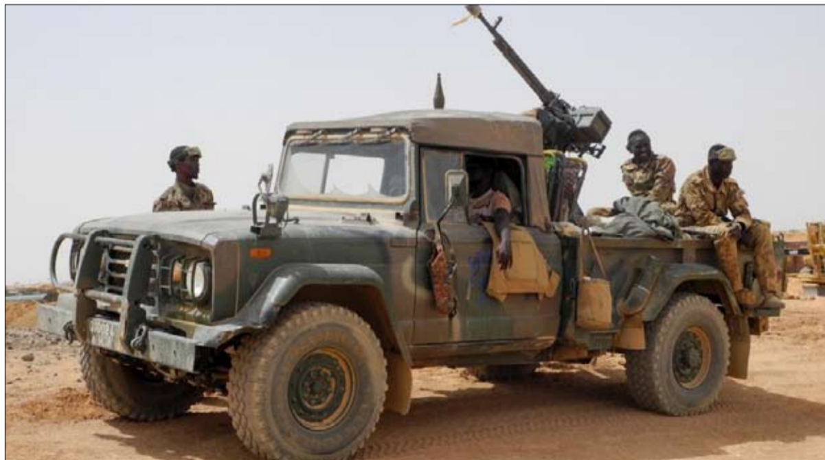
معركة طويلة الامد