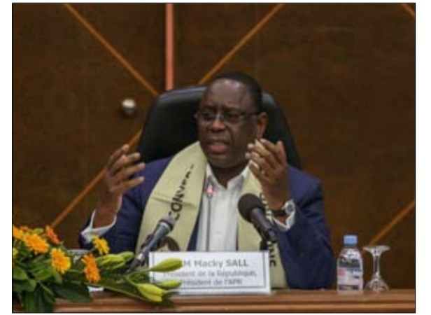
الرئيس السنغالي يريد تدخلا اقوى

وورشة تعدين صغيرة الحجم، "ما يمثل ضربة قوية لحركة المجموعات الإرهابية المسلحة في هذه المنطقة". وإلى جانب صور المواد المضبوطة، أشار البيان الطويل لمجموعة الخمس، إلى أن "مكافحة الإرهاب عمل طويل الأجل، وأن دعم السكان يظل أساسياً وحاسماً". رسالة موجهة للأشخاص الذين يتظاهرون الآن في العواصم الأفريقية مع كل مجزرة للجنود.