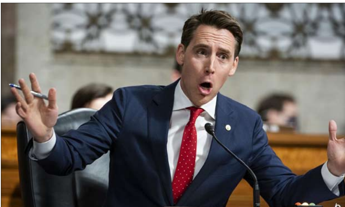
جوش هاولي يُعتبر أحد الشخصيات الترامبية المستقبلية