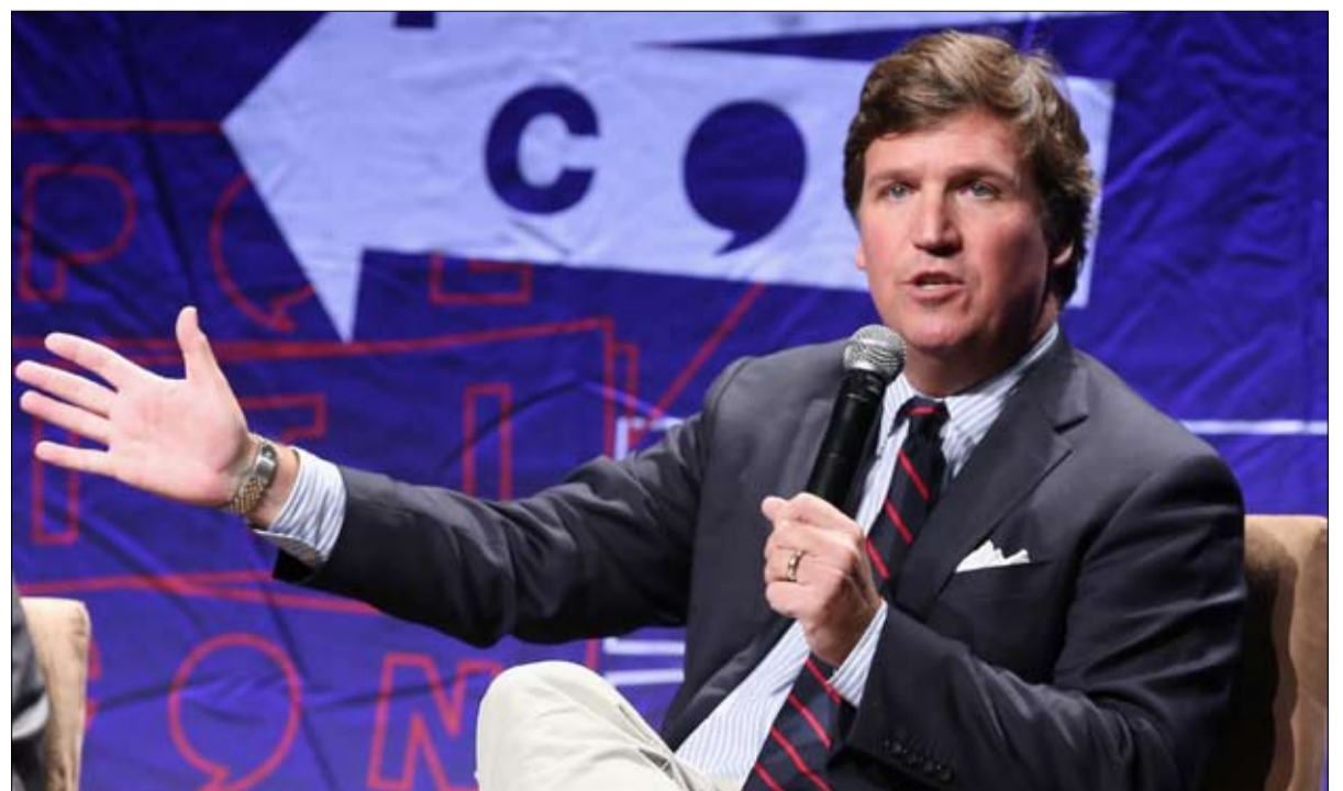
النجم تاكر كارلسون قد يعصف بالجميع