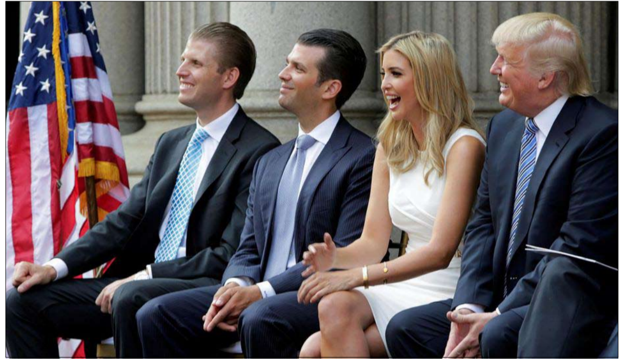
من الأسرة سيجرو؟

لاري هوجان (64 عاماً)، الذي لا يخفي طموحاته، دونالد ترامب بعد الانتخابات، ثم بعد أحداث الكابيتول، قائلاً إنه "لا شك" على حد قوله، في أن الملياردير هو المسؤول. ويجسد هذا الوسطي تياراً مختلفاً تماماً عن تيار دونالد ترامب داخل الحزب.