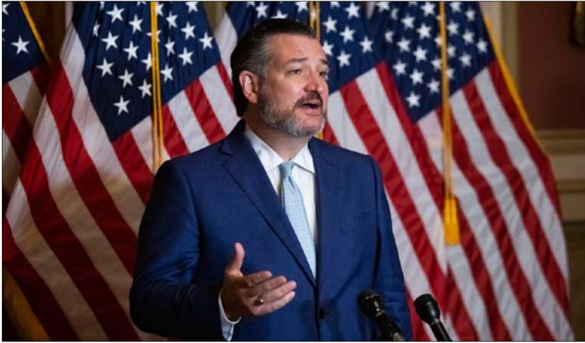
تيد كروز عن الترامبيين المتشددين

هل سيتمكن دونالد ترامب من الترشح للرئاسة عام 2024؟ منذ غزو مبنى الكابيتول في 6 يناير ومحاكمته الثانية في مجلس النواب، تخيم حالة من الشك بشأن المستقبل السياسي للرئيس المنتهية