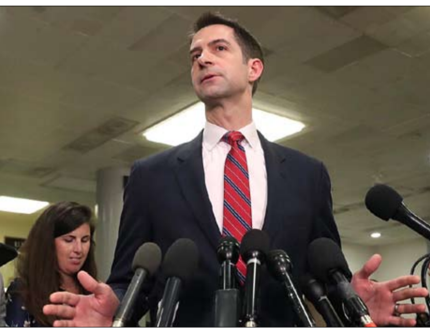
توم كوتون مسك العصا من الوسط