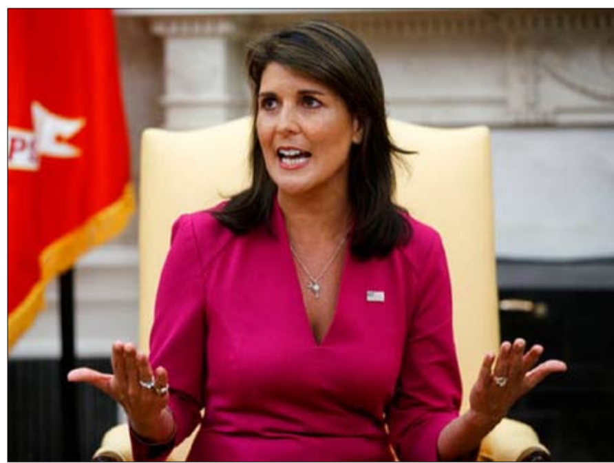
نيكي هالي على قائمة الذين تخلوا عن ترامب