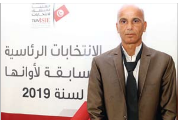
المرشح المحطود من عمله

واتهمت قيادة الجيش، وفق بيان نشره الإعلام السوري الرسمي، المجموعات الإرهابية المسلحة، المدعومة من تركيا بأنها «رفضت الالتزام بوقف إطلاق النار وقامت بشن العديد من الهجمات على المدنيين في المناطق الآمنة المحيطة». وقالت قيادة الجيش السوري في بيانها: الجيش والقوات المسلحة ستستأنف عملياتها القتالية ضد التنظيمات الإرهابية، بمختلف مسمياتها، وسترد على اعتداءاتها.