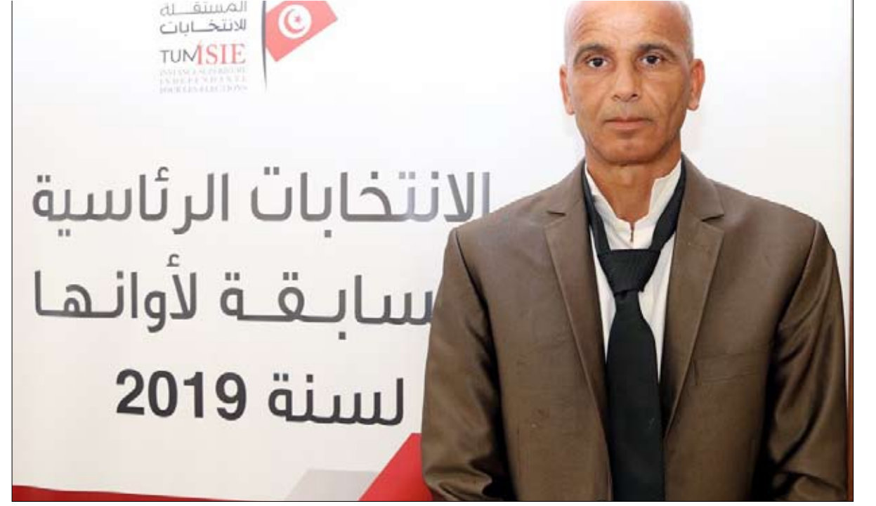
المرشح الطرود من عمله