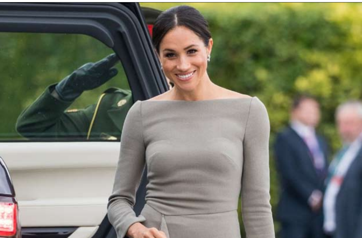
ميغان ضحية النظرة العنصرية

كيت.. "كاملة الأوصاف"، قرار الزوجين مغادرة قصر كنسينغتون في وسط لندن، للانتقال إلى قصر (يحمل اسماً مضللاً كوخ فروغور) في وندسور، سبق أن تعرض لانتقادات شديدة، خاصة أنه كان لا بد من تجديد البنى بنفقات كبيرة، سدّد جزءاً كبيراً منها دافعو الضرائب البريطانيون. لذا اختار الزوجان المنفى على