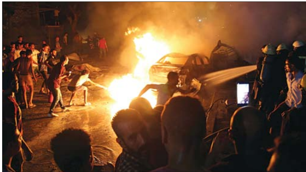
شبان يحاولون إطفاء النيران الناجمة عن التفجير أمام المعهد القومي للسرطان وسط القاهرة

استكمال عمليات الفحص والتحري وجمع المعلومات وتحديد العناصر الإرهابية المتورطة في هذا التحرك واتخاذ الإجراءات القانونية حيالهم. وبحسب البيان، فقد توصلت التحريات الميدانية وجمع المعلومات إلى وقوف حركة حسم التابعة لتنظيم الإخوان الإرهابي وراء الإعداد والتجهيز لتلك السيارة استعداداً لتنفيذ إحدى العمليات الإرهابية. وجمع المعلومات وتحديد العناصر الإرهابية المتورطة في هذا التحرك واتخاذ الإجراءات القانونية حيالهم. وبحسب البيان، فقد توصلت التحريات الميدانية وجمع المعلومات إلى وقوف حركة حسم التابعة لتنظيم الإخوان الإرهابي وراء الإعداد والتجهيز لتلك السيارة استعداداً لتنفيذ إحدى العمليات الإرهابية. وأضاف أن السيارة مبلغ بسرقتها من محافظة المنوفية منذ بضعة أشهر. وأشارت إلى أن الفحص المبني لأثار الحادث كشف عن تصادم إحدى السيارات الملاكي بـ3 سيارات، وذلك أثناء محاولة سيرها عكس الاتجاه. وأوضحت الوزارة في بيانها أنه جار