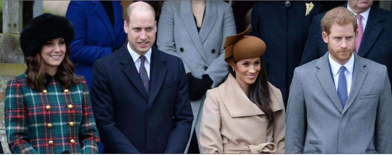
هل تغار ميغان من سلفتها؟

لا شيء يميزها، لا تتواضع بالقدر الكافي، لا هالة ملكية لها، ليست إنجليزية بما يكفي، أو، دعنا نقولها بصراحة، ليست بيضاء بما فيه الكفاية؟