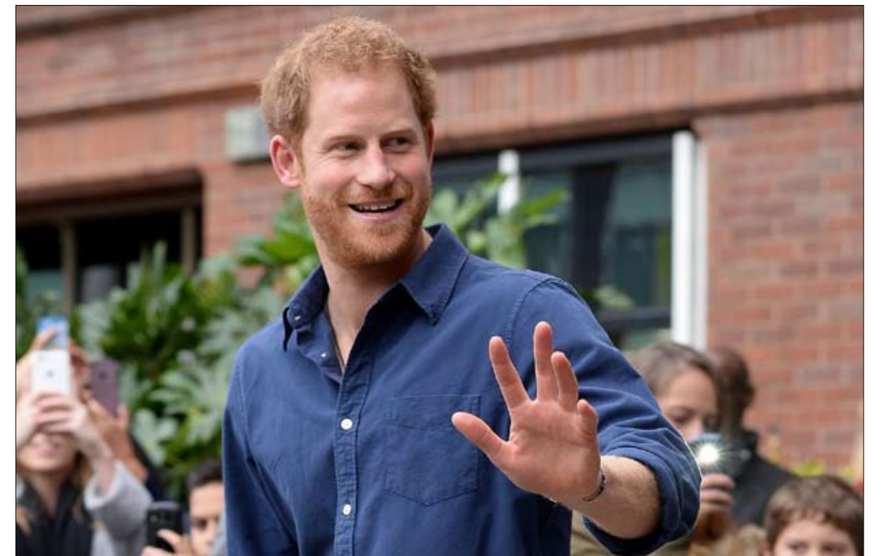
هاري سبق ان حذر الصحافة