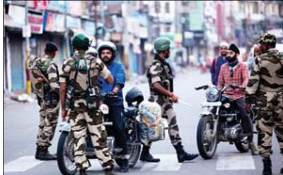
جنود هنود ينتشرون في ولاية جامو

عملية عراقية واسعة ضد داعش في ديسال ونيوى بغداد-وكالات: