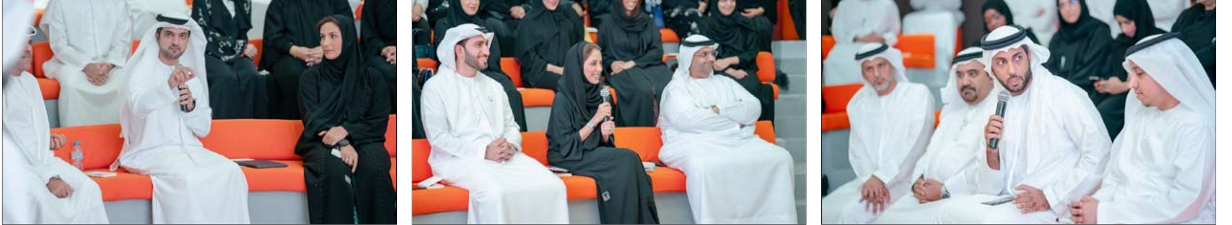
خلال حلقة شبابية شهدت قيادات الجهات الاجتماعية