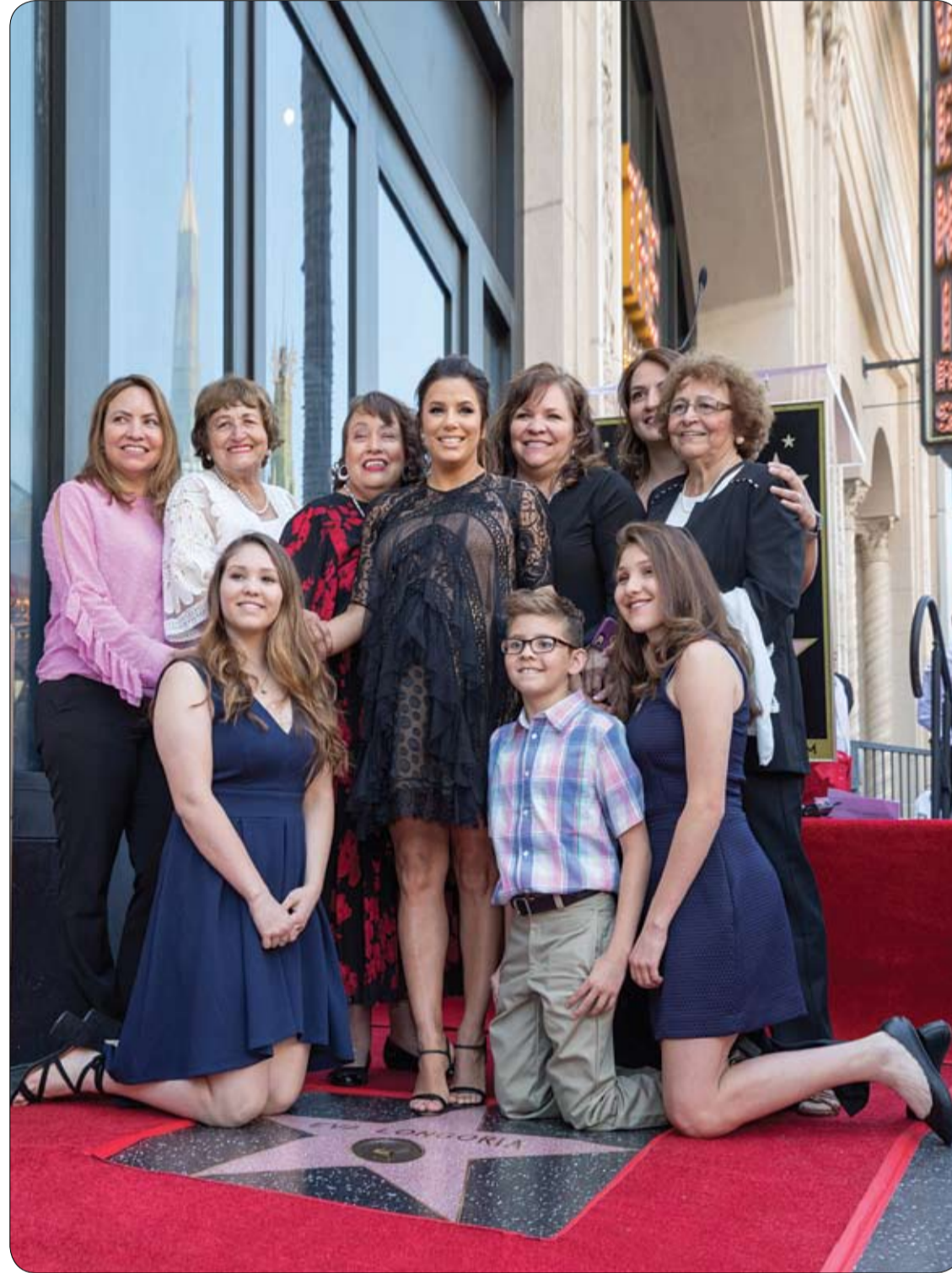
إيفا لونغوريا تحتفل مع عائلتها بتكريمها بنجمة على ممشي المشاهير في هوليوود.

أشارت مجلة "فرويندين" الألمانية إلى، أن هناك بعض الأخطاء التي يرتكبها البعض أثناء غسل الوجه والعناية به، ومنها على سبيل المثال الإقلال من غسل الوجه حتى لا تفقد البشرة الرطوبة، ولكن في هذا الحالة يظهر خطر تراكم كمية كبيرة من الزيوت على البشرة؛ وهو ما يؤدي إلى ظهور الالتهابات والبثور، ولذلك نصحت المجلة الألمانية أصحاب البشرة العادية والمختلطة بغسل الوجه مرة واحدة يوميا أو مرتين على أقصى تقدير. ومن ضمن الأخطاء الأخرى عدم تغيير منتجات العناية مع تغير الفصول، حيث تصبح بشرة الوجه أكثر حساسية خلال فصل الشتاء بسبب نزع الرطوبة منها بسبب الهواء الساخن والبرودة، وفي تلك الأثناء يلزم استعمال منتجات العناية الخفيفة، أما خلال فصل الصيف فيمكن استعمال جل الرغوة أو حمض الساليسيليك في حالة الإصابة الشديد بحب الشباب. وبالإضافة إلى ذلك، فإن الإفراط في استعمال منتجات العناية يضر بشرة الوجه أيضاً؛ ولذلك نصحت المجلة الألمانية باستخدام المستحضرات الخفيفة وخاصة مع البشرة الحساسة، مع عدم فرك الوجه بواسطة منشفة أو فرشاة، ولكن يجب أن تتم عملية التنظيف برفق وفي حركات دائرية.