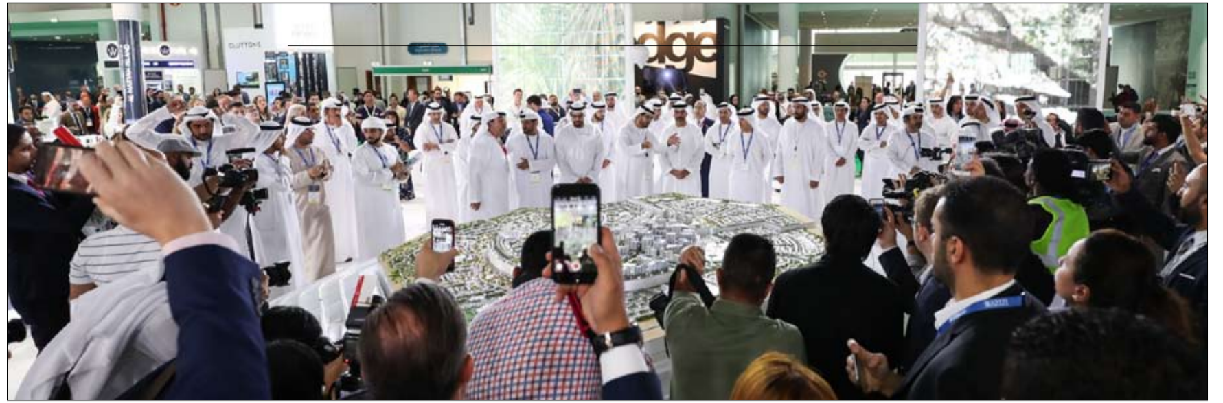
انطلاق النسخة الـ 12 من سيتي سكيب أبوظبي