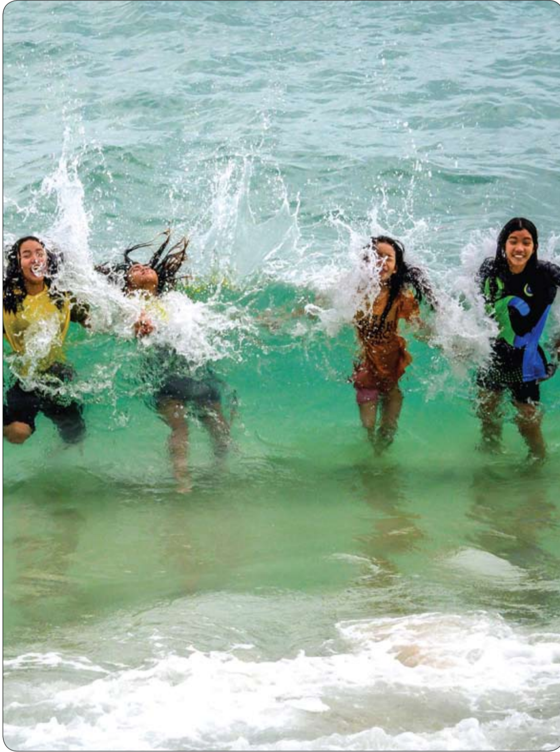
أطفال يلعبون في مواجهة الأمواج على شاطئ في كوه ساموي في خليج تايلاند.

يحدث القرص المنزلق عندما تصبح الحلقة الخارجية ضعيفة أو ممزقة، وتسمح للجزء الداخلي بالانزلاق، ويمكن أن يحدث هذا مع تقدم العمر. وقد تتسبب حركات معينة أيضاً في انزلاق القرص، كما يمكن أن ينزلق القرص من مكانه أثناء التواء أو الدوران لرفع شيء ما. يمكن أن يؤدي رفع جسم ثقيل وكبير جداً إلى الضغط الشديد على أسفل الظهر، مما يؤدي إلى انزلاق القرص، وإذا كانت لدى الشخص وظيفة تتطلب مجهوداً بدنياً شديداً، وتتطلب الكثير من الرفع؛ فقد يكون أكثر عرضة لهذه الإصابة. والأفراد الذين يعانون من زيادة الوزن معرضون أيضاً لخطر متزايد من انزلاق القرص؛ لأن أقراصهم يجب أن تدعم الوزن الإضافي؛ فيما قد يساهم ضعف العضلات ونمط الحياة المستقرة أيضاً في تطور القرص المنزلق.