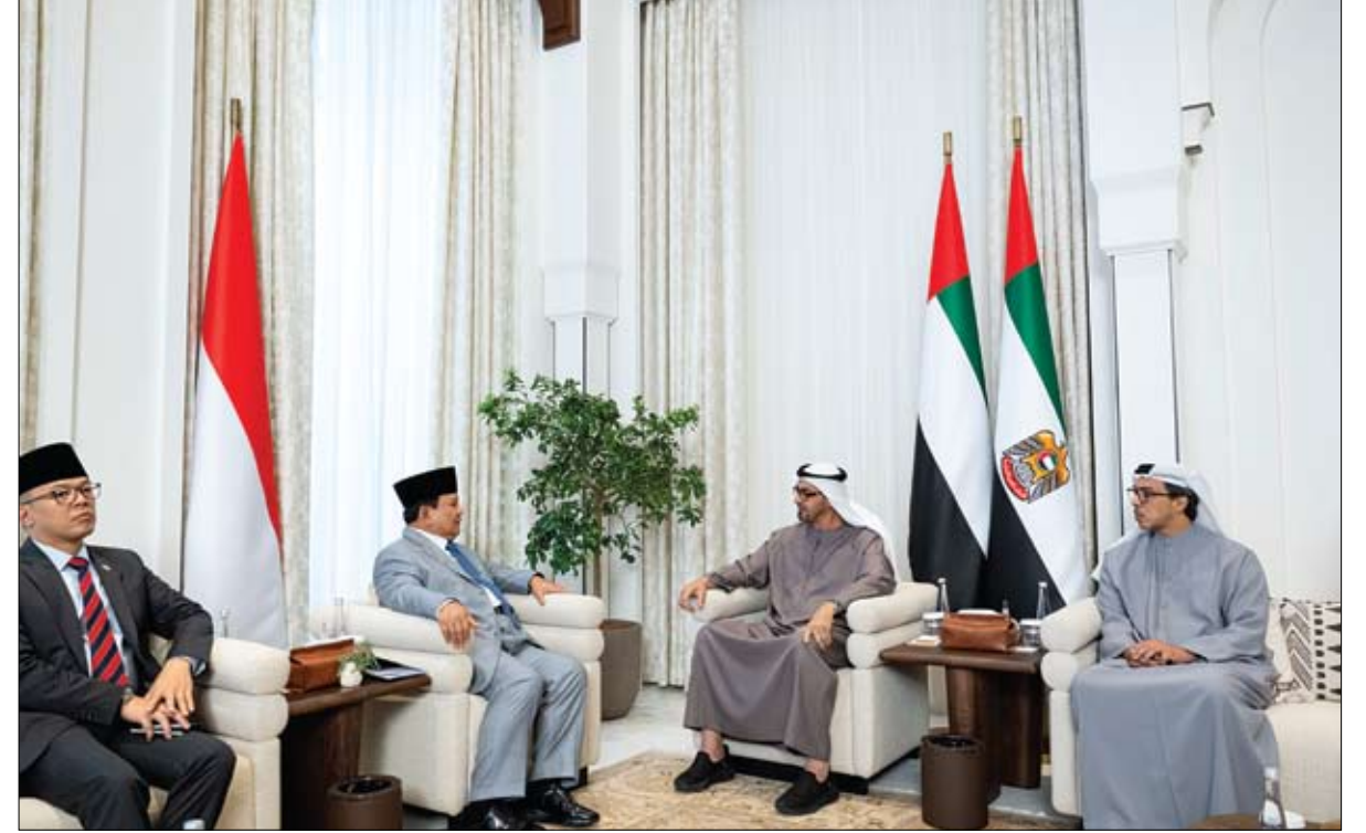
بحثا تعزيز علاقات البلدين في إطار شراكتهما الاقتصادية الشاملة