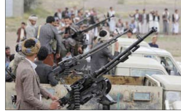
استفزاز عصابات الحوثي خوفاً من انتفاضة الشعب اليمني

من المدنيين، وسقوطها عشوائياً على المدنيين وكذلك التجمعات السكانية. وأكد أن قيادة القوات المشتركة للتحالف مستمرة في اتخاذ الإجراءات الصارمة والرادعة لتحييد وتدمير هذه الفدرات البالسيتية لحماية المدنيين