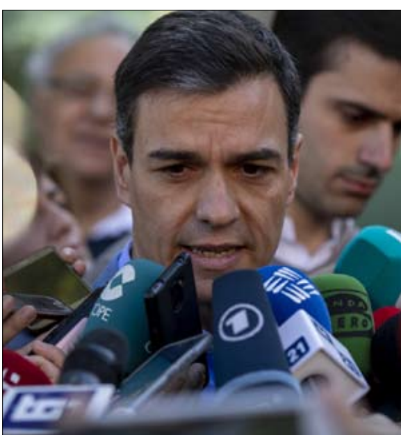
سقوط الثنائية القطبية مع الحزب الشعبي

الجدل السياسي حول المسألة الكاتالونية، جدل يحجب جميع الموضوعات الأخرى تقريباً. إنه عاطفي للغاية ولا يستدعي العقل، يأسف دكتور العلوم السياسية. في مواجهة التحديات الكبيرة التي تواجه إسبانيا، ولأسباب انتخابية، تتمترس الأحزاب في مواقف لا يمكن التوفيق بينها، بدل التوافق من أجل مواجهتها. إن المجتمع في صراع حول هذه المواضيع، برزت التوترات بسرعة بين الرئيس الجديد وحلفائه المؤيدين للاستقلال، وخذلوله عند التصويت على ميزانية 2019، في فبراير، بالوقوف ضدها.