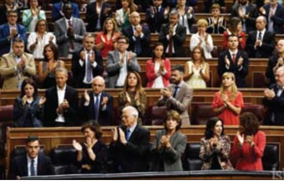
انتفاء الاغلبية يعيق تشكيل الحكومة

اللازمة لأغلبية المطلقة، كان على الحزب أن يجني 53 صوتاً إضافياً في المجلس حتى تتم الموافقة على حكومته يوم التصويت. تمثرت المفاوضات مع "شريكه الفضل"، بوبديوس، وهو حزب يساري راديكالي، في تشكيل الحكومة. (التفاصيل ص6)