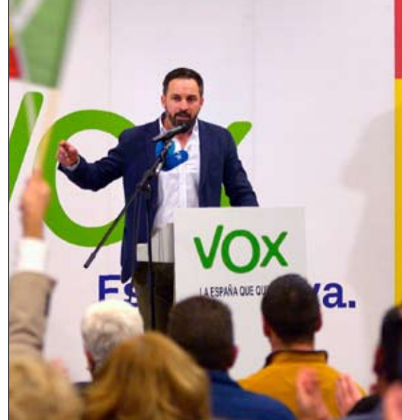
فوكس... اليمين المتطرف يخترق الساحة