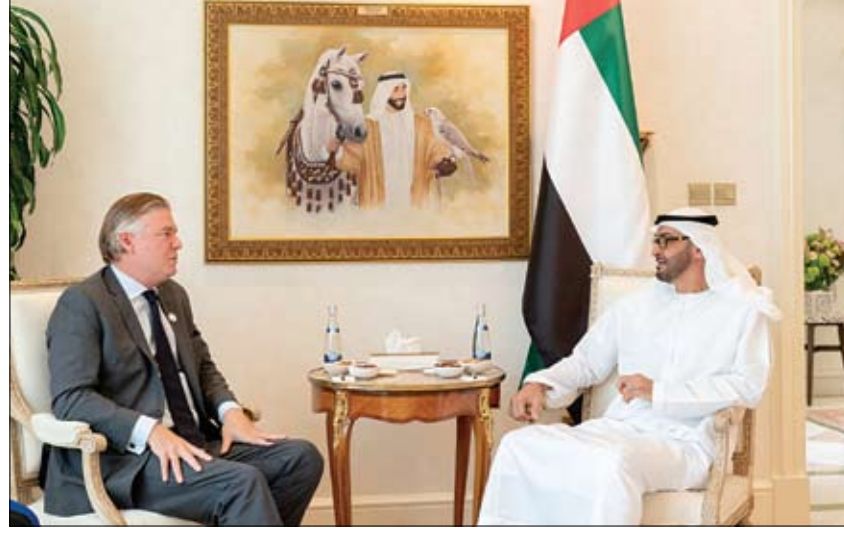
محمد بن زايد خلال استقباله انطونيو استوريز وايت

في خطوة لتصحيح المسار ورفع مستوى مخرجات التعليم ببعض المدارس ، تعكف وزارة التربية والتعليم حالياً على حصر مدربي المدارس ونوابهم ورؤساء وحدات الشؤون الأكاديمية والمعلمين ضعيفي الأداء ، وذلك بهدف وضع خطة علاجية وإخضاعهم لدورات تدريبية مكثفة ، ومن هذا المنطلق وجهت وزارة التربية مؤخراً مدراء المجالس التعليمية ، بحصر لضعاف المستوى ورفع قوائم باسمائهم خلال الأسبوع الجاري ، مؤكدة على أن تشمل تلك القوائم الكوادر من هذه الفئات ، والتي حصلت العام الدراسي الماضي على تقييم يحتاج إلى تحسين . (التفاصيل ص6)