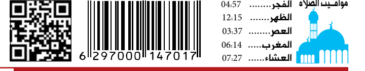
مواقب الصلاة الفجر..... 04:57 الظهر..... 12:15 العصر..... 03:37 المغرب..... 06:14 العشاء..... 07:27 الأثنين 30 سبتمبر 2019 م - غرة صفر 1441 العدد 12744 Monday 30 September 2019 - Issue No 12744

وقال معالي عبد الرحمن العويس في حوار خاص لوكالة أنباء الإمارات وام .. إن اللجنة الوطنية للانتخابات وبالتعاون مع شركائها الاستراتيجيين تحرص على تعزيز الوعي لدى المواطنين بالإجراءات التي تتحقق في مجال المشاركة السياسية والعمل البرلماني بالإمارات .