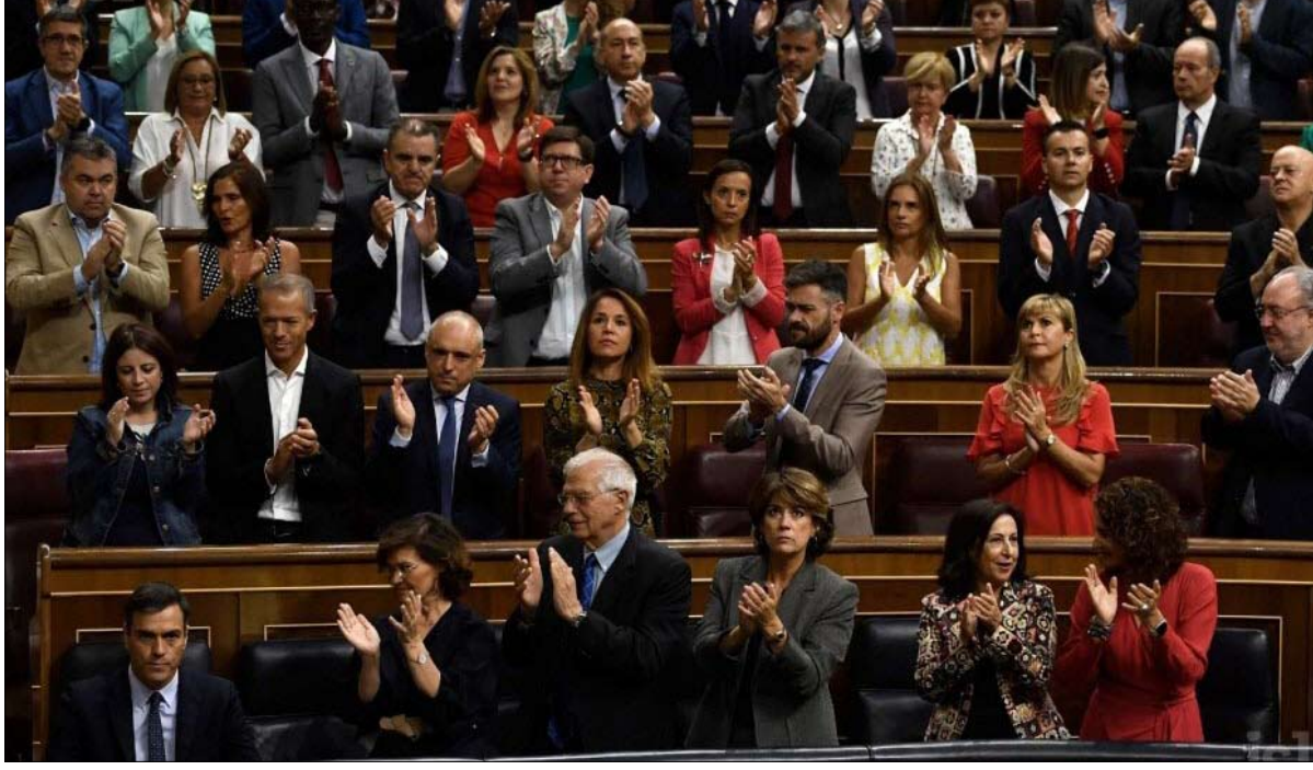
انتقاء الأغلبية يعيق تشكيل الحكومة

لذا، كان لا بد من الاعتماد على المزيد من الأحزاب الصغيرة لإكمال الأغلبية. وسبق للانفصاليين أن تسببوا في سقوط الحكومة الاشتراكية السابقة، وثاروا كراهية جزء من الرأي العام ضدهم. أما بالنسبة لألبرت ريفيرا، زعيم حزب يمين الوسط سيودانوس، الذي حصل على 59 مقعداً في الكونغرس، فقد أغلق الباب أمام أي اتفاق مع الحزب الاشتراكي، بل تم اعتبار هذا الأخير خصماً سياسياً بسبب قربه المفترض من الانفصاليين. ومع ذلك، فإن هذا الجمود ليس سوى آخر حلقة من أزمة سياسية ذات جذور أعمق بكثير. ويجب أن نتبع سلسلة الأحداث لفهم كيف وصلت البلاد إلى هناك.