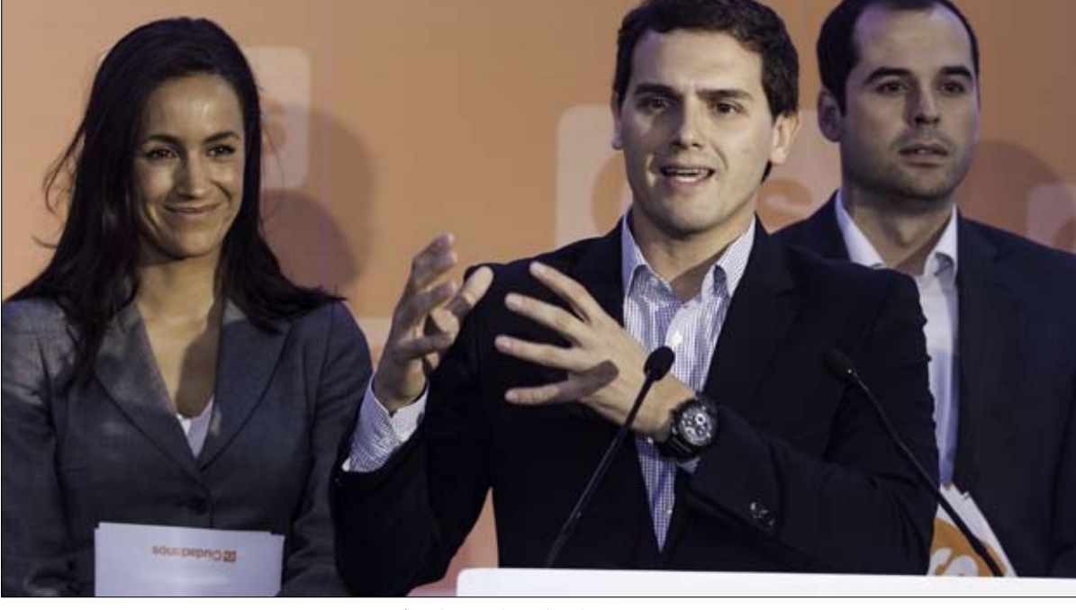
سيودانوس... من الوسط إلى اليمين وطموحات أكبر