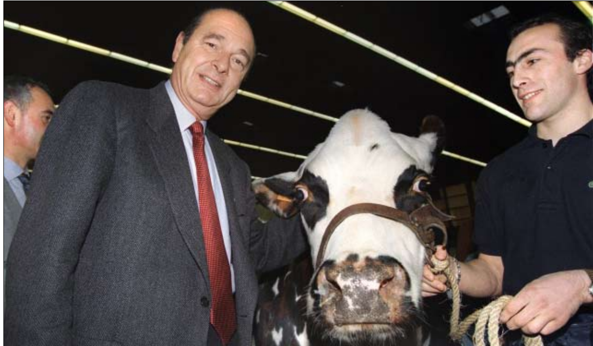
شيراك قريب من الناس