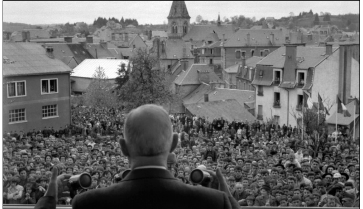
ديغول رسم هيبنة الرئاسة الفرنسية