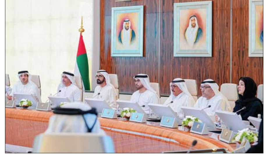
محمد بن راشد خلال ترؤسه اجتماع مجلس الوزراء

استقبل صاحب السمو الشيخ محمد بن زايد آل نهيان ولي عهد أبوظبي نائب القائد الأعلى للقوات المسلحة أمس سعادة انطونيو استوريز وايت أمين عام حزب الشعب الأوروبي عضو البرلمان الأوروبي. وبحث سموه وانطونيو استوريز خلال اللقاء الذي جرى في قصر الجبر عائلات التعاون المشترك بين