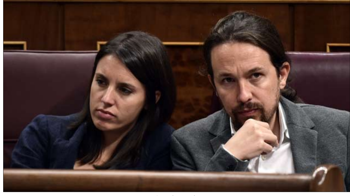
بوديموس رفض التوافق مع الاشتراكيين