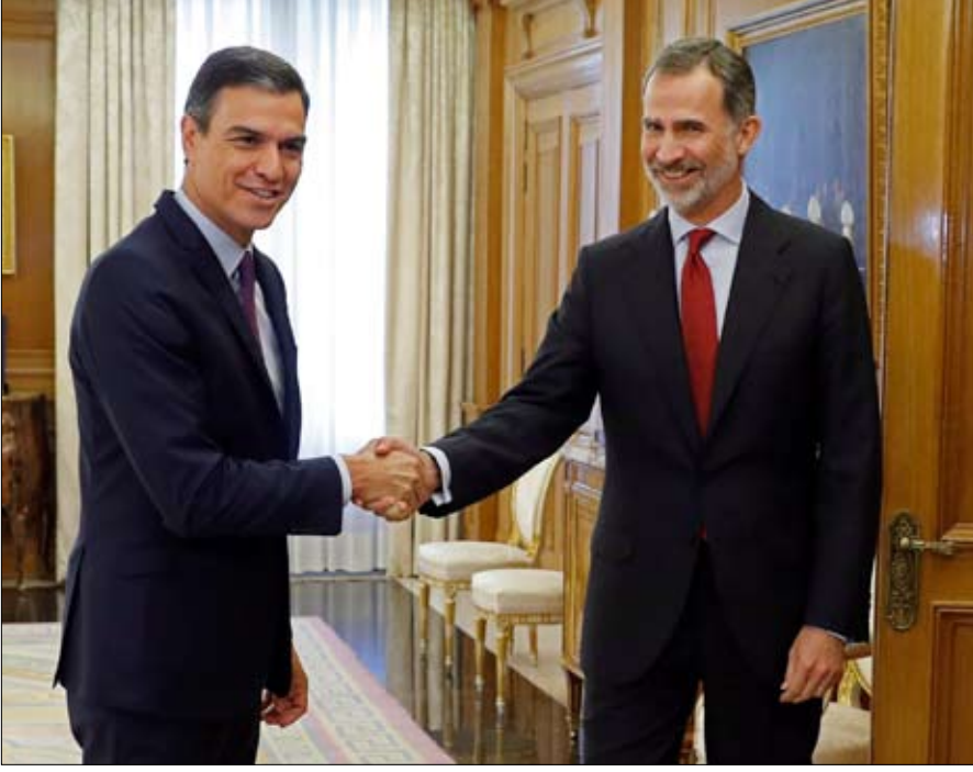
الملك وبيدرو... الدعوة للانتخابات جديدة