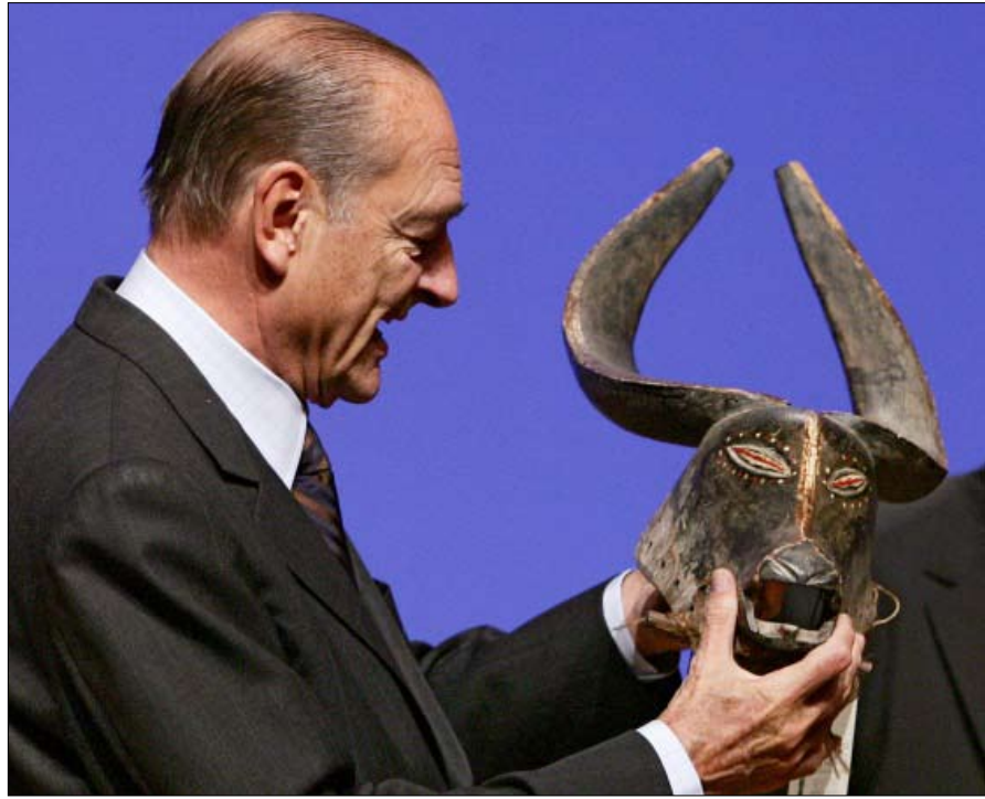
الراحل يهتم بالمسألة الثقافية