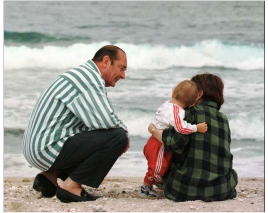
شيراك وابنته كلود وحفيده مارتن