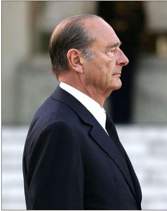
شيراك... رحيل آخر رموز الجمهورية الخامسة