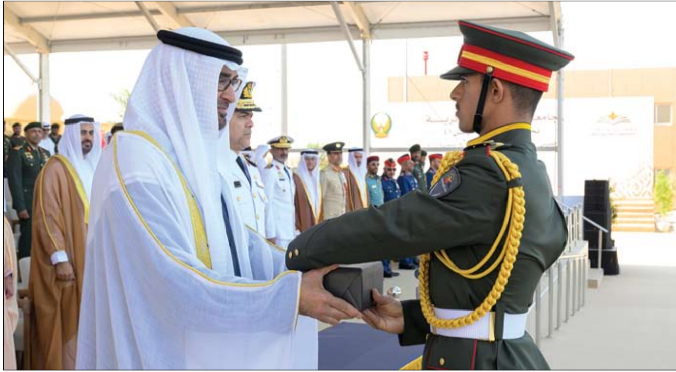
رئيس الدولة خلال تكريمه أحد الخريجين المتميزين من تخريج الدفعة الأولى من جامعة زايد العسكرية (وام)

كما بعث صاحب السمو الشيخ محمد بن راشد آل مكتوم نائب رئيس الدولة رئيس مجلس الوزراء حاكم دبي رعاه الله، وسمو الشيخ منصور بن زايد آل نهيان، نائب رئيس الدولة، نائب رئيس مجلس الوزراء، رئيس ديوان الرئاسة، برفيقتي تهنئة مماثلتين إلى فخامة الدكتور ويليام ساموي روتو.