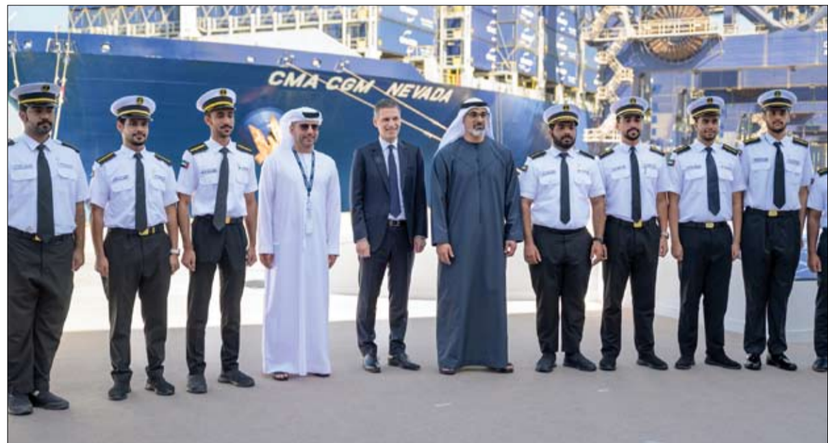
دشن محطة الحاويات (سي إم إيه تيرمينالز) في ميناء خليفة