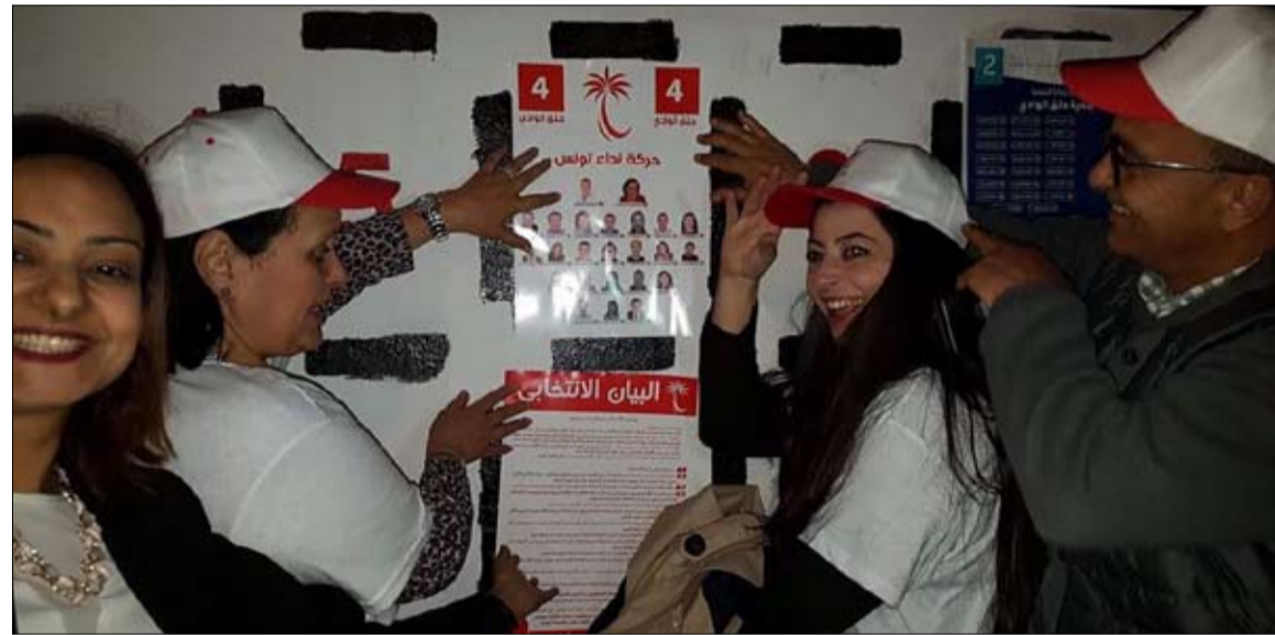
نداء تونس يحتج

البلدية المقرّر تنظيمها يوم 6 مايو المقبل وتتواصل إلى غاية يوم 4 مايو. وبيانهات الحملة الانتخابية يوم 4 مايو المقبل وتنظيم عملية اقتراع الأميين والعسكريين يوم 29 أبريل المقبل لم يتبق موقفه من مختلف المسائل التي وستقوم الاحزاب والائتلافات الحزبية والمستقلون الذين شكلوا قوائم، بتنظيم اجتماعات شعبية وانشطة ميدانية في مختلف انحاء البلاد فضلا عن الاعداد المادي لحامل الحملة للانتخابات البلدية بهدف الوصول الى اقلية الناخب بالمشروع الذي تطرحه القوائم الانتخابية في إطار التنافس.