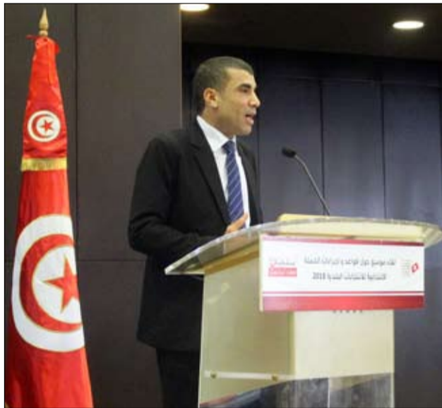
رئيس الهيئة يرد ويوضح

البلدية المقرّر تنظيمها يوم 6 مايو المقبل وتتواصل إلى غاية يوم 4 مايو. وبيانهات الحملة الانتخابية يوم 4 مايو المقبل وتنظيم عملية اقتراع الأميين والعسكريين يوم 29 أبريل المقبل لم يتبق موقفه من مختلف المسائل التي وستقوم الاحزاب والائتلافات الحزبية والمستقلون الذين شكلوا قوائم، بتنظيم اجتماعات شعبية وانشطة ميدانية في مختلف انحاء البلاد فضلا عن الاعداد المادي لحامل الحملة للانتخابات البلدية بهدف الوصول الى اقلية الناخب بالمشروع الذي تطرحه القوائم الانتخابية في إطار التنافس.