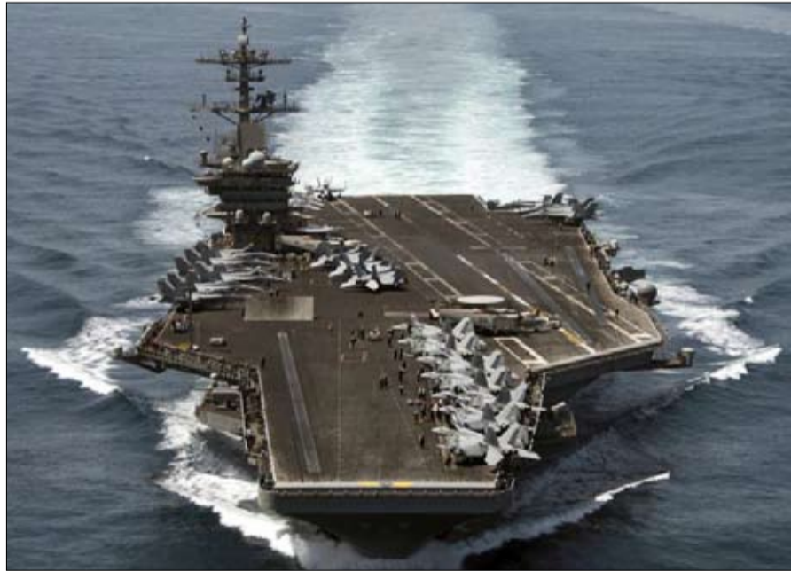
حاملات الطائرات نقطة تفوق أمريكية على الصين

بث التلفزيون الصيني صوراً لموكب مهيب يشق عباب المياه يتكون من 48 سفينة وغواصات بما في ذلك حاملات طائرات و76 طائرة و10 الاف من أفراد