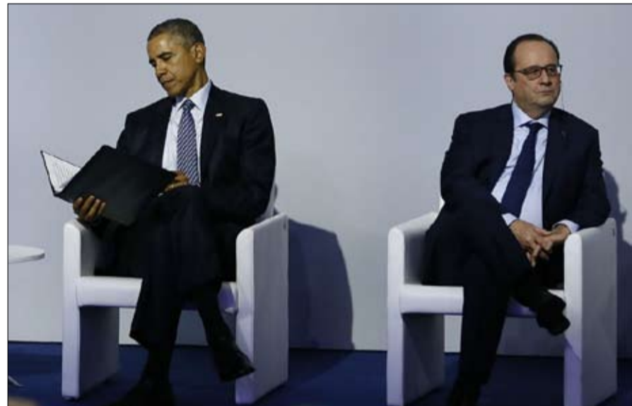
الرغبة في التمايز والانفصال عن هولند ووباما