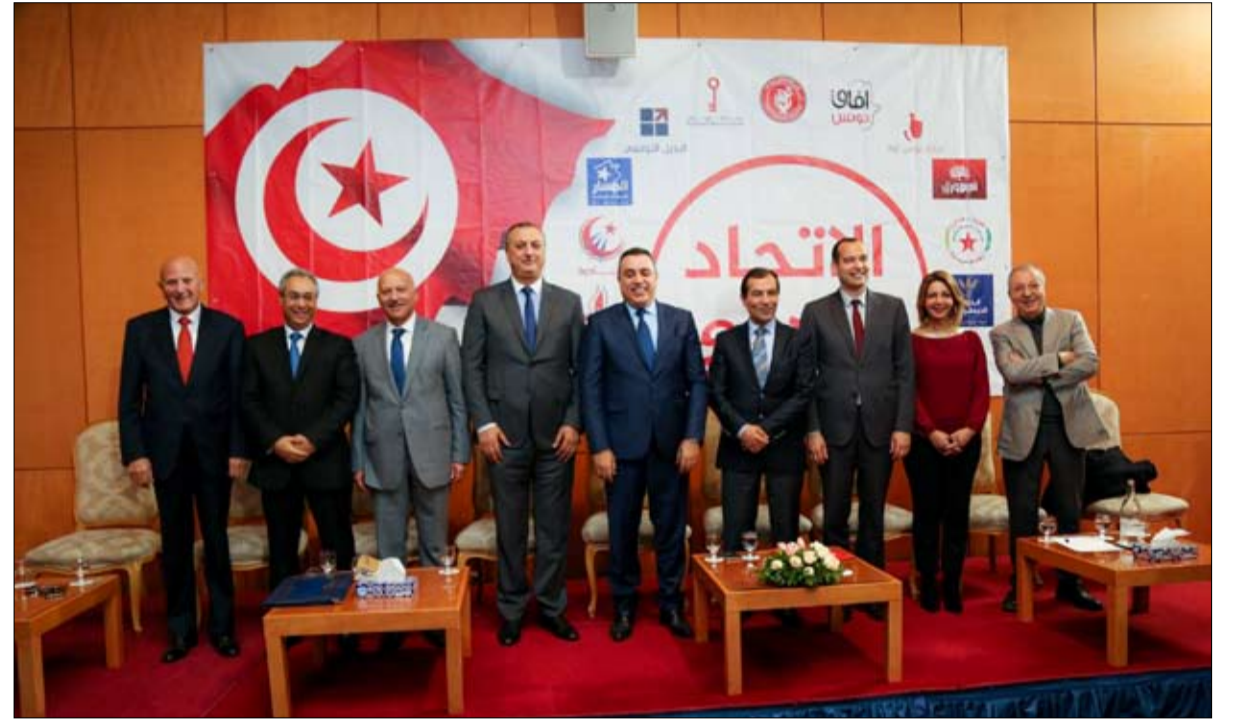
الاتحاد المدني ائتلاف حزبي معارض في السباق

تتوزع على 860 قائمة مستقلة و159 ائتلافية و1055 حزبية.