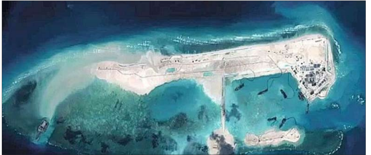
جزر اصطناعية للسيطرة على بحر الصين الجنوبي