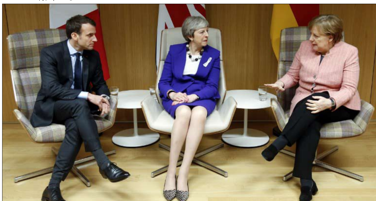
مشروعه الاوروبي يتعثر

يعطي ماكرون الانطباع بقبول لعب الأدوار الثانوية في سيناريوهات لا يسيطر عليها