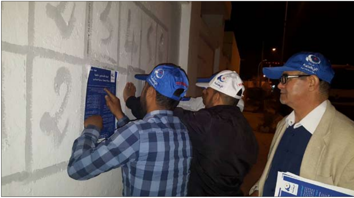
حركة النهضة تباشر تعليق بياناتها