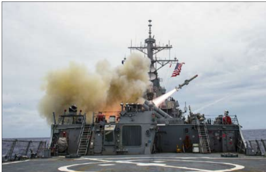
فرنسا الى جانب امريكا في سوريا

وهنا أيضاً، يجب على إيمانويل ماكرون أن يظهر قدرة بيديا فوجية وقدرة على التأقلم والتكيف، ودون شك، شيء من التواضع في مواجهة حقائق العالم اليوم.