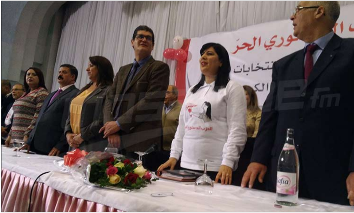
الحزب الدستوري الحر حاضر في الانتخابات