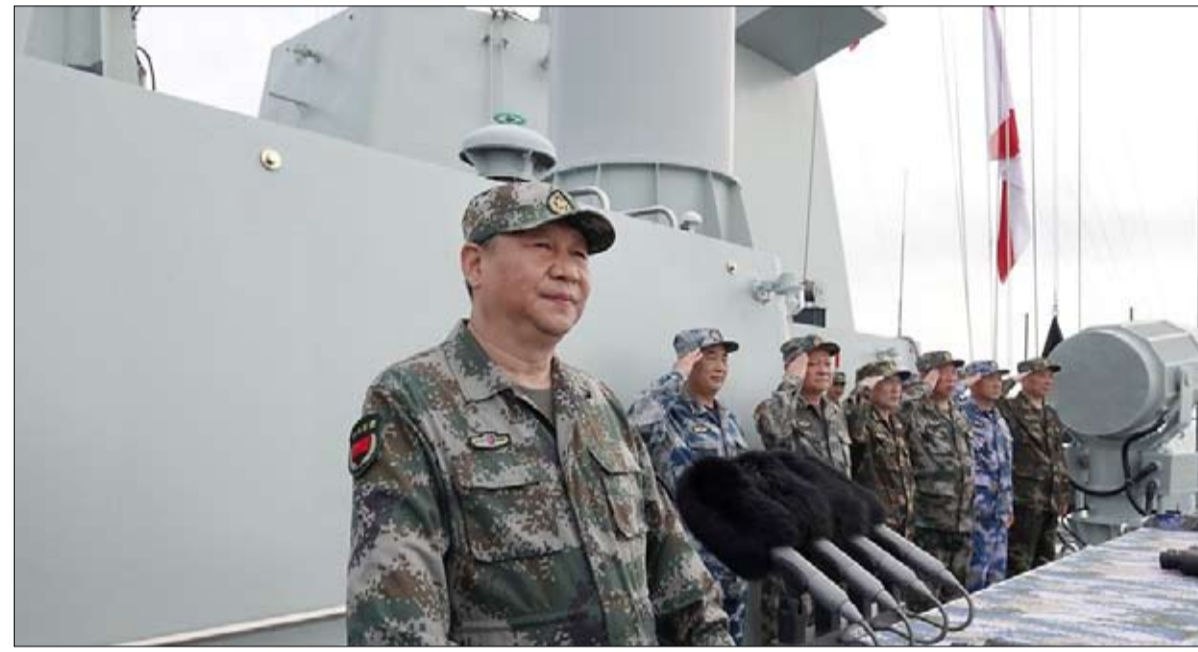
الرئيس الصيني يستعرض قوته البحرية

السيطرة على بحر الصين الجنوبي الذي تطالب به بكين كلياً متجاهلة القانون الدولي (قانون أوروبي تجاوزته الاحداث من منظور الحزب) الذي ادانها من خلال حكم صادر عن محكمة لاهاي عام 2016. احتل الجيش الصيني جزراً، وبني