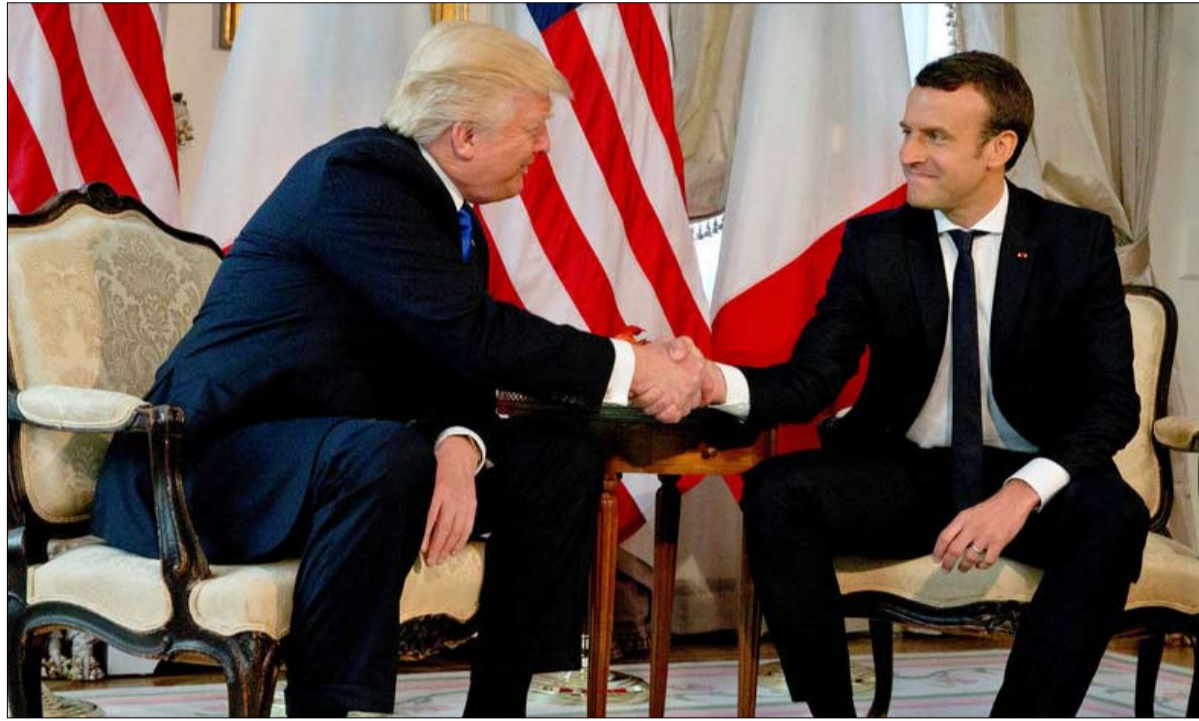
من المواجهة الى الاصطفاف

غير ان هذه المقاربة لا تمنعه، اليوم، من التدخل، إلى جانب دونالد ترامب، في الصراع السوري بعد ما يشتهه في أنه هجوم كيميائي على دوما. ان ترامب وماكرون يتحدان، وينسقان بوميما، كما أكد ماكرون الخميس في حوار تلفزيوني، وأنه وفق هذه الزيجة الأمريكية الفرنسية غير المنتظرة، يتوقع الآخرون، بدء من المملكة المتحدة التي تبخرت علاقتها الخاصة مع الولايات المتحدة بتغيير ساكن البيت الأبيض. فما هي النقطة المشتركة بين دونالد ترامب وإيمانويل ماكرون؟ يريدان التمايز باي ثمن عن سلفيهما، باراك أوباما وفرنسا هولاند اللذين لم يتدخلا عام 2013، وحدها كاختيار، والآخر مكرها، خلال أول هجوم كيميائي منسوب إلى نظام بشار الأسد. ويريد دونالد ترامب، على وجه