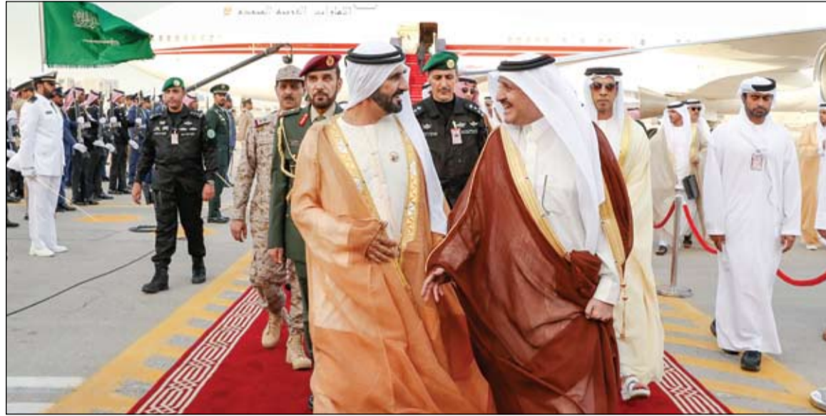
محمد بن راشد لدى وصوله الى السعودية لحضور القمة العربية وبجانبه الامير سعود بن نايف بن عبد العزيز

تشارك القوات المسلحة في المناورات الختامية لأضخم تمرين عسكري في المنطقة لتمرين درع الخليج المشترك 1 بمشاركة 24 دولة خليجية وعربية وإسلامية وصديقة والذي يشهده قادة الدول العربية والإسلامية والصديقة الإثنى القادم بالمنطقة الشرقية بالملكة العربية السعودية. وقال قائد قوة الامارات المشاركة في درع الخليج المشترك 1 ان هذا التمرين يعزز التعاون العسكري بين الدول المشاركة بالإضافة إلى تطوير الكفاءات وتدريب القوات ورفع الكفاءة والجاهزية القتالية. وأكد ان التمرين الذي شاركت فيه وحدات رئيسية من قواتنا المسلحة جسد المهنية العالية لأفراد قواتنا المسلحة. (التفاصيل ص3)