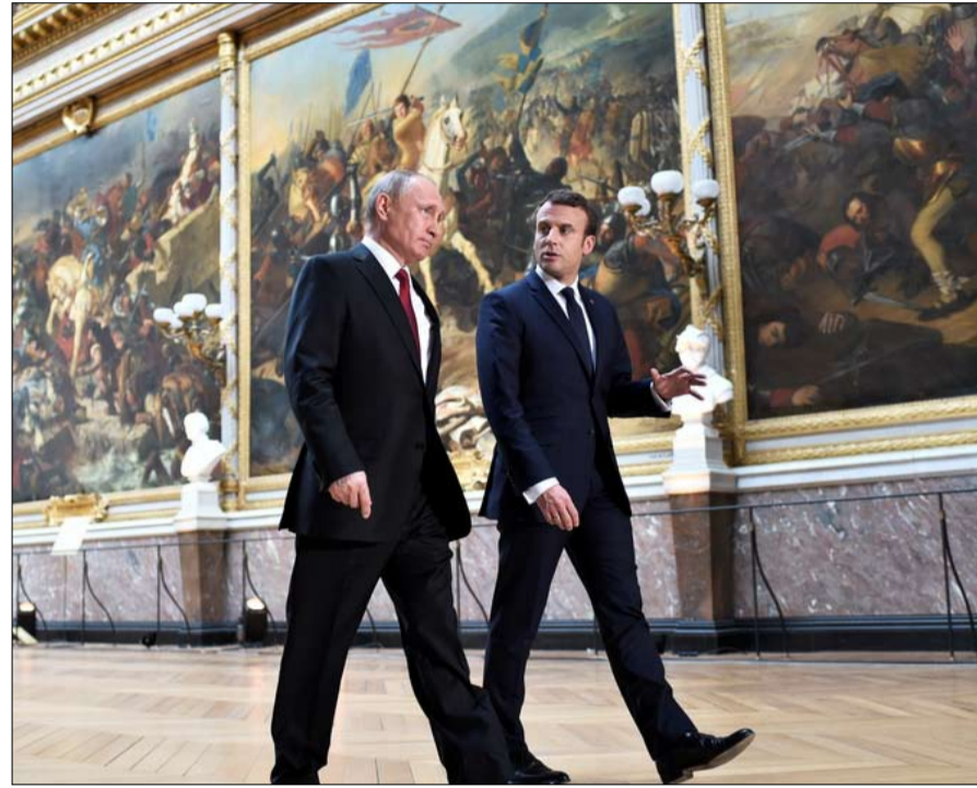
شيء من التواضع مطلوب