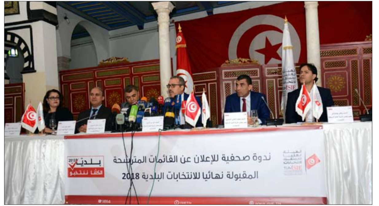
الهيئة العليا للانتخابات تسهر على احترام القانون