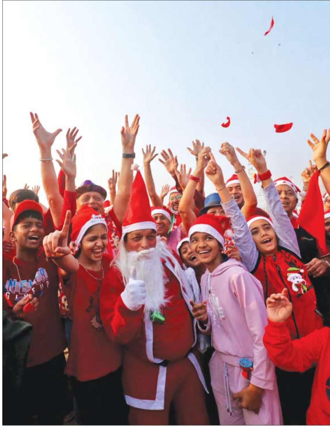
أشخاص يرتدون قبعات بابا نويل يشاركون في جلسة يوغا ضحك خلال احتفالات عيد الميلاد على شاطئ في مومباي، الهند.

ويعد الملاريا مرضا خطيرا يسببه طفيلي يصيب عادة بعوض Anopheles، والذي بدوره ينقل المرض إلى البشر عندما يعضهم. وغالبا ما تظهر على الضحايا أعراض تشبه أعراض الإنفلونزا، بما في ذلك الحمى والصداع والقشعريرة وآلام العضلات والغثيان والقيء. ويصاب الملايين من الناس كل عام ويموت حوالي 400 ألف، معظمهم من الأطفال دون سن الخامسة.