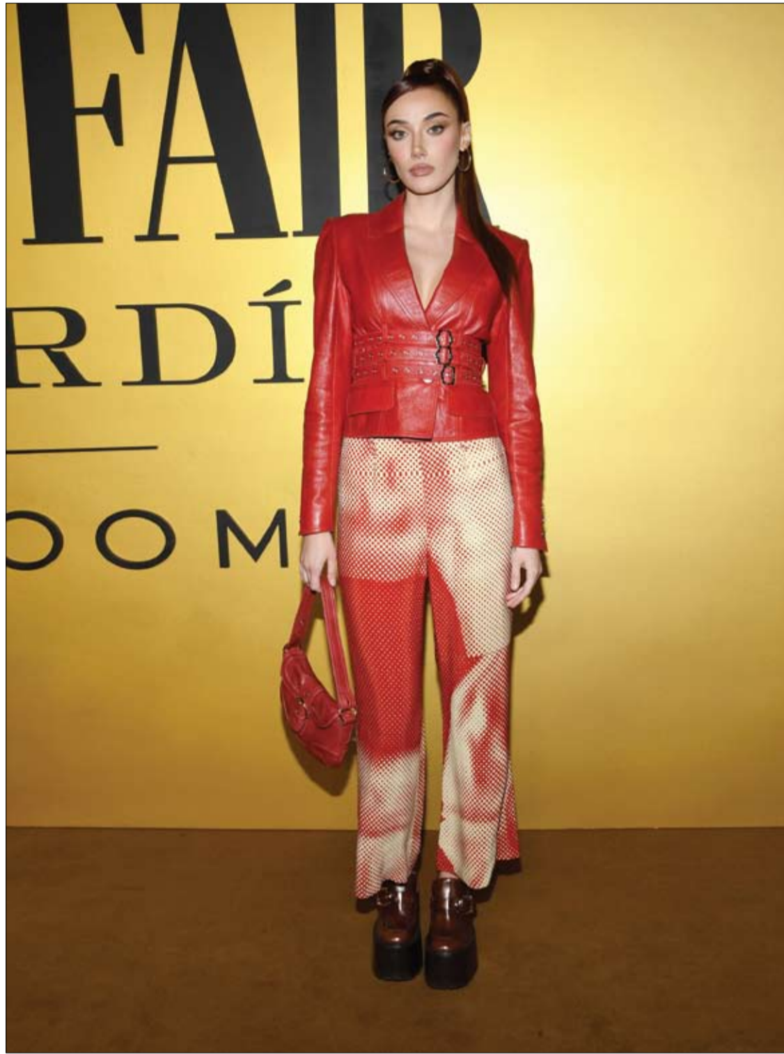
أوليفيا أوبراين خلال حضورها حفل فانيتي «ليلة للشباب» في هوليوود، كاليفورنيا.

ويؤكد الأخصائي، على ضرورة استدعاء سيارة الإسعاف فورا في جميع هذه الحالات.