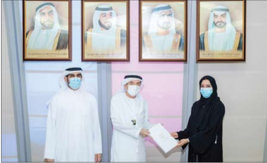
الكبيرة لدعم مسيرة الوطن في الوصول إلى الريادة في كافة المجالات، ويسعدني أن تحصل خريجة من جامعة الإمارات على هذه الزمالة، تقديراً لسهاماتها البحثية البارزة في مركز الإمارات لأبحاث السعادة الذي يُعد أول مركز أبحاث مُخصَّص لموضوع الرفاهية والنهوض بالممارسات القائمة على الأدلة في

تمنح زمالات الجمعية الدولية لعلم النفس الإيجابي لأعضاء الجمعية الذين قدموا أهم المساهمات في التقدم العلمي أو العملي في مجال علم النفس الإيجابي في مجال تخصصهم وفي تطوير الجمعية الدولية لعلم النفس الإيجابي.