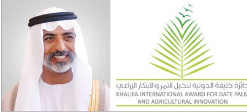
جائزة خليفة الدولية لنخيل التمر والابتكار الزراعي KHALIFA INTERNATIONAL AWARD FOR DATE PALM AND AGRICULTURAL INNOVATION

التكنولوجيا وتعزيز القدرات المختلفة لذوي الاهتمام والمستفيدين باستخدام حلول تكنولوجيا المعلومات والاتصالات، وستقوم الأرينينا بالمشراكة مع الفاو بتسهيل تنفيذ أنشطة المنصة وتشمل هذه الأنشطة: تحديد أولويات البحث والتقنيات المتاحة والابتكارات والممارسات التقنية المتعلقة بسلسلة قيمة محصول نخيل التمر. وبناءً على ذلك، سيتم إنشاء وتشغيل نموذج إقليمي لمنصة البحث والتكنولوجيا والابتكار بما في ذلك نظام المراقبة والتقييم لنظام الإنتاج المتكامل لنخيل التمر، وسيركز هذا النموذج بشكل أساسي على توسيع نطاق ومشاركة نتائج البحوث والتقنيات والابتكارات الواعدة لصغار المنتجين وذوي الاهتمام العائليين. وفي ختام المحاضرة فقد أشاد المحاضر بال دور الكبير الذي تقوم به جائزة خليفة الدولية لنخيل التمر والابتكار الزراعي في دعم وتطوير قطاع زراعة النخيل وإنتاج التمور على مستوى العالم، من خلال تنظيم المهرجان الدولي للتمور الأردنية والمهرجان الدولي للتمور السودانية والمهرجان الدولي للتمور المصرية وما رافقها من أنشطة وفعاليات، التي ساهمت بشكل فاعل في زيادة السمعة للتمور العربية وارتقاء في حجم الصادرات، بالإضافة إلى سلسلة المؤتمرات الدولية التي تنظمها الأمانة العامة للجائزة.