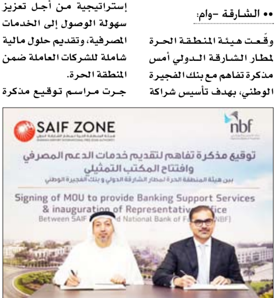
توقيع مذكرة تفاهم لتقديم خدمات الدعم المصرفي وافتتاح المكتب التمثيلي لهيئة المنطقة الحرة لطار الشارقة الدولي وبنك الضجيرة الوطني. Signing of MOU to provide Banking Support Services & inauguration of Representative Office Between SAIF Zone & National Bank of Fujairah (NBF).

استراتيجية من أجل تعزيز سهولة الوصول إلى الخدمات المصرفية، وتقديم حلول مالية شاملة للشركات العاملة ضمن المنطقة الحرة. جرت مراسم توقيع مذكرة التفاهم بحضور عدد من المسؤولين والمدراء من كلا الطرفين بدعم نمو الأعمال، وجذب الاستثمارات، وتعزيز البيئة الاقتصادية الحيوية في دولة الإمارات، وسيعمل بنك الضجيرة الوطني وهيئة المنطقة الحرة لطار الشارقة الدولي من خلال هذا التعاون بشكل وثيق لتقديم خدمات