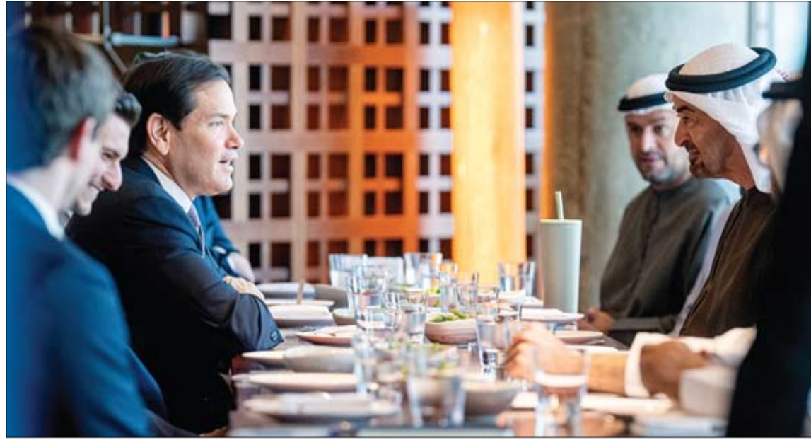
رئيس الدولة خلال مباحثاته مع وزير خارجية الولايات المتحدة الأميركية (وام)