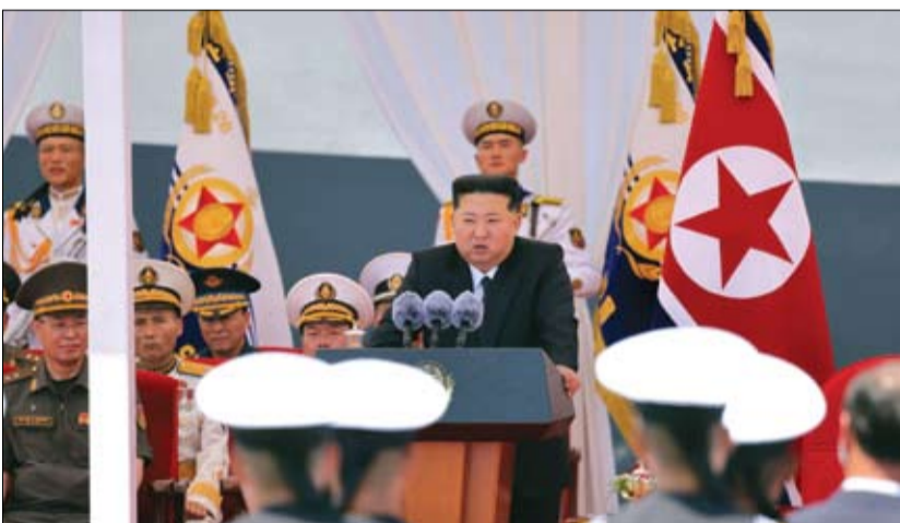
كيم جونج أون يلقي خطاباً خلال حفل تدهين المدمرة (تشوي هيون) في ميناء نامبو بكوريا الشمالية.

روما-رويترز: ردت إيطاليا أمس على تصريحات الأمين العام لحلف شمال الأطلسي مارك روتيه بأن الولايات المتحدة استخدمت قواعد أمريكية في إيطاليا لإطلاق منصات الطائرات لدعم عمليات عسكرية ضد إيران، قائلة إن روما لم تأذن إلا بعمليات فنية وأخرى لوجستية. وفي تصريحات لتلفزيون فوكس نيوز، أشار روتيه إلى إيطاليا باعتبارها مثالا على الدعم الأوروبي للاتحاد، وقال إن 500 طائرة أمريكية أقلعت من قواعد أمريكية في إيطاليا لدعم عملية الغضب للمحمي، وهو الاسم الذي أطلقته واشنطن على الحرب التي شنتها إلى جانب إسرائيل على إيران، وأثارت هذه التصريحات جدلاً سياسياً في إيطاليا، إذ أكدت حكومة رئيسة الوزراء جورجيا ميلوني مرارا على أنها لم تسمح باستخدام أراضي البلاد في انطلاق أي عمل عسكري مباشر ضد إيران.