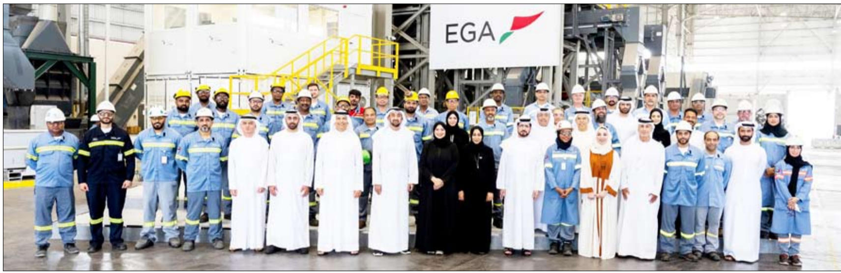
القطاع الصناعي الوطني.

وفي مينيسوتا، ساهمت توسعة عمليات شركة سيكترو أوويز التابعة للإمارات العالمية للألومنيوم في تحقيق طاقة إنتاجية بلغت 65 ألف طن سنوياً في عام 2025. وتعمل الشركة حالياً على تطوير المرحلة الثانية من التوسعة لإضافة 35 ألف طن سنوياً إلى الطاقة الإنتاجية في عام 2027. وفي أبريل، أعلنت شركة الإمارات العالمية للألومنيوم أنها تعزز الاستثمار في الطاقة الإنتاجية في أستراليا، وذلك من خلال شراء 80% من أسهم شركة إيكو جرين الإيطالية المتخصصة في إعادة تدوير الألومنيوم، وذلك رهناً بالموافقة على الترتيبات اللازمة.