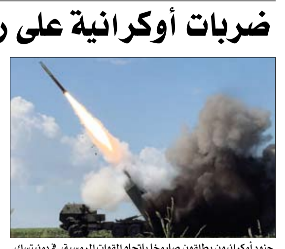
جنود أوكرانيون يطلقون صاروخا باتجاه القوات الروسية، في دونيتسك.

سيول-أ ف ب: قال الزعيم الكوري الشمالي كيم جونج أون إن بلاده تزود البحرية بأسلحة نووية وذلك أثناء تدهينه سفينة حربية، وفق ما ذكرت وكالة الأنباء الكورية المركزية الرسمية الأربعاء، كاشفاً أيضاً خططاً لبناء سفن حربية بزنة 10 آلاف طن. وجاءت هذه التصريحات خلال تدهين السفينة الحربية تشوي هيون، إحدى سفينتين حربيين بزنة 5 آلاف طن أطلقتها الدولة المسلحة نووياً العام الماضي، في مدينة نامبو الساحلية الثلاثاء، وفق الوكالة. وقال كيم خلال المراسم إن برنامج تزويد البحرية بالأسلحة النووية يمضي قدماً وفق الجدول المخطط له. وأضاف هذا مسار إستراتيجي ذو أهمية بالغة لأنه سيكتمل الكورية المركزية الرسمية الأربعاء، كاشفاً أيضاً خططاً لبناء سفن حربية بزنة 10 آلاف طن. وكانت كوريا الشمالية أعلنت في السابق أن المدمرة تشوي هيون مجهزة بأقوى الأسلحة في حين أجرى كيم جولات تفقدية عدة للسفن من فئتها هذا العام، تضمنت الإشراف على تجربة