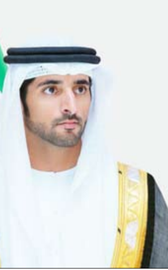
وتحقيق نتائج استثنائية في وقت قياسي. وتأتي الجائزة امتداداً لمبادرة «دبي الأفعال» لترسيخ فلسفة دبي في العمل كثقافة عمل في المؤسسات، ونهجا تبني عليه القدرات التنموية القادمة.

•• دبي-وام: عملت وأنجزت وفق نهج وفلسفة «دبي الأفعال Dubai-it» وتستهدف الجائزة تكريم كل من يحول الأفكار الطموحة إلى واقع ملموس، ويحقق إنجازات نوعية بإتقان وتميز في وقت قياسي، بما يعكس نهج «دبي الأفعال» في العمل، القائم على تحويل الرؤى إلى نتائج ملموسة يراها العالم، وترسيخ ثقافة الإنجاز والتنفيذ الاستثنائي.