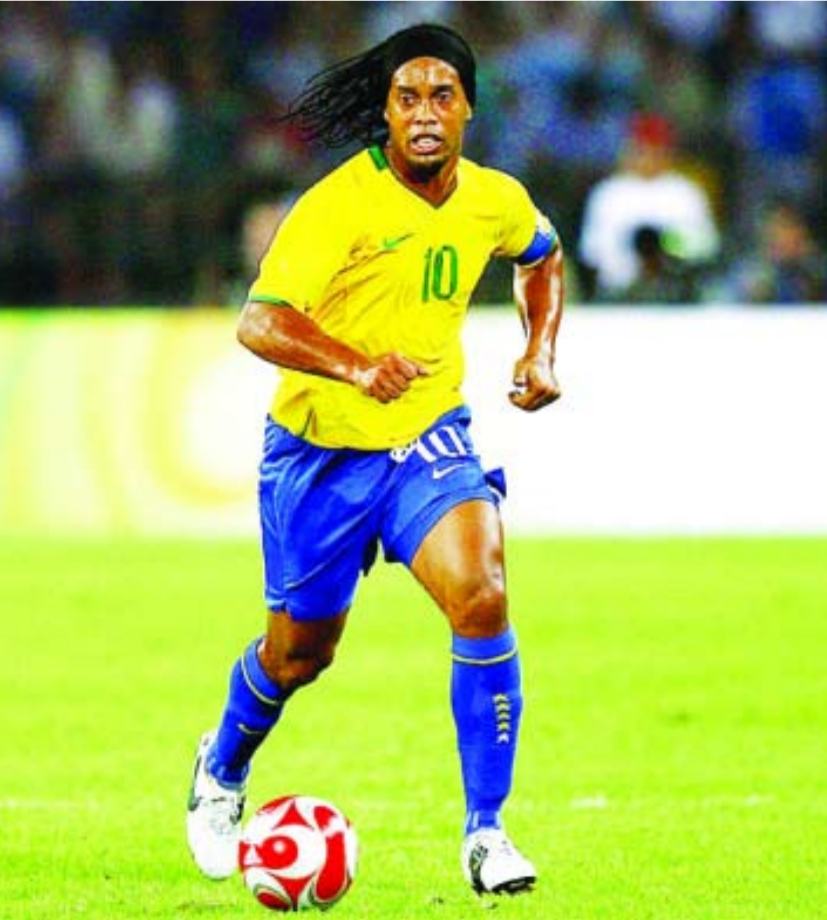
«سعيد للغاية»، وقال رونالدينيو لرويتزر عن

وكان الفائز بجائزة الكرة الذهبية قد لعب لآخر مرة على مستوى الأندية مع فلومينينسي في عام 2015، ولكن بعد مرور أكثر من عقد من الزمان على ابتعاده عن الملاعب، لا تزال الإبتسامة الشابة التي كسب بها قلوب الملايين من المشجعين واحدة من أبرز سماته المميزة. وبسعة ملعب تزيد قليلاً عن 12 ألف متفرج، يعد رافينا مكاناً تميل فيه الأحلام إلى التواضع، وقد لا يكون اسم النادي مؤلفاً للعديد من مشجعي كرة القدم خارج إيطاليا.