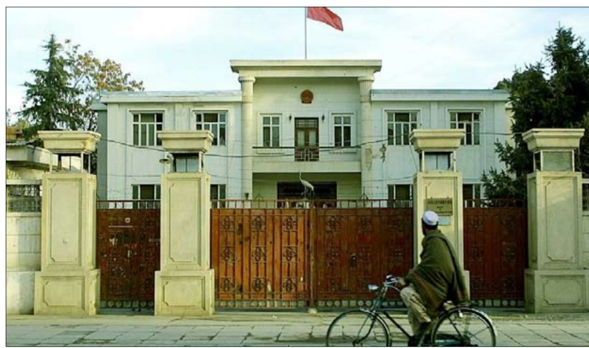
السفارة الصينية في كابول

تشير اللعبة الكبرى إلى الصراع على النفوذ العسكري والدبلوماسي بين بريطانيا وروسيا في آسيا الوسطى بين منتصف القرن التاسع عشر وبداية القرن العشرين. وكانت إحدى النتائج إنشاء دولة عازلة، أفغانستان، في أزمه شبه دائمة منذ ولادتها. فمن ديسمبر 1979 إلى أغسطس 2021، شهدت الدولة ذات الحدود الستة (إيران وتركمانستان وأوزبكستان وطاجيكستان وباكستان والصين) اثنين وأربعين عاماً من الحرب، ثلاثون منها تحت احتلال قوة أجنبية (الاتحاد السوفياتي، ثم الولايات المتحدة).