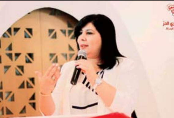
الدستوري الحر يستنكر

القائمة (في إشارة إلى قيس سعيد) كل السلطات المجمعمة بين يديه لإرساء منظومة إدارية وسياسية في خدمة مشروعه الشخصي عوضاً عن الاتكباب على توفير الحلول للمشاكل الاقتصادية والاجتماعية والمالية المتراكمة.