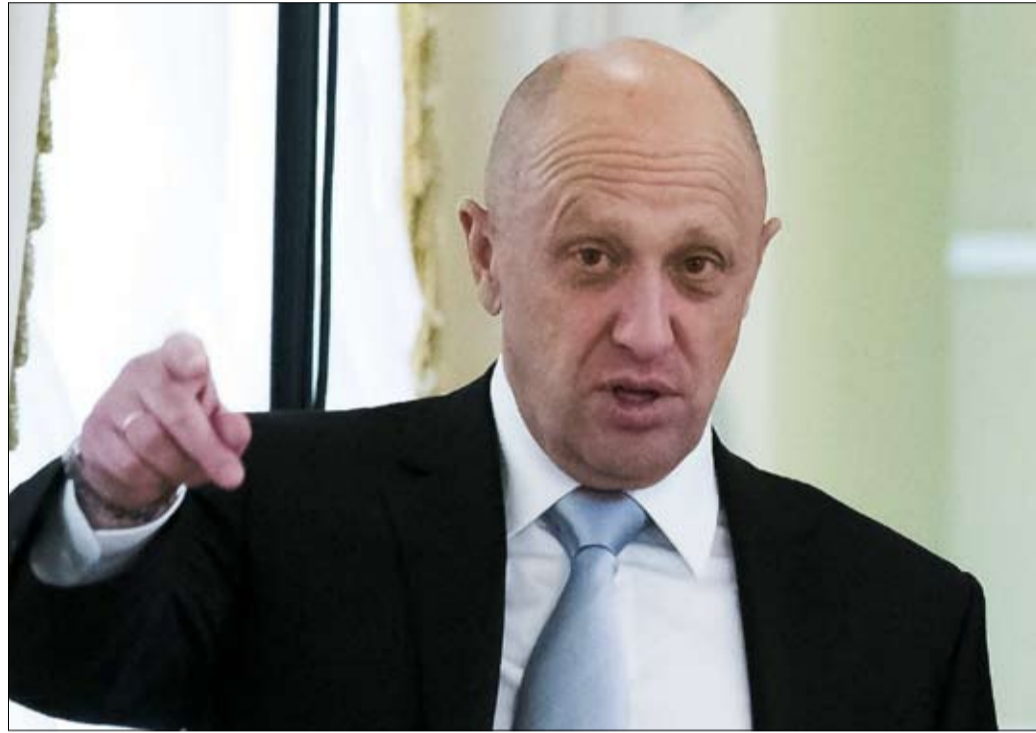
يفغيني بريغوجين ذراع الكرملين في القارة السمراء

العسكريون المتقاعدون، مرتبطون أيضاً بموسكو، ينشطون أيضاً في جمعية معروفة في باماكو: مجموعة الوطنيين الماليين.