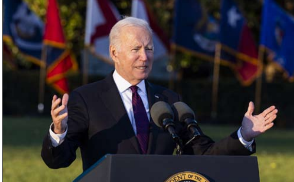
هل انتخاب بايدن مجرد سراب؟

هل سيكون كل هذا كافياً لمواجهة العاصفة الرجعية القادمة؟ أم تخلف أمريكا الديمقراطية كثيراً عن الركب؟ أسئلة، في الوقت الحالي دون إجابة، تستحق أن تُطرح وتسمع لنا بالتفكير في مستقبل الولايات المتحدة، منارة العالم الغربي، التي تنتهي تطوراتها دائماً بعبور المحيط الأطلسي والتأثير على القارة العجوز.