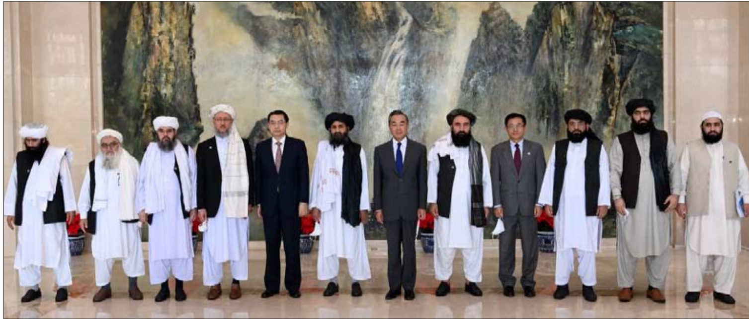
ترسيخ العلاقة بشروط