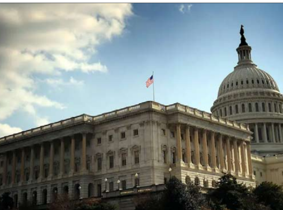
يُطلق على مجلس الشيوخ الأمريكي المقبرة التشريعية

فرغم خسارته بأكثر من 8 ملايين صوت عام 2020 أمام جو بايدن، كان بإمكان ترامب الفوز بـ 50 ألف صوت إضافي فقط موزعة على أربع ولايات رئيسية. ويفضل تركيبة مجلس الشيوخ (مقعدين لكل ولاية)، يتمتع الجمهوريون بقدرته