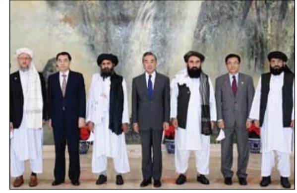
ترسيخ العلاقة بشروط

قتل 5 من المقاتلين الأكراد البشمركة، وجرح 4 آخرون في انفجار عبوة ناسفة استهدف آلية عسكرية ليل الأحد، شمالي العراق، بينما اعتبر رئيس إقليم كردستان العراق، نيجيرفان بارزاني اتساع نطاق هجمات تنظيم داعش الإرهابي تهديداً خطيراً للمنطقة.