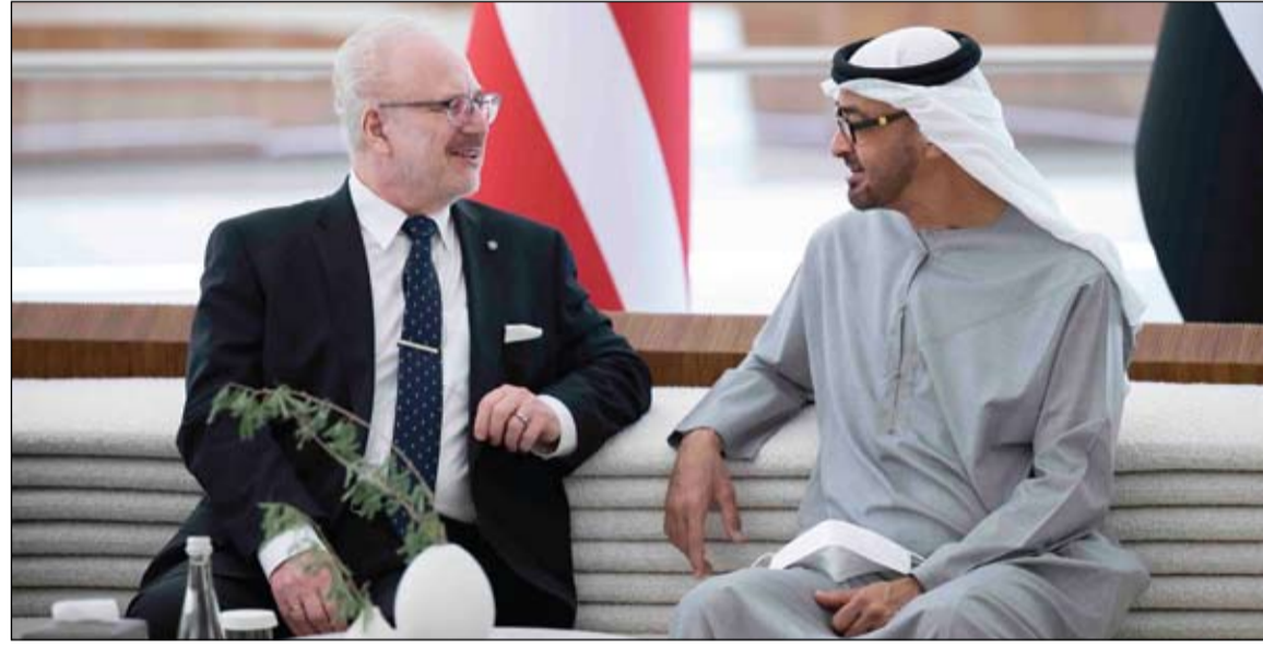
محمد بن زايد خلال استقباله رئيس لاتفيا في إكسبو 2020 دبي (وام)

أمر صاحب السمو الشيخ خليفة بن زايد آل نهيان رئيس الدولة حفظه الله، بالإفراج عن 870 نزيلا من نزلاء المشآت الإصلاحية والعقابية ممن صدرت بحقهم أحكام في قضايا مختلفة وتكفل سموه بتسديد الغرامات المالية التي ترتبت عليهم تنفيذاً لتلك الأحكام، وذلك بمناسبة عيد الاتحاد الـ 50 للدولة. وتأتي هذه المكرمة السامية من صاحب السمو رئيس الدولة حفظه الله في إطار المبادرات الإنسانية لدولة الإمارات التي تستند إلى قيم العفو والتسامح ومنحهم فرصة التغيير نحو الأفضل والبدء من جديد بمشاركة الإيجابية في الحياة بالشكل الذي يعكس على أسرهم ومجتمعهم وإعطائهم فرصة لبدء حياة جديدة والتخفيف من معاناة أسرهم.