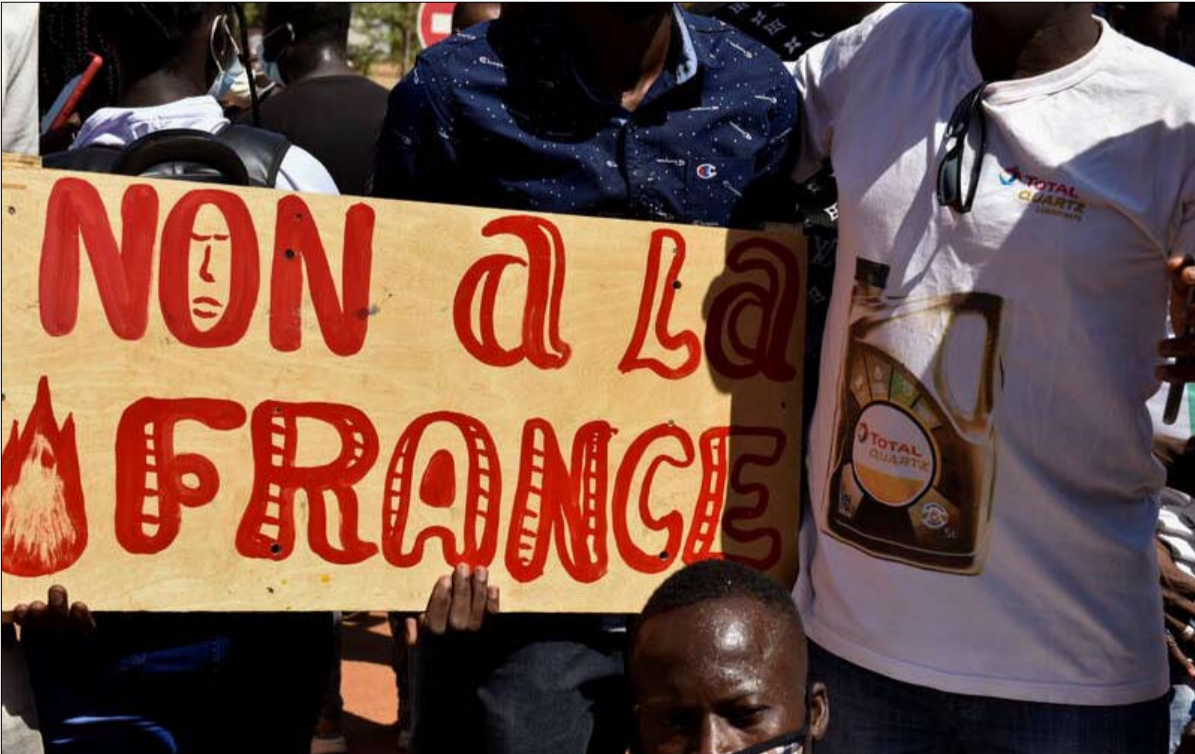
مظاهرة ضد الوجود الفرنسي في منطقة الساحل

راديو مخترق يستثمر الكرملين في كل الاتجاهات لنشر هذه النفمة المعادية لفرنسا. ويعتمد أولاً وقبل كل شيء على النظام الرسمي من خلال القنوات الرئيسية في السمعي-البصري الخارجي العمومي، وكالة سيونتيك للأخبار وقناة روسيا اليوم التلفزيونية. تم تأسيسهما أولاً في المغرب العربي، ووسعتا وجودهما في إفريقيا جنوب الصحراء، واعتمدتا على التعاون مع وسائل الإعلام المحلية، كما يوضح الباحث ماكسيم أودينيت، من معهد البحوث الاستراتيجية بالمدرسة الحربية، في دراسة