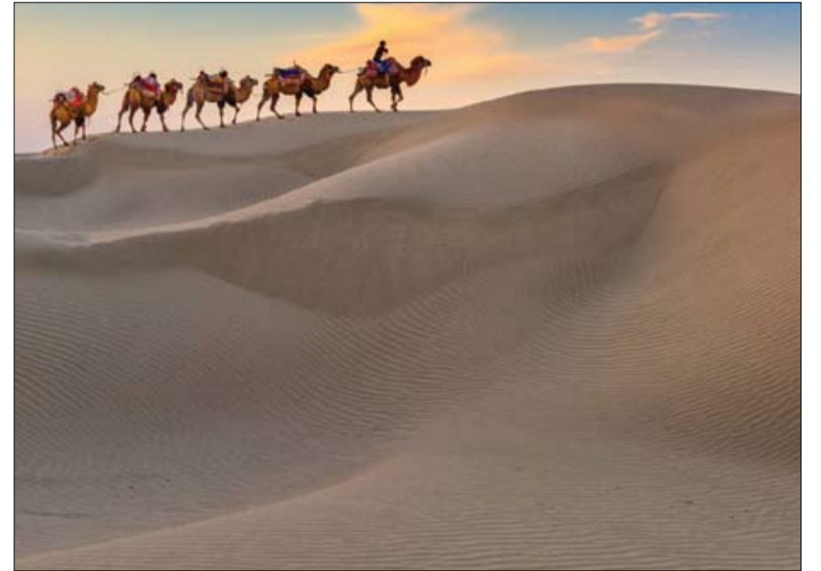
الأويغور ومقاطعة شينجيانغ وراء العلاقة بين الصين وطالبان