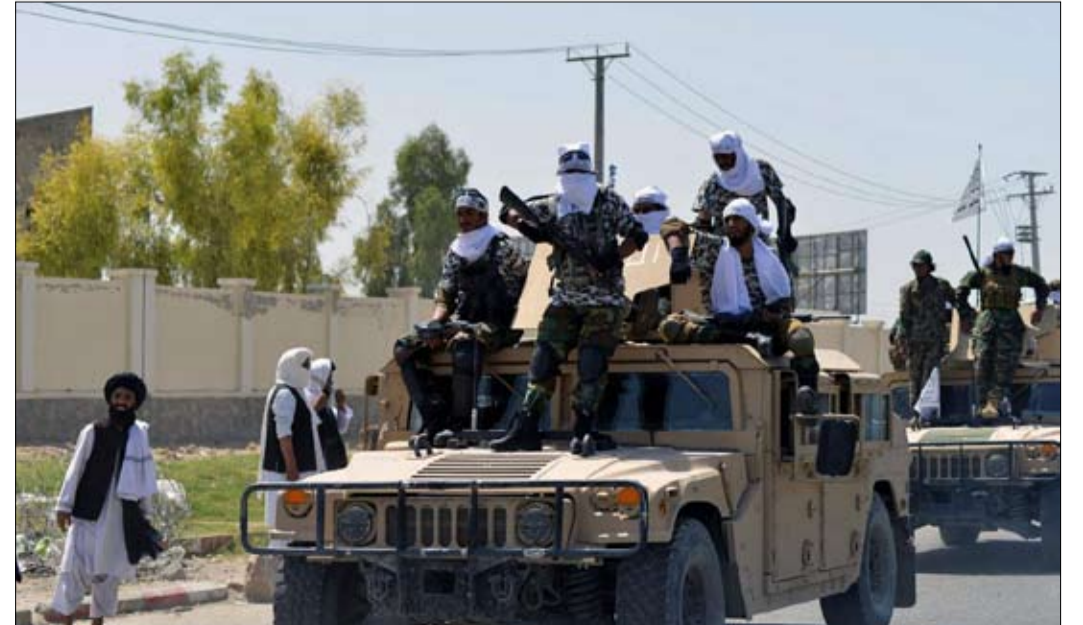
هل ستؤمن طالبان حدود الصين؟

تريد بكين تبادي إقامة ملاذ للإرهاب على أعتابها لهذا، تتأرجح استراتيجيتها بين الاحتواء والتدخل