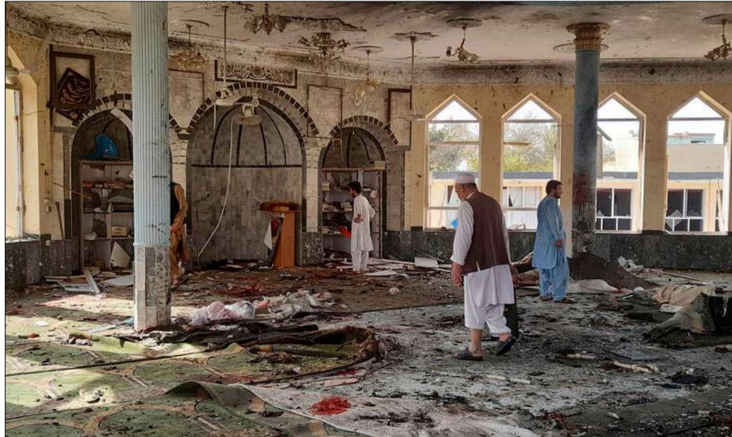
العمليات الارهابية هاجس بكين الاول

رغم أنها لا ترفض المساعدات غير المشروطة من الدول الغربية، إلا أن طالبان تفضل الاستثمار الصيني