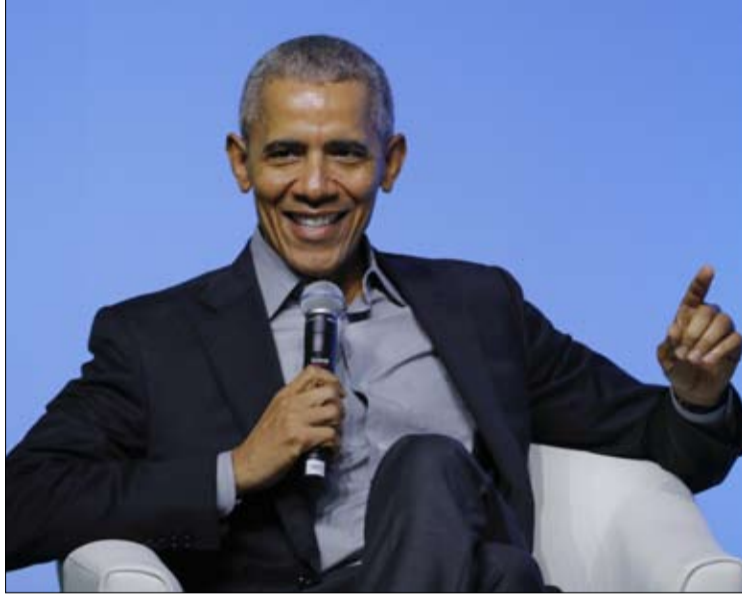
حتى باراك اوباما فشل في الاختيار

تحليل كريستوف لو باوتشر، سيتعين على جو بايدن أن يفوز بفارق كبير في انتخابات التجديد النصفي ليأمل في الاحتفاظ بأغلبية. إنها مهمة باتت أكثر تعقيداً بعد أن تخلى عن أقسام كاملة من برنامجه خلال العملية التشريعية التي ستؤدي إلى التصويت على مشروعه الاستثنائي الكبير "إعادة البناء بشكل أفضل".