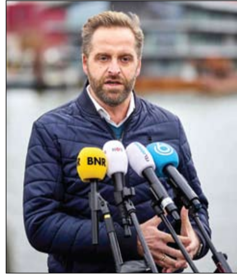
وزير الصحة الهولندي يتحدث عن تطورات الوضع الوبائي

فرض الرئيس الأمريكي جو بايدن قيوداً على السفر تشمل دول منطقة الجنوب الإفريقي، وانضم إلى جهود دولية لإبطاء انتشار سلالة جديدة سريعة الانتشار من كوفيد-19 تسمى أوميكرون، التي أثار انتشارها في الأسواق العالمية، سبباً ذكرت وكالة بلومبرغ للأخبار. وقال بايدن في بيان إن إدارته ستفرض قيوداً على السفر من جنوب إفريقيا و7 دول أخرى اعتباراً من الاثنين المقبل كإجراء احترازي حتى تحصل على مزيد من المعلومات عن سلالة أوميكرون.