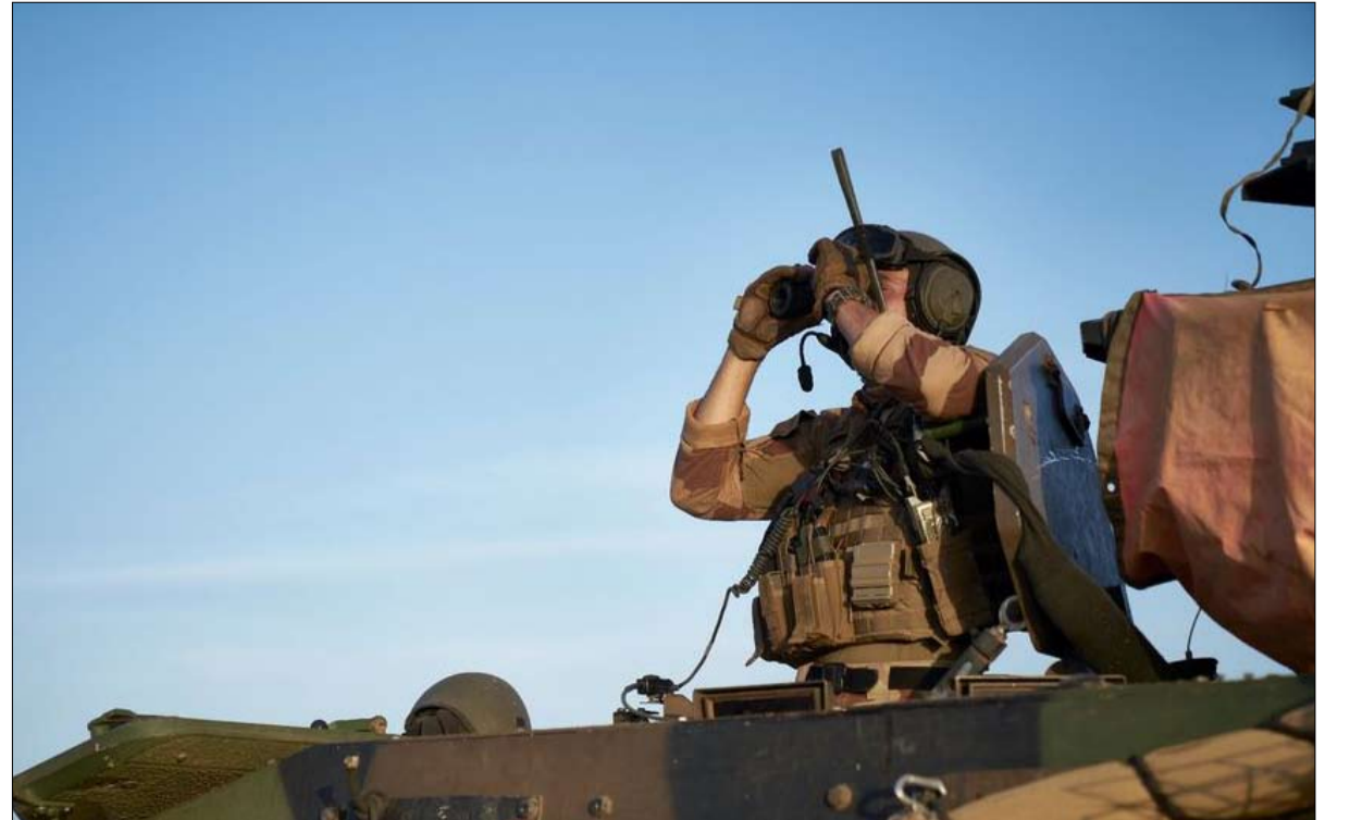
جندي فرنسي من عملية برخان شمال بوركينا فاسو