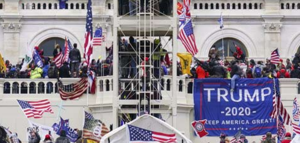
الهجوم على الكابيتول نقطة فارقة

يضاعف الحزب الجمهوري المعارك الثقافية، ويعجز الديمقراطيون عن الرد وعكس الهجوم