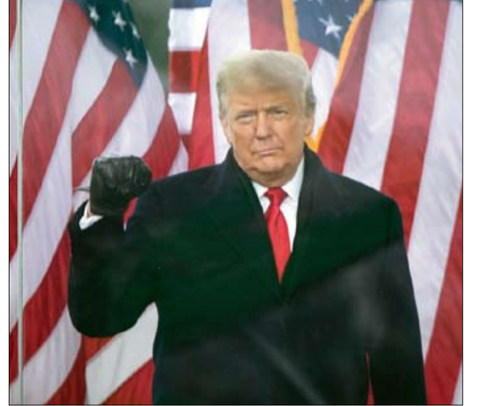
اتجاه الريح في صالح دونالد ترامب

وفي هذا السياق، قد تكون عودة الحزب الديمقراطي للسلطة في يناير الماضي مجرد سراب، أو في أفضل الاحوال، الأمل الأخير في تجديد ديمقراطي. وبعد عام واحد من الانتخابات الرئاسية، قام كريستوف لو باوتشر وكليمان بيرو، المتخصصان في الولايات المتحدة، بالوصول إلى هذه الملاحظة في كتابهما "الأوهام الضائعة لأمريكا الديمقراطية"، الذي صدر 14 أكتوبر 2021 عن منشورات فنديمار.