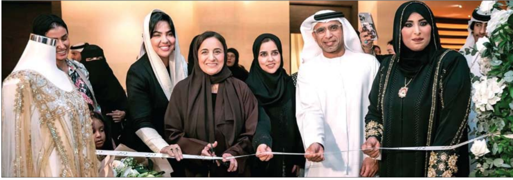
نظمتها جمعية الإمارات لرائدات الأعمال بمشاركة 45 جهة