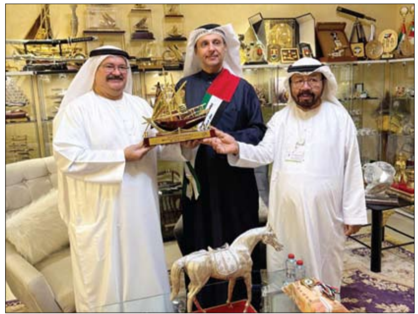
لتعزيز التعاون بين المؤسسات الخليجية