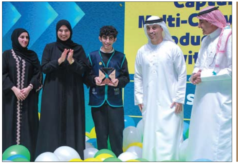
خلال حفل ختام فعاليات المهرجان الوطني للعلوم والتكنولوجيا والابتكار