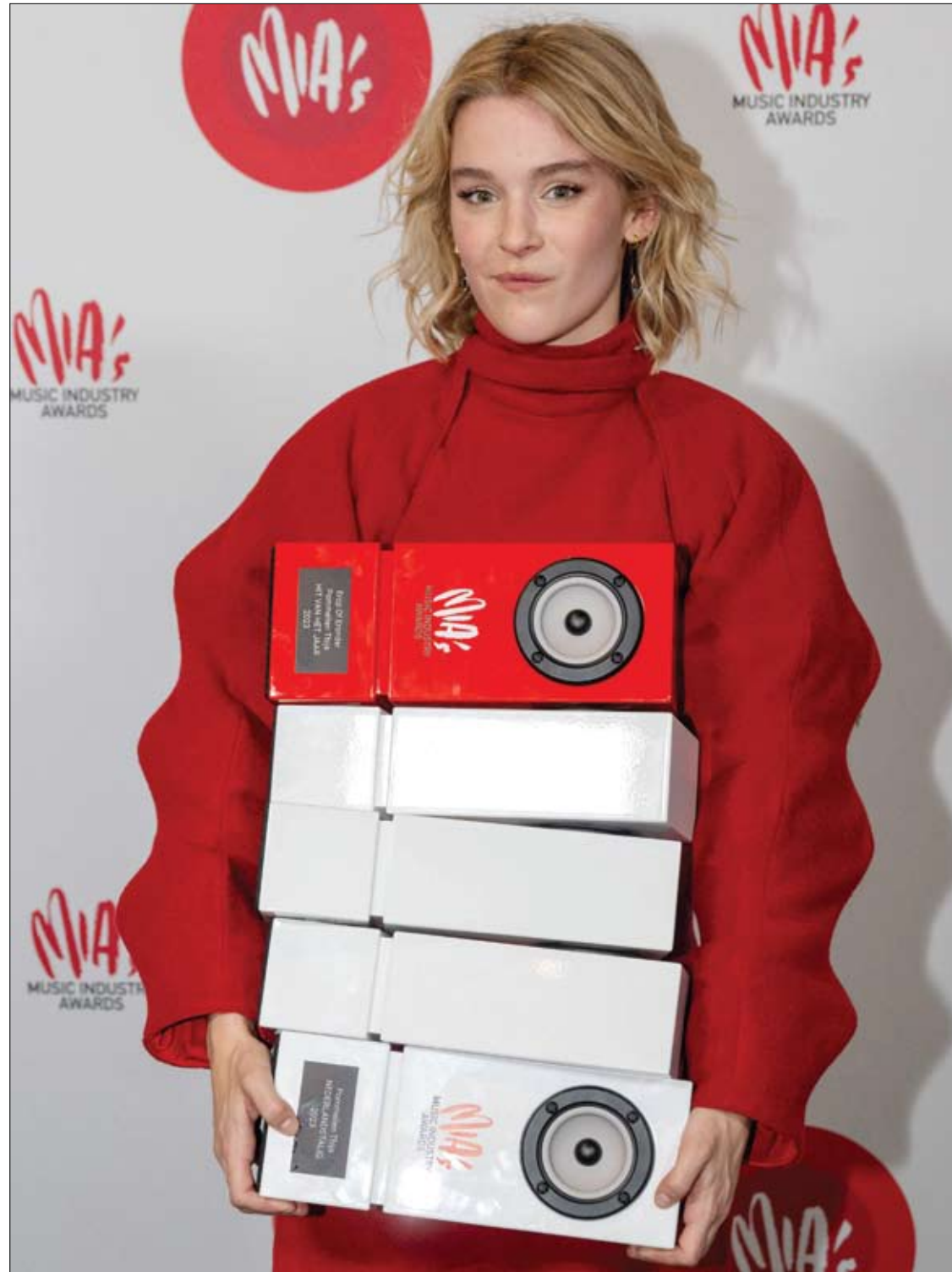
المثلة والمغنية البلجيكية بوميبيان تيس تحمل جوائزها في نهاية حفل توزيع جوائز MIA جائزة صناعة الموسيقى. ا ف ب

وأوضح بيلخو: "مفتاح العلاج هو ضمان اتخاذ تدابير النظافة الدقيقة لمنع انتشار المرض إلى العين وإلى الآخرين".