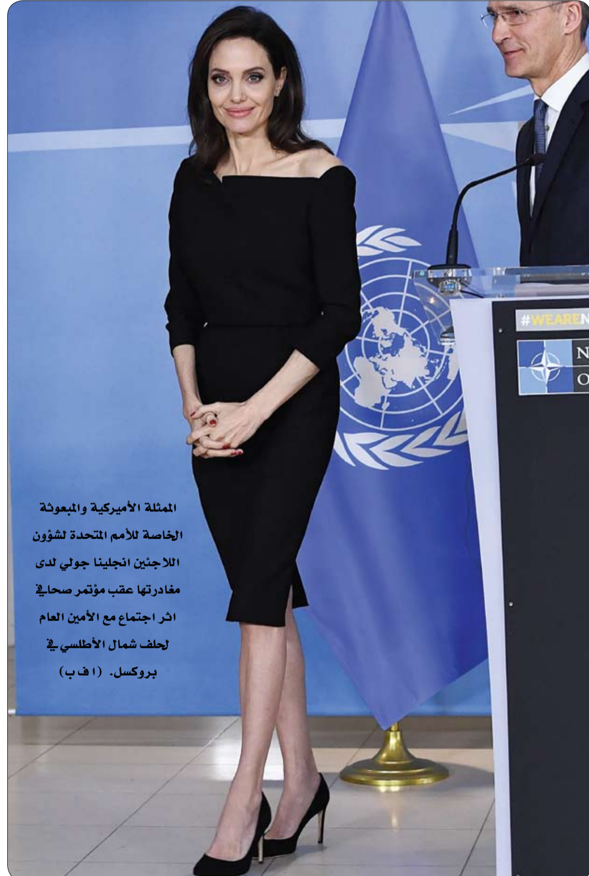
الممثلة الأميركية والمبعوثة الخاصة للأمم المتحدة لشؤون اللاجئين انجيلينا جولتي لدى مغادرتها عقب مؤتمر صحافي اثر اجتماع مع الأمين العام لحلف شمال الأطلسي في بروكسل.

أقدم رجل بلجيكي على الانتحار على الأرجح بعد أن قتل زوجته السابقة وأولادهما الثلاثة، بحسب ما أفادت وسائل إعلام بلجيكية. وقد عثر على جثة الوالد، وهو من أصول تونسية، عند أسفل مبنى في منطقة مولنبيك في العاصمة بروكسل حيث تم استدعاء عناصر الإسعاف قرابة الساعة 5.30 صباحا بسبب حريق اندلع في سيارة مركونة تحت العمارة. وقد رمى الرجل، البالغ من العمر 39 عاما، نفسه من الطابق العشرين، على ما يبدو.