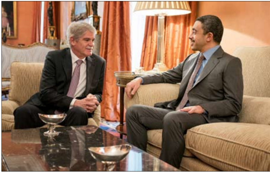
عبدالله بن زايد يبحث تعزيز التعاون مع وزير خارجية إسبانيا

داستيس بعد اللقاء بالتوقيع على مذكرة تفاهم للتعاون بين أكاديمية الإمارات الدبلوماسية والمدرسة الدبلوماسية الإسبانية. وتوجه سمو الشيخ عبدالله بن زايد آل نهيان - في كلمة ألقاها خلال المؤتمر الصحفي المشترك مع نظيره الإسباني - بالشكر الى معالي وزير الخارجية الإسباني على ضفاوة الاستقبال والمناحرة التي لساها وفد الدولة من جلالة الملك فيليب السادس ملك مملكة إسبانيا والحكومة والشعب الإسباني. وقال سموه "لا شك أن العلاقة بين البلدين الصديقين علاقة مهمة في مجالات عديدة حيث تربطنا علاقة وطيدة مع إسبانيا منذ عام 1972 خاصة أن هناك أكثر من سبعة آلاف إسباني مقيم في دولة الإمارات.. كما أن التبادل التجاري غير النفطي تجاوز الـ 2 مليار دولار وتعتقد أن هناك إمكانية بالدفع بالزيد من هذا التعاون المشترك". وأعرب سموه عن سعادته بالانتهاء اليوم من التوقيع على مذكرة تفاهم تتعلق بالتعاون بين