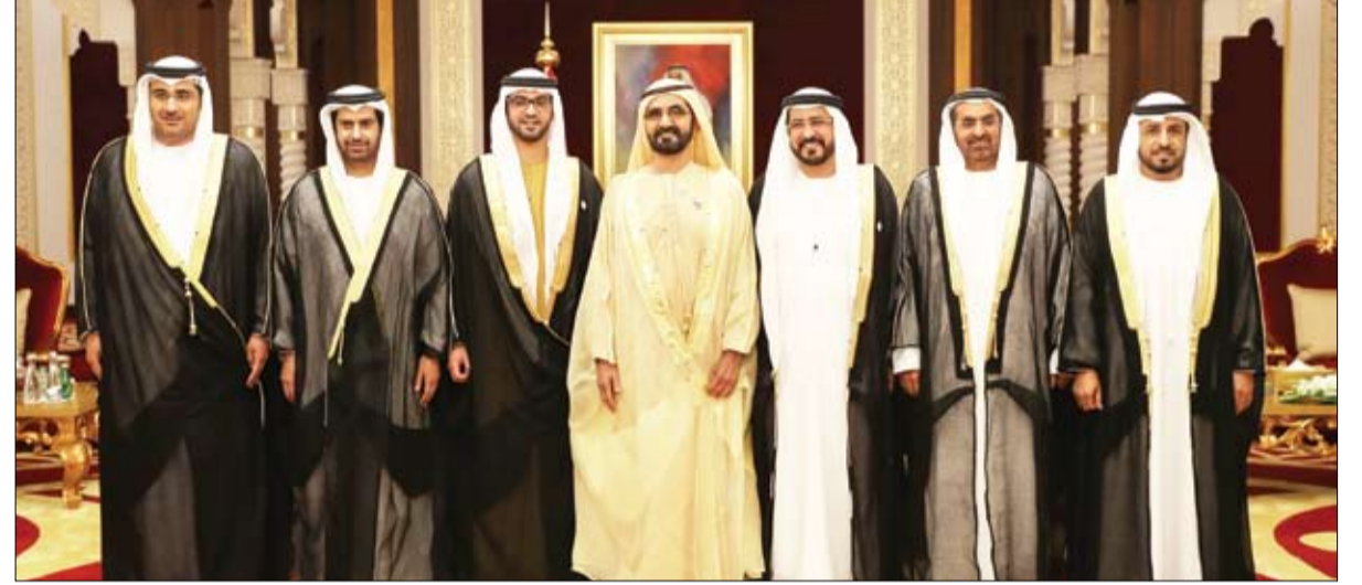
أمام سموه .. 6 سفراء جدد للدولة يؤدون اليمين القانونية