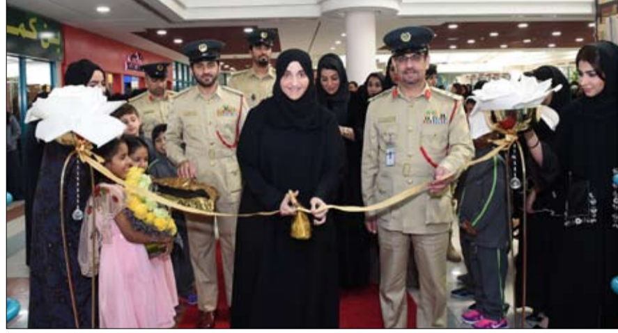
احتفاء بعام 2018 الذي يحمل شعار «عام زايد»