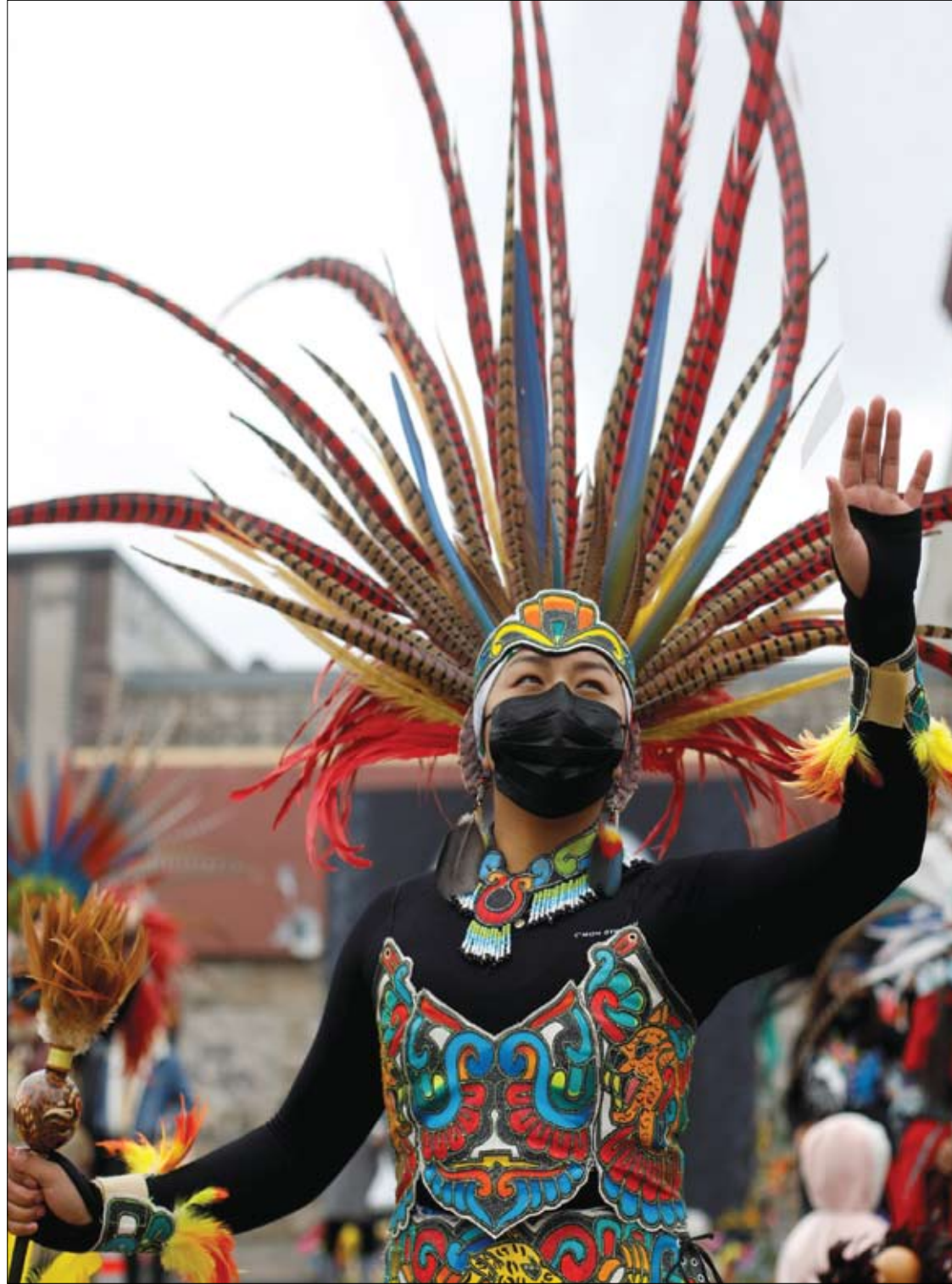
راقصة تؤدي عرضاً خلال احتفال «يوم الأرض» في مينيابوليس، مينيسوتا، الولايات المتحدة.

ويمكن للأدوية المضادة للذهان أن تزيد من خطر إصابة الشخص بارتفاع نسبة السكر في الدم.