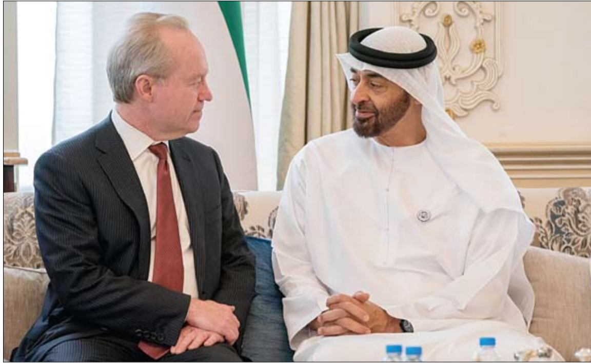
محمد بن زايد خلال استقباله توماس كيندي رئيس مجلس الإدارة والرئيس التنفيذي لشركة «رايشون، الأمريكية

نائب رئيس الدولة يصدر قرارين بتشكيل مجلس إدارة مركز محمد بن راشد للفضاء ومجلس أمناء خيرية محمد بن راشد دبي- وام: أصدر صاحب السمو الشيخ محمد بن راشد آل مكتوم نائب رئيس الدولة رئيس مجلس الوزراء حاكم دبي "رعاه الله" بصفته حاكماً لإمارة دبي القرارين رقمي "18" و"19" لسنة 2018 بتشكيل مجلس إدارة مركز محمد بن راشد للفضاء " ومجلس أمناء مؤسسة محمد بن راشد آل مكتوم للأعمال الخيرية والإنسانية". وحسب القرار رقم "18" لسنة 2018 يشكل مجلس إدارة مركز محمد بن راشد للفضاء برئاسة حمد عبيد الشيخ المنصوري وعضوية كل من يوسف حمد أحمد الشيباني نائباً للرئيس ومحمد عبد الله الزفين ومحمد سيف محمد القبالي ومنصور جمعة بو عصبية وذلك لمدة ثلاث سنوات قابلة للتجديد. (التفاصيل ص2) الهوية والجنسية تناشد السفارات حث رعايا بلدانها المخالفين على الاستفادة من مبادرة (احم نفسك بتعديل وضعك) أبوظبي- وام: ناشدت الهيئة الاتحادية للهوية والجنسية السفارات والبعثات الدبلوماسية المعتمدة لدى الدولة التعاون معها في تنفيذ مبادرة "احم نفسك بتعديل وضعك" التي سنتلقتها اعتباراً من الأول من أغسطس إلى نهاية شهر أكتوبر المقبلين. جاء ذلك خلال اللقاء الذي عقده سعادة العميد سعيد راكان الراشدي المدير العام لشؤون الأجانب والمنافذ بالإذابة في الهيئة مع ممثلي السفارات والبعثات الدبلوماسية المعتمدة لدى الدولة بمقر الهيئة في مدينة خليفة