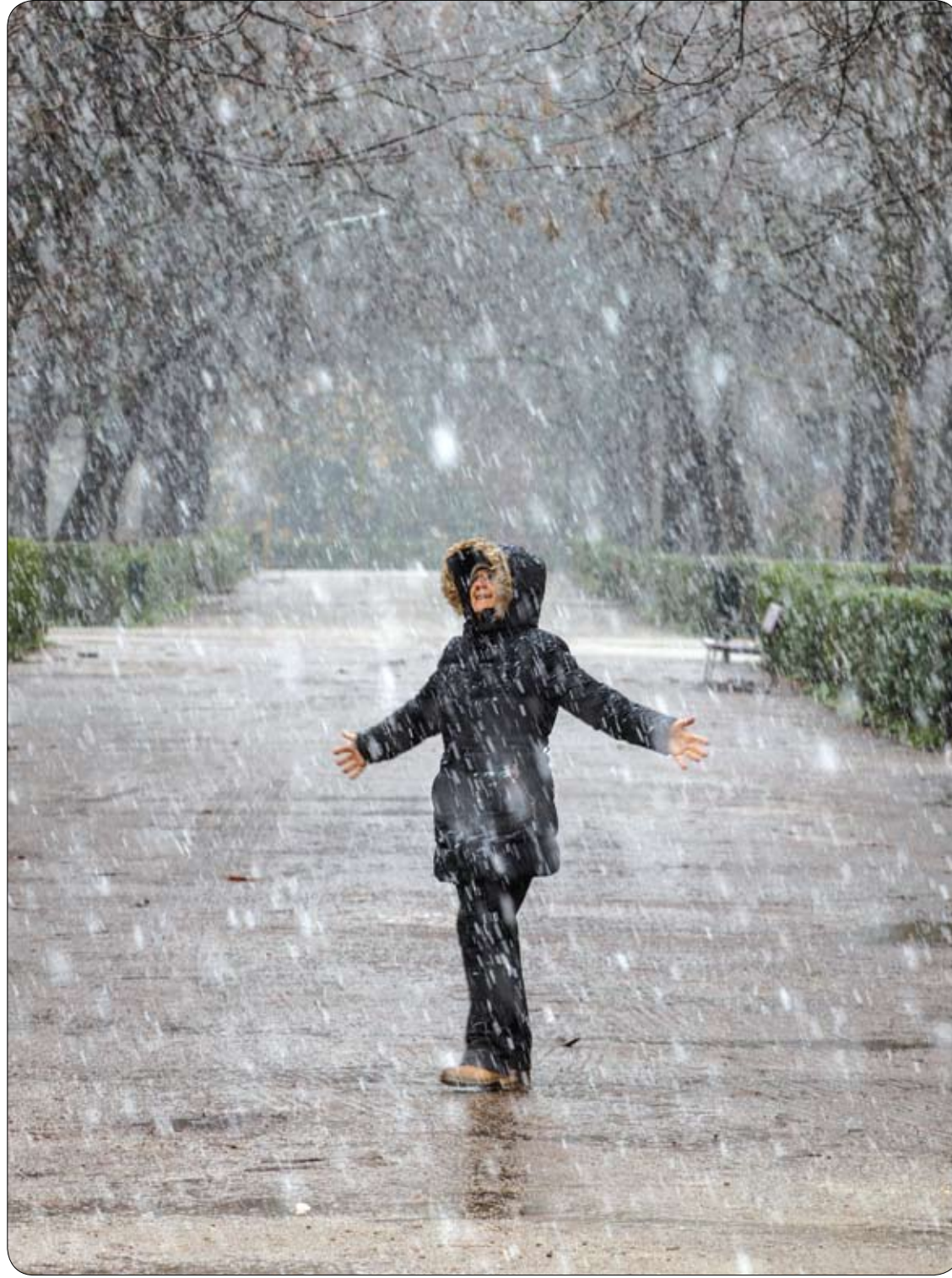
امرأة تقف فرحة بتساقط الثلوج الكثيف في حديقة ريتيرو في مدريد، إسبانيا.