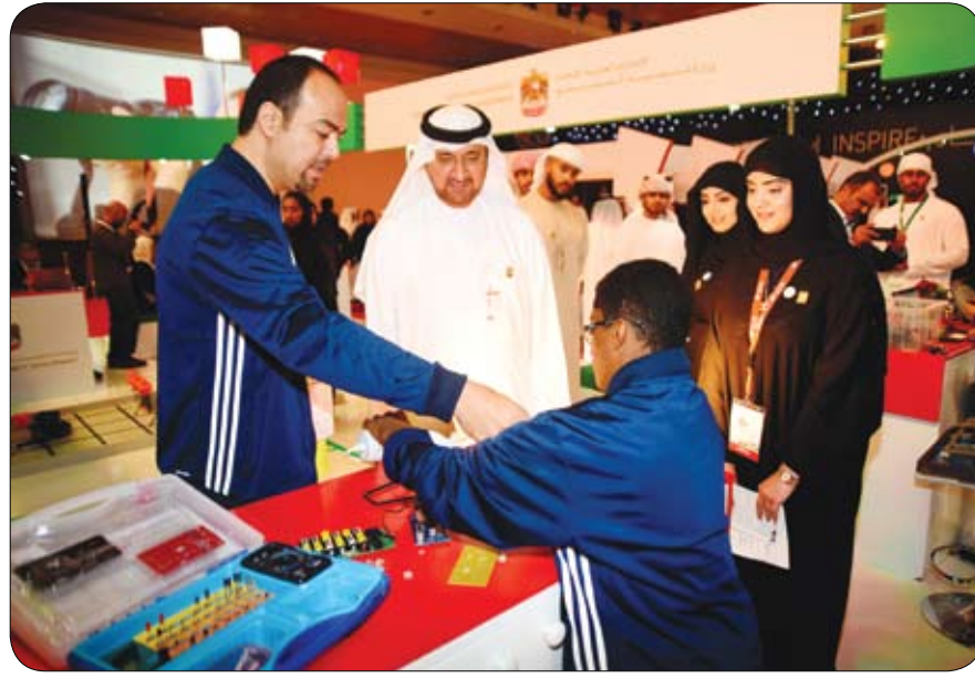
ضمن فعاليات الإمارات تبتكر