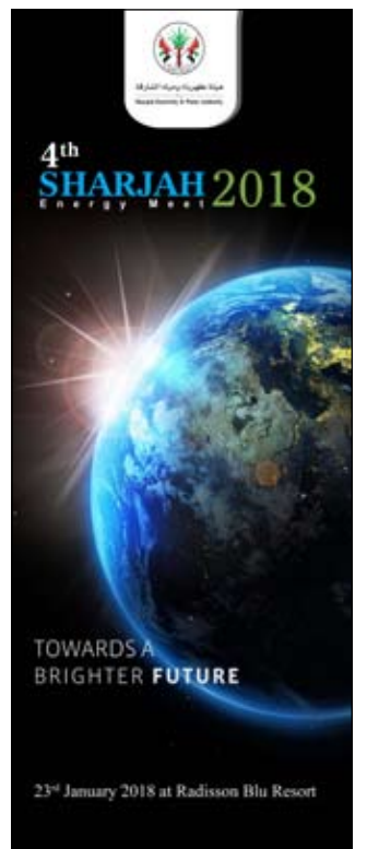
الملتقى تمت وفق معايير دقيقة نظرا لأهمية موضوع الطاقة على جميع الأصعدة حيث تتضمن الجلسات موضوعات تشمل أحدث التطورات والمفاهيم الجديدة في استخدامات كابلات الطاقة والتحول إلى الشبكات الذكية في العالم والابتكار في مجال الطاقة والطاقة البديلة وإدارة وترشيح الاستهلاك وحلول الإضاءة المستدامة للمدن الأكثر ذكاء وضرورة تكاتف الجهود والعمل المشترك لتخفيض استهلاك الطاقة من أجل مستقبل الأجيال القادمة من خلال نظرة تكنولوجية في صيانة مرافق الإنتاج والاعتماد على التنمية الخضراء. وذكر أن الملتقى يناقش تحديات الطاقة العالمية المستدامة وحلول إدارة الطاقة الذكية والمبتكرة وأهمية الاستخدام الأمثل من خلال الإدارة والتحكم لكفاءة الطاقة وتنوع مصادر الطاقة والاعتماد على الطاقة المتجددة. وأشار الليم إلى أن قائمة الشركات التي ستشارك في الملتقى هذا العام تضم عددا من كبريات الشركات العالمية المتخصصة التي تعتمد على الأبحاث العلمية وتخصص ميزانيات كبيرة للأبحاث والدراسات مما يساهم في

تنظم هيئة كهرباء ومياه الشارقة في الـ 23 من شهر يناير الجاري ملتقى الشارقة الرابع للطاقة لعام 2018 تحت شعار " نحو مستقبل مشرق " لاستعراض أحدث الأبحاث والدراسات العالمية في مجال إدارة الطاقة من خلال عرض 10 أوراق عمل حول مستقبل الطاقة والتحديات التي تواجهها وإدارة الطاقة الذكية. يستضيف الملتقى ممثلي أكثر من 100 شركة عالمية ومحلية إضافة إلى عدد من الجهات الحكومية بجانبا حضور 300 من المتخصصين والخبراء والمهتمين بشؤون الطاقة. وقال سعادة الدكتور المهندس راشد الليم رئيس هيئة كهرباء ومياه الشارقة إن تنظيم الملتقى يأتي في إطار استراتيجيتها عمل الهيئة ورسالتها التي أسسها صاحب السمو الشيخ الدكتور سلطان بن محمد القاسمي عضو المجلس الأعلى حاكم الشارقة كمنهج عمل والتي تمثل في اتخاذ كل الإجراءات التي تضمن تطبيق أحدث التكنولوجيات والاعتماد على المعرفة والأبحاث العلمية في تطوير مشروعات