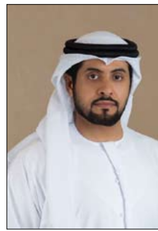
الدرهم تم اعتماده بناء على عدد من الملاحظات التي تلققتها الدائرة من قبل المستهلكين بشأن تحصيل كسور

العملات المعدنية المتداولة في السوق من كل فئات الدرهم، بما فيها الفئات الصغيرة واستعادته لإعادة سك أي فئة من الفئات الصغيرة إذا تبين أن هناك حاجة لذلك. وأوضح أن قرار الدائرة السابق بإجازة آلية تحصيل منافذ البيع كسور الدرهم بعد احتساب قيمة ضريبة القيمة المضافة في فواتيرها تم اتخاذه سابقا بناء على المادة 61 من قانون ضريبة القيمة المضافة الذي ينص على أنه "إذا تم حساب الضريبة المفروضة عن التوريد وكانت بها كسور للنفس يسمح لخاضع الضريبة بتقريب المبلغ إلى أقرب فلس على أساس التقريب الحسابي". وأوضح أن إلغاء قرار تقريب كسور