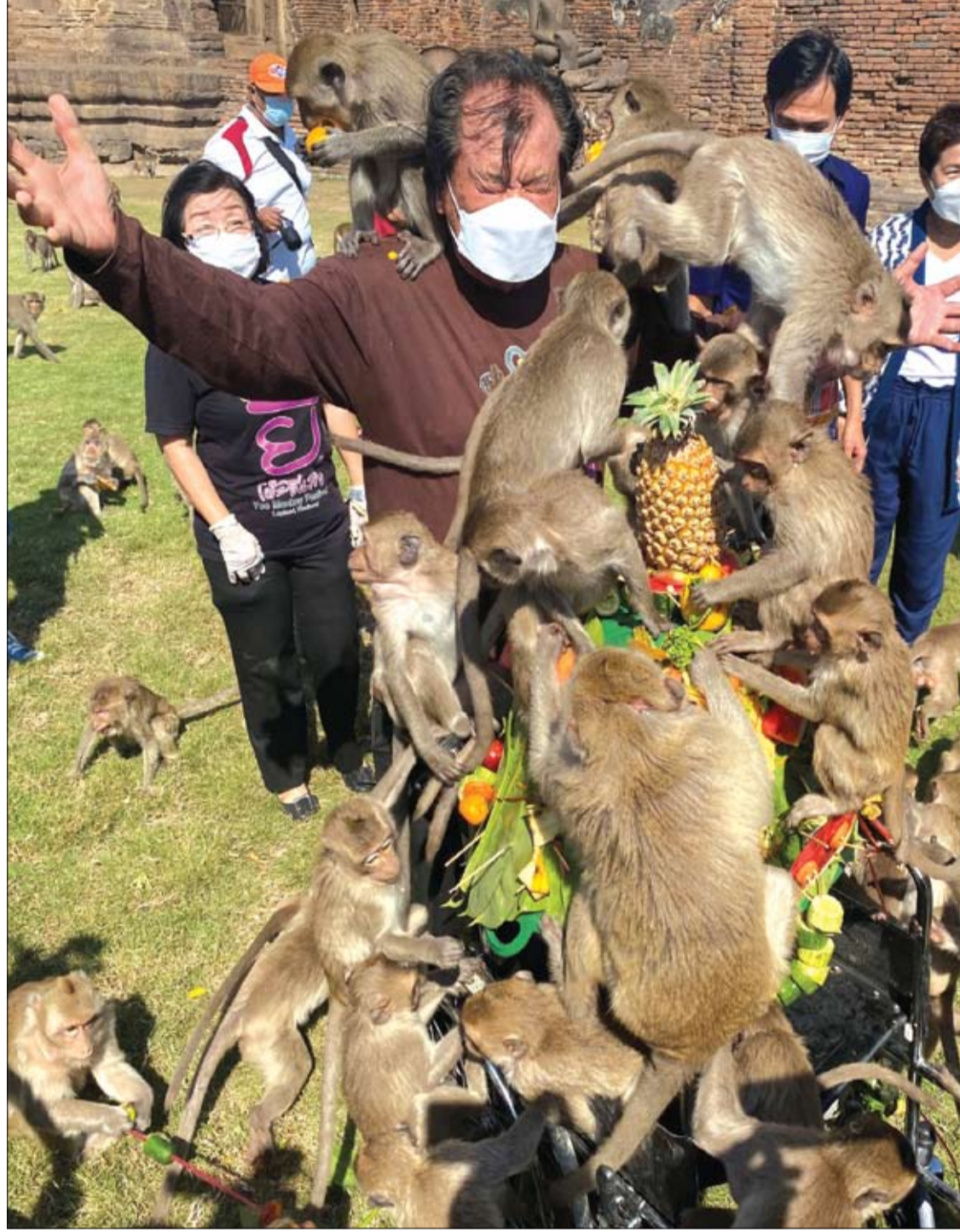
القرود تقفز على أحد المنظمين أثناء تناول الفاكهة خلال مهرجان القرود السنوي، الذي استؤنف بعد توقف دام عامين بسبب جائحة COVID-19، في مقاطعة لويوري، تايلاند.

وقال إنه عندما تنتشر السرطان إلى المخ، فإن الحاجز الدموي الدماغي "يتشوش" بالفعل. ونشرت النتائج في 13 أكتوبر في مجلة Science Translational Medicine.