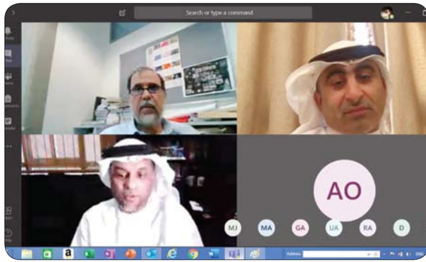
في مؤتمر صحفي عقد عن بعد