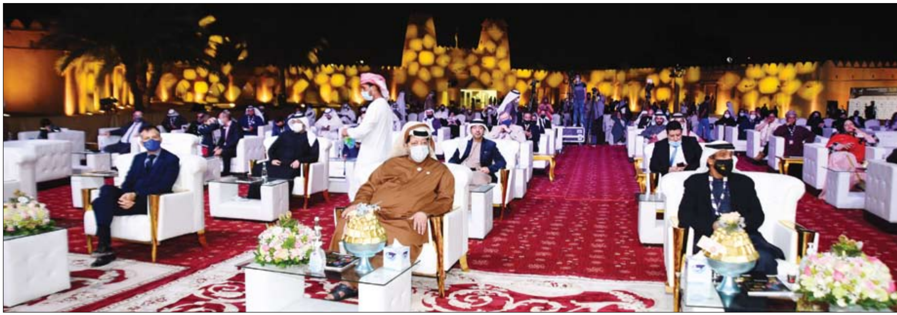
بحضور سعيد بن طحون آل نهيان