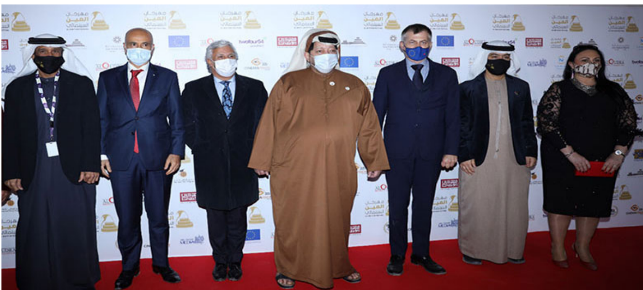
•• العين - الفجر

سعيد بن طحون يشيد بالمرحان مؤكدا دوره في استعادة قيمة الفن السابع في الإمارات