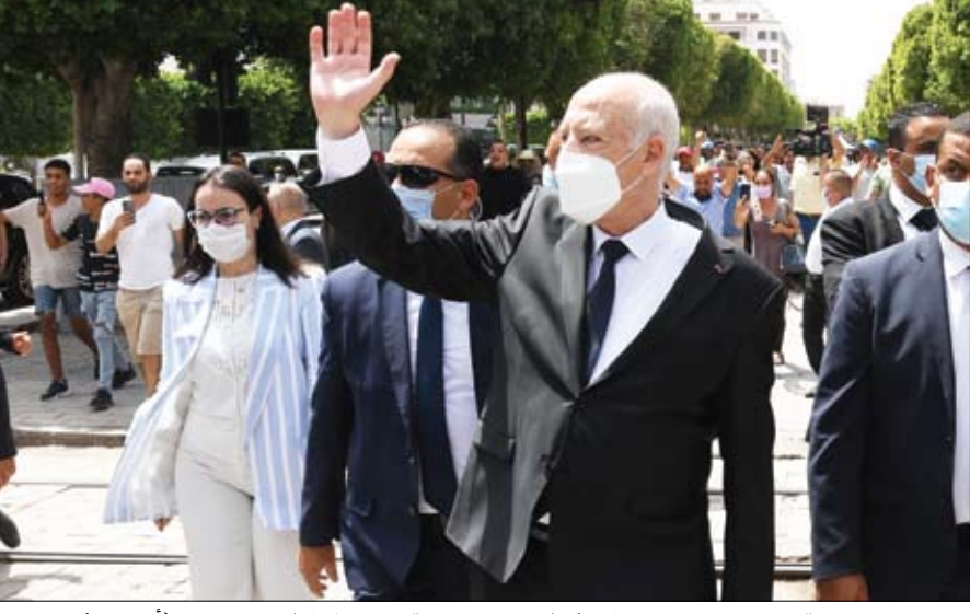
الرئيس قيس سعيد خلال تجوله في شارع الحبيب بورقيبة وسط العاصمة تونس (أرشيفية)

تلقى صاحب السمو الشيخ محمد بن زايد آل نهيان ولي عهد أبوظبي نائب القائد الأعلى للقوات المسلحة اتصالاً هاتفياً من الرئيس الأمريكي جو بايدن رئيس الولايات المتحدة الأمريكية الصديقة. أعرب خلاله عن شكره وتقديره للدعم والتسهيلات التي قدمتها دولة الإمارات في عمليات إجلاء الدبلوماسيين والرعاعيا الأمريكيين من أفغانستان إضافة إلى مواطني الدول الصديقة بجانب الأفغان الذين يحملون تأشيرات هذه الدول.