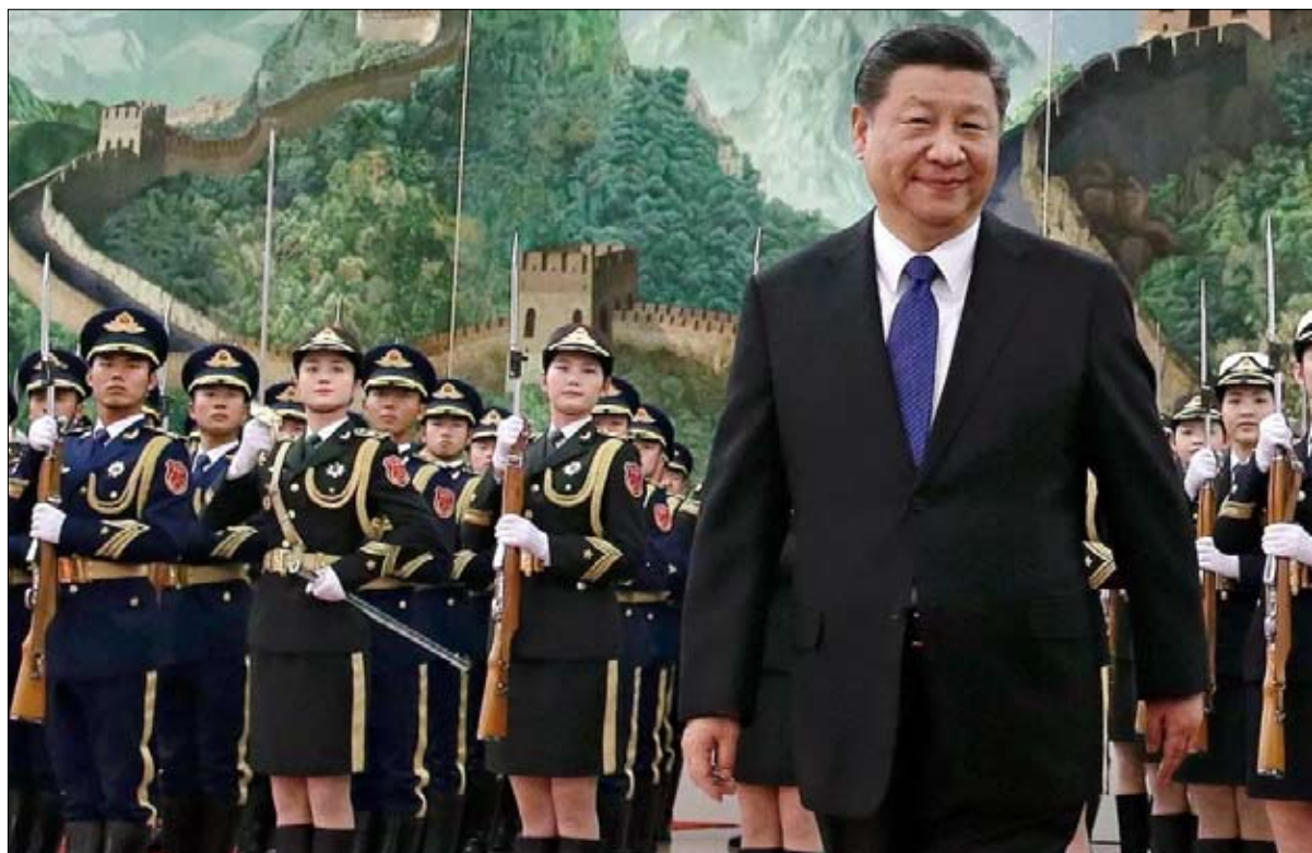
الصين تغازل من أجل أمنها وتجارتها

الماضي بممثل عن طالبان، واصفا الاجتماع بـ ”الإيجابي والبناء“. وفي اليوم نفسه، أشاد وزير الخارجية الروسي، سيرجي لافروف، الخيري والمتفائل بشكل خاص، ”بالعملية الإيجابية الجارية في شوارع كابول حيث الوضع هادئ، وحيث تضمن طالبان النظام العام.“