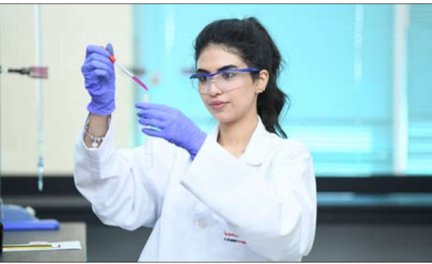
التدريسية سبيدا في 22 من الشهر نفسه.

نظم الأرشيف الوطني ورشة تدريبية افتراضية بهدف رفع درجة وعي المعلمين الجدد في كل من مدارس الإمارات الوطنية والمدرسة الإسبانية - بتاريخ وثقافة مجتمع الإمارات العربي وتراثه وعاداته التي تسهم بتسيير الهوية الوطنية، وتعزيز الولاء والانتماء لدى أجيال الطلبة، وذلك ما يقرب المسافة بين الطلبة وذويهم ومعلميهم. وقد اهتمت الورشة - التي نظمها الأرشيف الوطني عبر تقنيات التواصل التفاعلية - بتعريف المعلمين وموظفي الجهاز الإداري الجدد - بالقيم الوطنية المستمدة من تاريخ دولة الإمارات العربية المتحدة ومن تراثها، وبتعزير خبراتهم بمآثر المجتمع الإماراتي التي يتوجب غرسها في نفوس الطلبة. حققت الورشة - التي جاءت تأكيداً على الشراكة الاستراتيجية، وبناء على مذكرة التفاهم البمرية بين الأرشيف الوطني ومدارس الإمارات الوطنية - بنجاحات تعنى بمتوية الإمارات، وتبرز قوة دولة الاتحاد، ودور الآباء المؤسسين في التخطيط الفعال الذي أسهم في توثيق كل مرحلة بابتكارات وإبداعات أدت إلى التطوير والنهضة الشاملة والمتكاملة على مدار الخمسين عاماً الماضية، ومن هذه الرؤية تستكمل، متوية الإمارات 2071، مسار الريادة والاستدامة في الخمسة عقود القادمة.