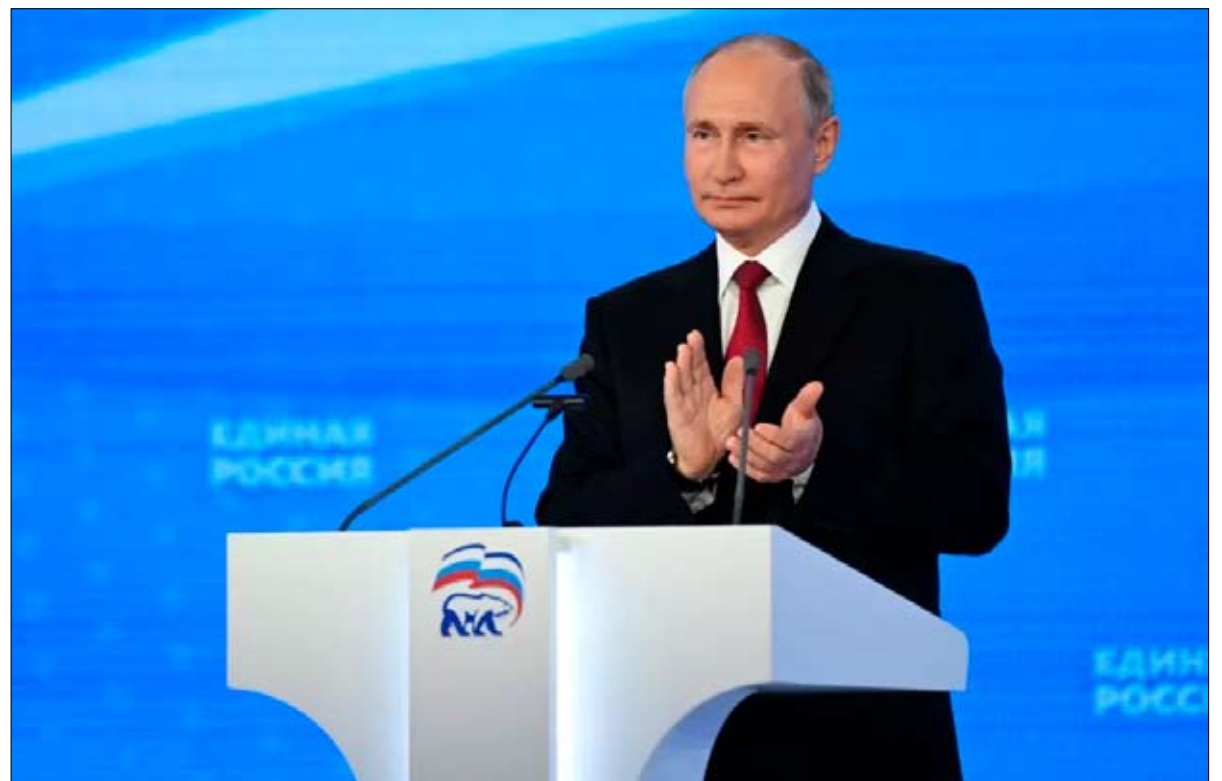
بوتين يؤمن مناطق نفوذه

وأوروبا الشرقية ومقره جنيف. والخطاب مشابه لخطاب الجار الصيني. يمكن للشركاء الدوليين الجدد أيضاً السماح لطالبان بجذب رأس المال الأجنبي إلى هذا البلد المنكوب بالفقر. أفغانستان، على سبيل المثال، الغنية بالليثيوم، تسيل لعاب الصين، أكبر منتج للسيارات الكهربائية في العالم. وبالمثل، يسعى النظام الصيني إلى تعزيز مشروع ”طرق الحرير الجديدة“، الذي انضمت إليه كابول عام 2016، والذي يتكون من بناء بنية تحتية عملاقة. وقد سبق افتتاح ممر جوي بين البلدين عام 2018، وكذلك خط سكة حديد عبر كازاخستان وأوزبكستان عام 2019. و”للمضي قدماً، يجب أن يكون هناك استقرار سياسي في البلاد، يحدد أنطون بوندار، لذلك ستحرص الصين على عدم التسرع ومراقبة الوضع.