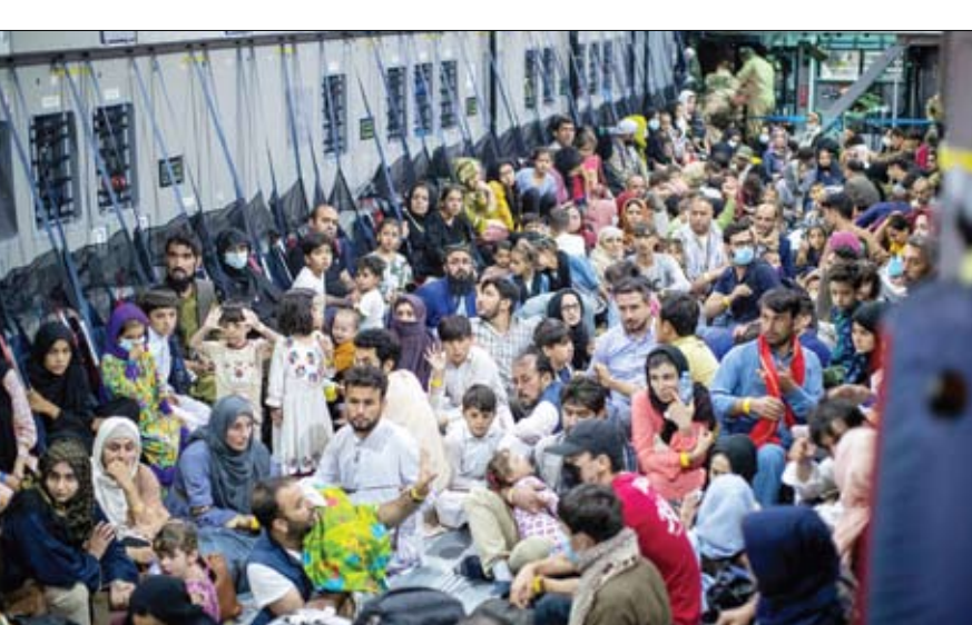
طائرة نقل ألمانية تصل إلى أوزبكستان حاملة عدداً كبيراً من اللاجئين الأفغان

أبيض، من دون أن يتضح كيف مات هؤلاء الأشخاص. كما يظهر في الصور العديد من الجرحى. وقال مراسل القناة ستوارت رامسي الذي كان موجوداً في المطار، إن الأشخاص الذين كانوا في مقدم الحشد تعرضوا للنفس، مشيراً إلى أن المسعفين ينتقلون من مصاب إلى آخر. ولفت إلى أن الناس يعانون الجفاف ويشعرون بالرعب. وقد صور فريقه جنوداً يرشون الحشد بخراطيم مياه لإبقائهم منعشدين. وقال المراسل إن تسجيل وفيات في خضم الفوضى السائدة، هو أمر لا مفر منه.