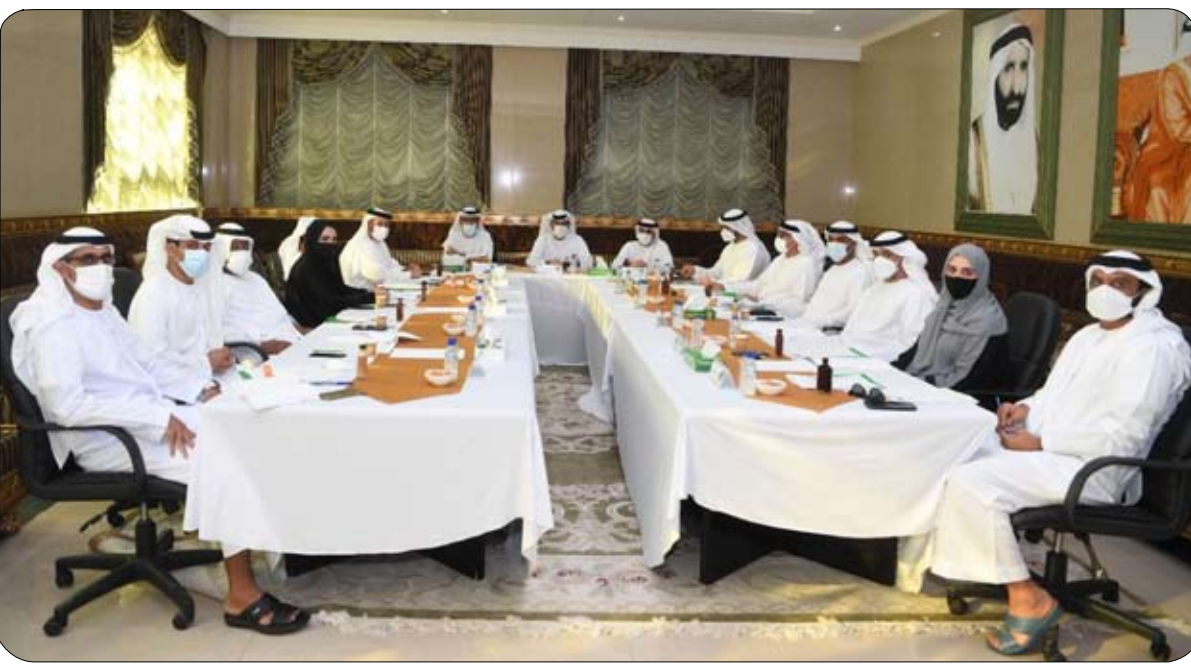
النادي بالعمل بدأ واحدة من أجل سيكون أفضل بتضاضر جهود الكيان وبإذن الله مستقبل النادي الجميع. إليها جميع منتسبيه. واختتم البطران: نعد جميع أبناء سياسته المستقبلية التي يتطلع

أعوام تخضع لتدريبات أساسية تقترن بالرفاهية والمتعة لتعزيز تلقهم بهذه الرياضة ومواصلة الشوار بنبات. أما الفئة العمرية من 7-12 عاماً فيتم إدخالها في أجواء البطولات والحمام عبر اعتماد منهجية تدريبية تركز بشكل أكبر على تقنيات القتال والمواجهة ورفع اللياقة البدنية