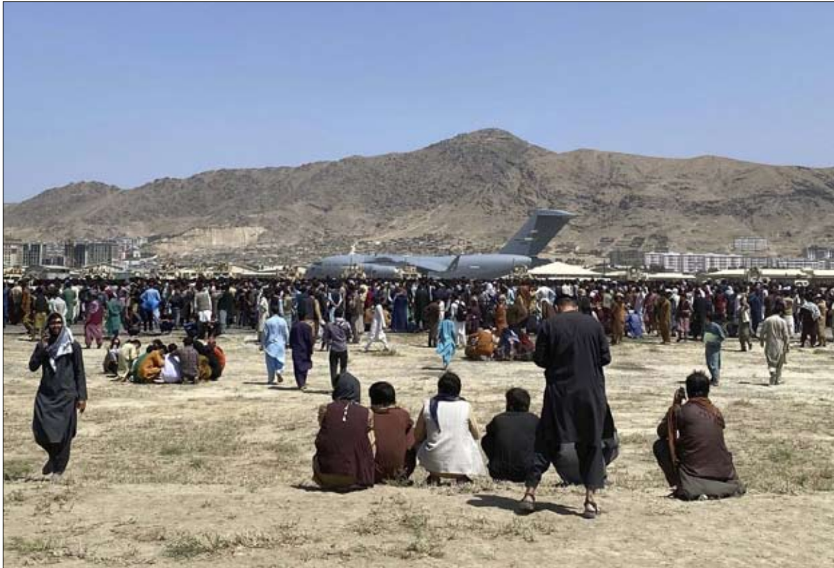
الانسحاب الفاضل يترجم عدم كفاءة النخبة الحاكمة