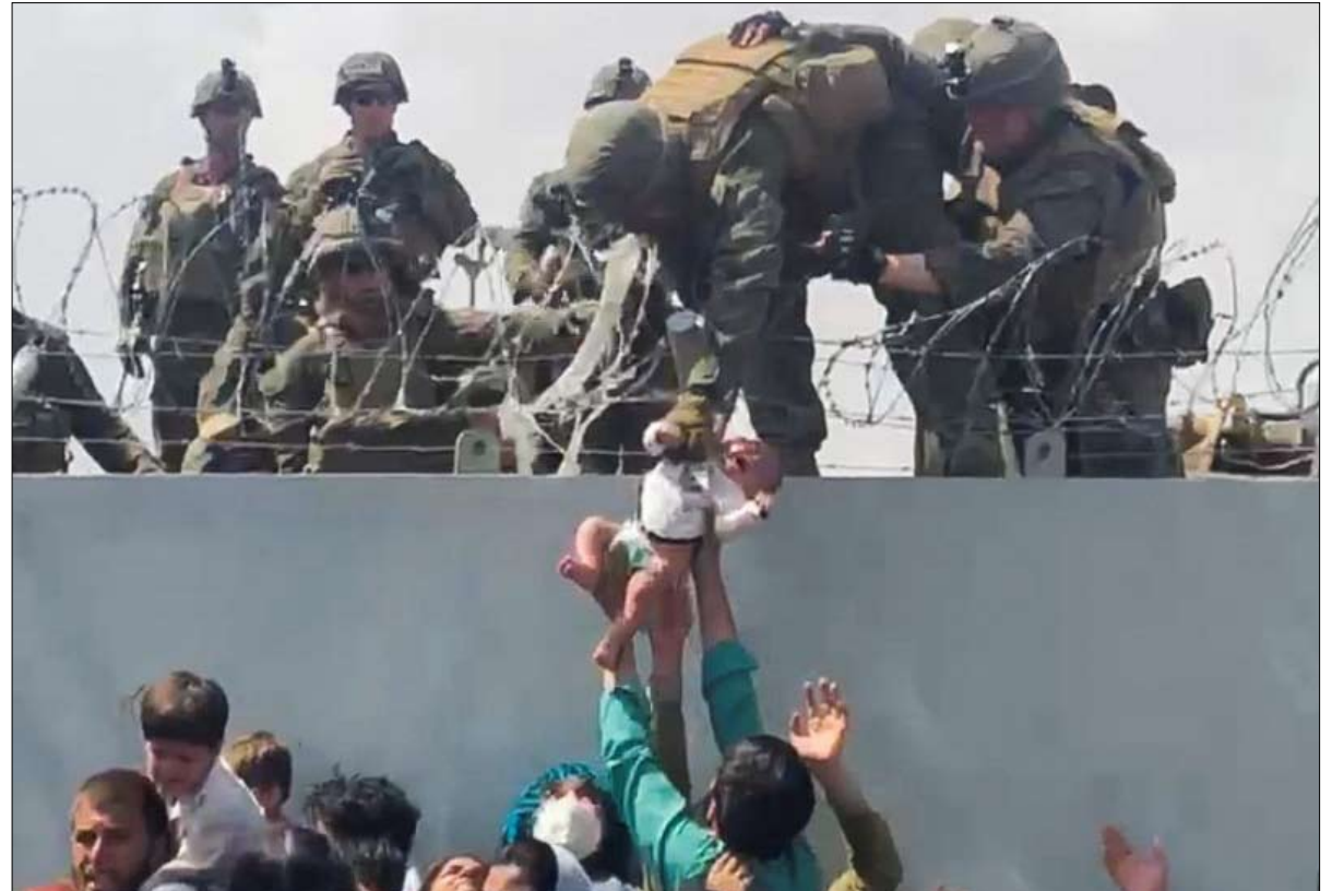
مشهد يسعد أعداء الولايات المتحدة