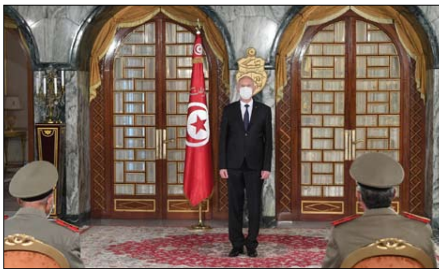
الرئيس التونسي قيس سعيد

اعلان تونس عن إغلاق الحدود بشكل كامل مع ليبيا، مؤكدة أن إغلاق الحدود مع ليبيا إجراء صحي استراتيجي في إطار مكافحة كورونا. ذُثب متضرد من جهتها أفادت جريدة الشروق المحلية، في عددها الصادر أمس الأحد، أن الوحدات الأمنية تمكنت من الإطاحة بإرهابي كان يخطط في إطار ما يسمى بمبادرة "الذئاب المنردة" لاستهداف الرئيس قيس سعيد خلال زيارة كان سيؤديها إلى إحدى المدن الساحلية. وأضافت الصحيفة ذاتها، أن