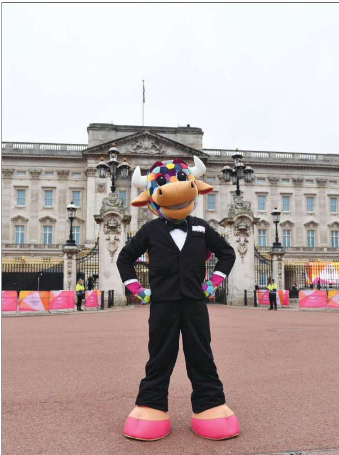
بيري، التيمية الرسمية لدورة ألعاب الكومنولث في برمنغهام 2022، تقف خارج قصر باكنغهام في لندن 14 فبراير

وبعد عام، عاد الشاب إلى المستشفى لأنه أصيب بفقدان السمع وضعف البصر، لكن الأطباء لم يتمكنوا من إيجاد سبب. وقال التقرير إنه بحلول سن السابعة عشرة، أصبحت رؤية المريض أسوأ بشكل تدريجي، لدرجة العمى. واعتترف الصبي أنه تجنب الأطعمة ذات القوام المعين وتناول الأطعمة السريعة نفسها لأكثر من عقد. ومن خلال التحقيق في تغذية الصبي، وجد الأطباء نقصاً في فيتامين B12 وفيتامين (د)، وانخفاض كثافة المعادن في العظام، وانخفاض مستويات النحاس والسيلينيوم، ومستوى عالٍ من الزنك. وبحلول الوقت الذي تم فيه تشخيص حالته، كان المريض يعاني من ضعف دائم في الرؤية. وحذر التقرير من أن الضرر البصري المرتبط بالتغذية يجب أن يأخذ في الاعتبار دائماً من قبل الأطباء الذين يعثرون على أي مريض يعاني من أعراض بصرية غير مبررة. وقال التقرير: "إن المخاطر المرتبطة بسوء صحة القلب والأوعية الدموية والسمنة والسرطان المرتبطة باستهلاك الوجبات السريعة معروفة جيداً، لكن سوء التغذية يمكن أن يلحق الضرر الدائم بالجهاز العصبي، وخاصة الرؤية. من المحتمل أن تكون الحالة قابلة للعكس إذا اكتشفت مبكراً. ولكن إذا تركت دون علاج، فإنها تؤدي إلى العمى الدائم". وقال الدكتور دينيز آتان، المعد الرئيسي للدراسة: "رؤيتنا لها تأثير كبير على نوعية الحياة والتعليم والتوظيف والتفاعلات الاجتماعية والصحة العقلية. هذه الحالة تسلط الضوء على تأثير النظام الغذائي على الصحة البصرية والجسدية، وحقائق أن تناول السرعات الحرارية ومؤشر كتلة الجسم ليسا مؤشرات موثوقة للحالة التغذوية".