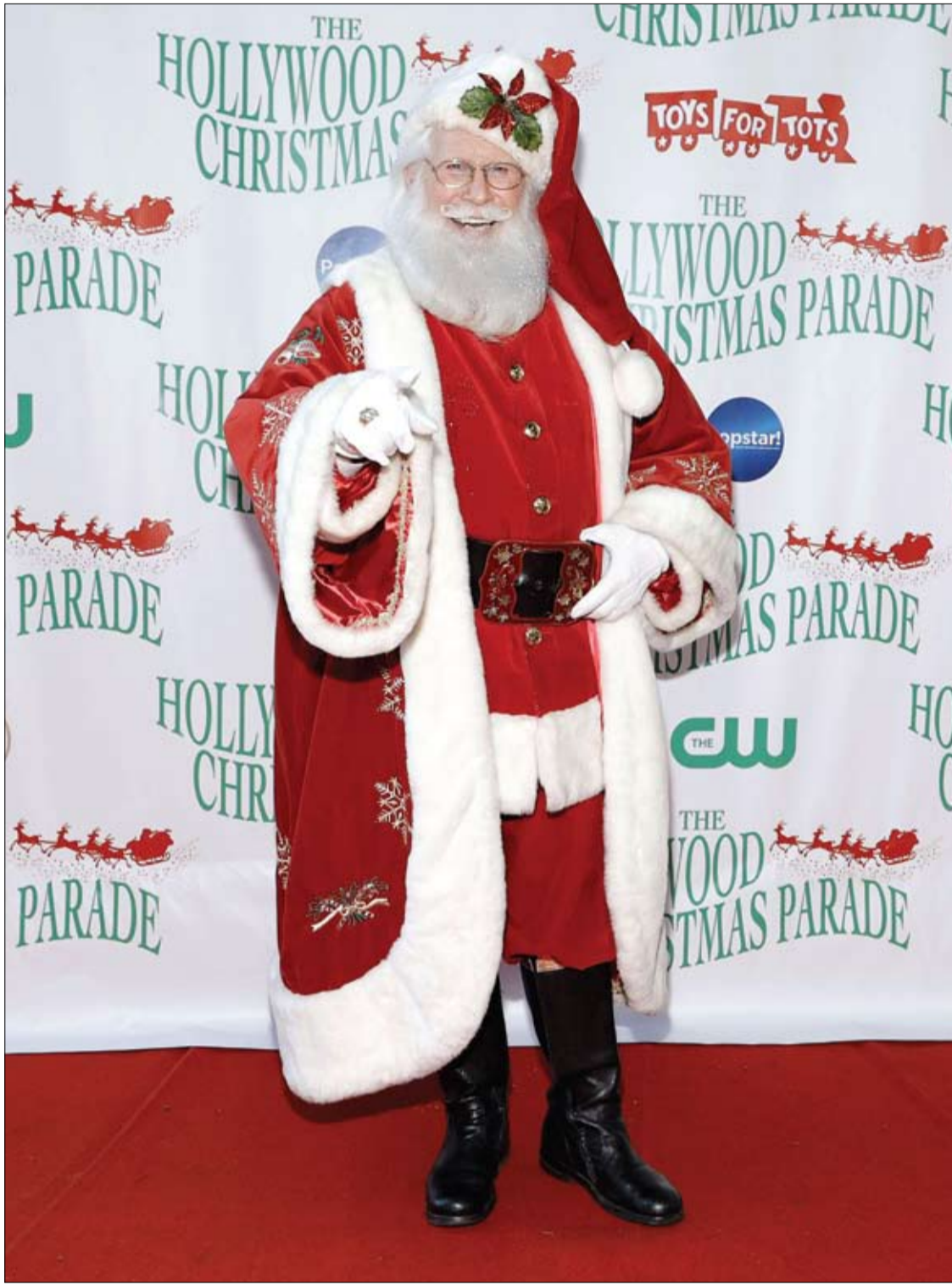
تيم كوناغان يلعب دور سانتا كلوز في موكب هوليوود السنوي التاسع والثمانين بعيد الميلاد في لوس أنجلوس.

ويشير الباحثون، إلى أنه يمكن استخدام قدرة السلالات البكتيرية التي تم تحديدها في هذه الدراسة على استقلاب الأحماض الصفراوية بالتحكم بتجميعها لتحسين الصحة. ومع ذلك يؤكدون على ضرورة إجراء المزيد من الدراسات لتأكيد الارتباط بين الأحماض الصفراوية وطول العمر.