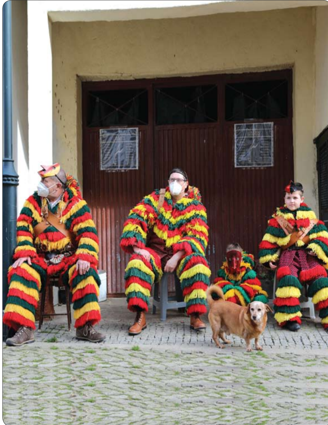
قرويون يرتدون الأزياء التقليدية يحيون مهرجان شروفيتايد في الشارع الفارغ، عوضا عن الكرنفال المزدهم السنوي الذي تم حظره بسبب قيود الإغلاق وسط جائحة فيروس كورونا في بودنيس، البرتغال.

يمكن أن يكون للأطعمة التي نأكلها تأثير إيجابي أو سلبي على مستويات الكوليسترول لدينا. ويعد تناول الأسماك الزيتية أحد أكثر الطرق فعالية لخفض مستويات الكوليسترول الضارة. ووفقا لـ Harvard Health، فإن تناول السمك مرتين أو ثلاث مرات في الأسبوع يمكن أن يخفض LDL بطريقتين: عن طريق استبدال اللحوم، التي تحتوي على دهون مشبعة معززة لـ LDL، ومن خلال توفير دهون أوميغا 3 التي تخفض LDL. كما تقلل أوميغا 3 من الدهون الثلاثية في مجرى الدم وتحمي القلب أيضا من خلال المساعدة في منع ظهور إيقاعات القلب غير الطبيعية. ويمكن أن تؤدي بعض القرارات الغذائية إلى زيادة كمية الكوليسترول الضار في الدم.