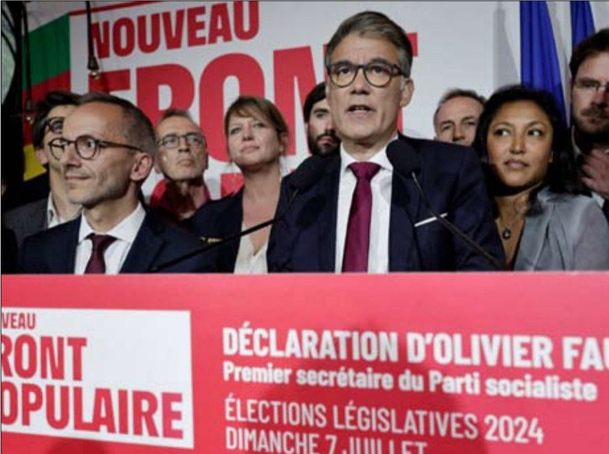
زعيم الاشتراكيين أوليفيه فور