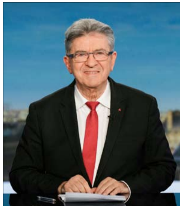
جان لوك ميليشون